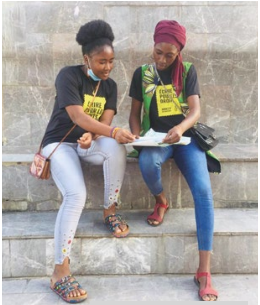
Manifestation organisée par Amnesty International Bénin aux fins de la rédaction de lettres, décembre 2020.

Les droits humains ne sont pas un luxe dont on ne peut jouir que lorsque la situation le permet.