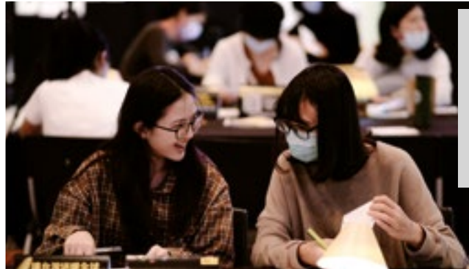
Manifestation de rédaction de lettres organisée par Amnesty International Taiwan, décembre 2020.

Outre le fait d'encourager à rédiger des lettres, Amnesty International s'entretient avec les personnes qui ont