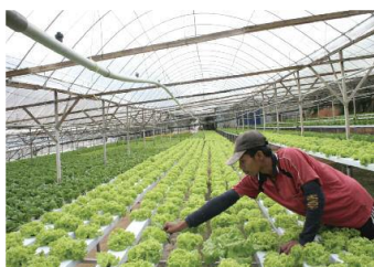
Travailleur migrant, Cameron Highlands, Malaisie (juillet 2009).