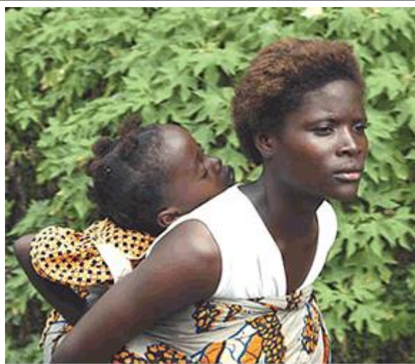
Une femme et sa fille fuient les combats dans l'ouest de la Côte d'Ivoire .

Il convient de rappeler que le problème des réfugiés libériens n'est qu'un des aspects de la terrible crise humanitaire qui secoue la Côte d'Ivoire depuis l'insurrection d'éléments armés en septembre 2002. Ce conflit a provoqué des déplacements massifs de populations civiles cherchant à fuir les zones de combat. Des centaines de milliers de personnes (des Ivoiriens ainsi que des ressortissants de la sous-région, notamment des Burkinabé, des Maliens et des Guinéens) ont dû quitter leurs maisons afin d'échapper aux exactions commises par toutes les parties au conflit. Le nombre de personnes déplacées au sein même de la Côte d'Ivoire s'élèverait, selon les autorités ivoiriennes, à plus d'un million et demi 6 .