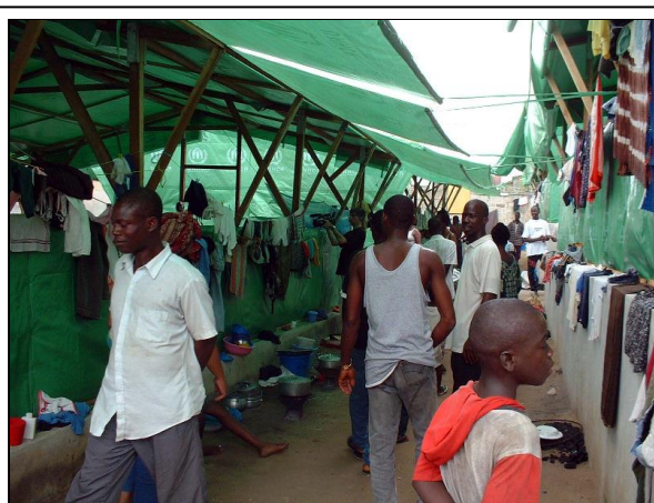
Le Centre de transit d'Attoban. .

Les réfugiés sont particulièrement visés lorsqu'ils doivent traverser les nombreux