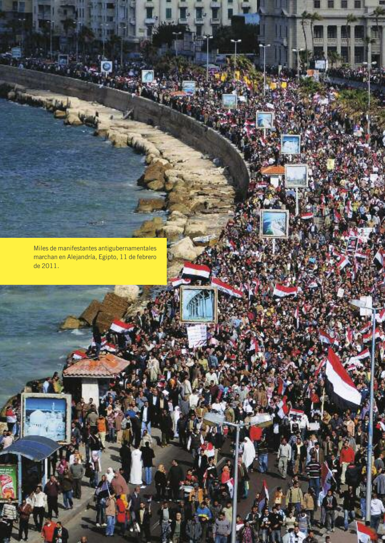
Miles de manifestantes antigubernamentales marchan en Alejandría, Egipto, 11 de febrero de 2011.