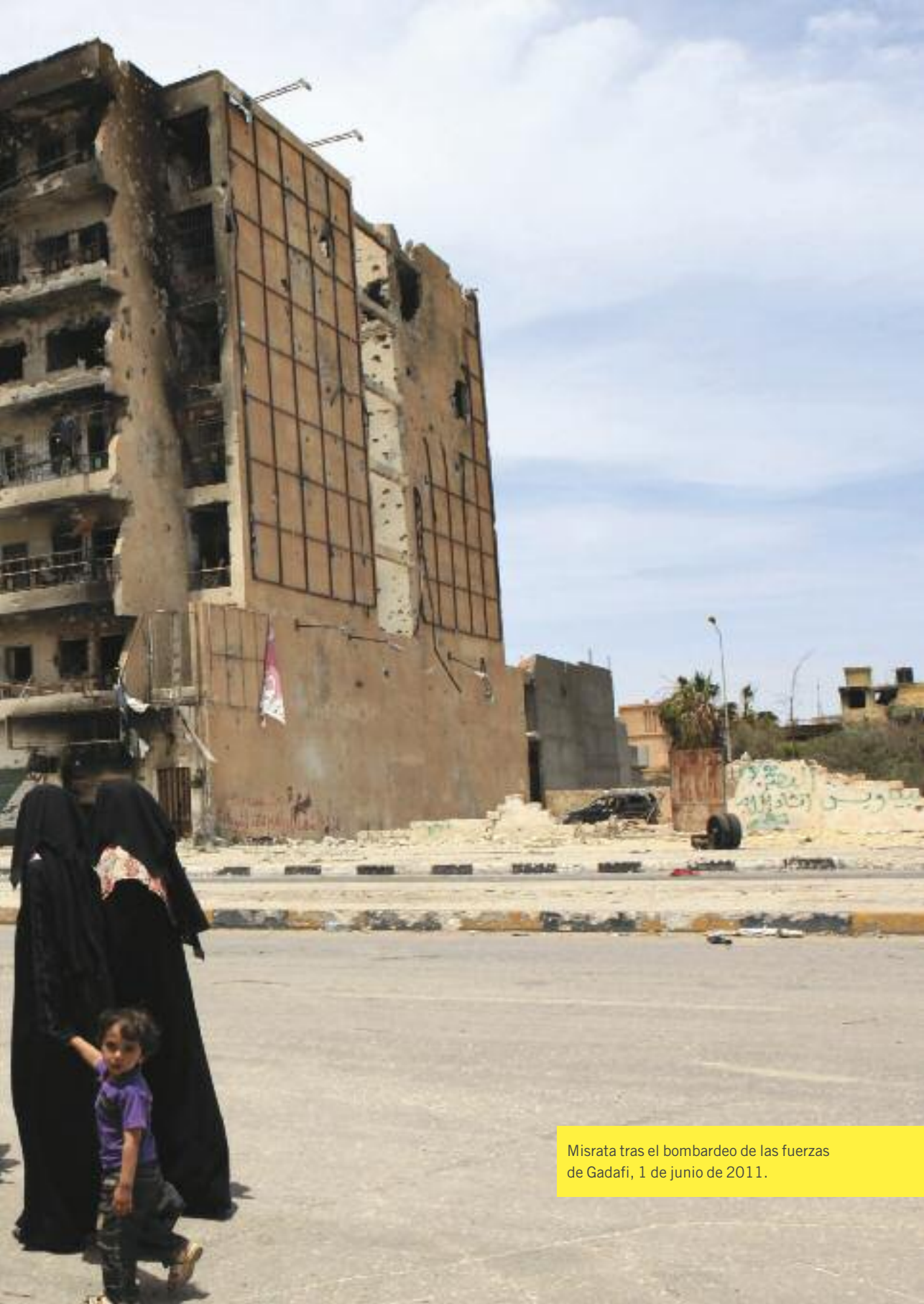
Misrata tras el bombardeo de las fuerzas de Gadafi, 1 de junio de 2011.