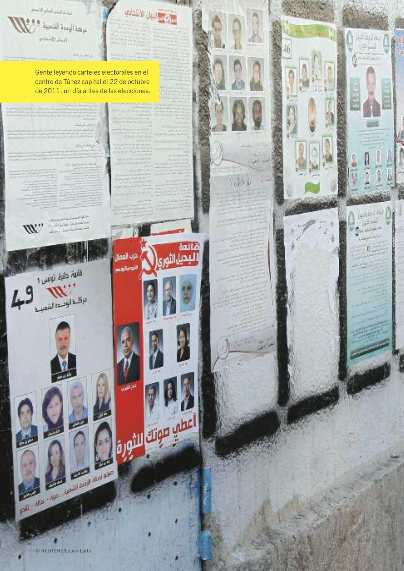
Gente leyendo carteles electorales en el centro de Túnez capital el 22 de octubre de 2011, un día antes de las elecciones.