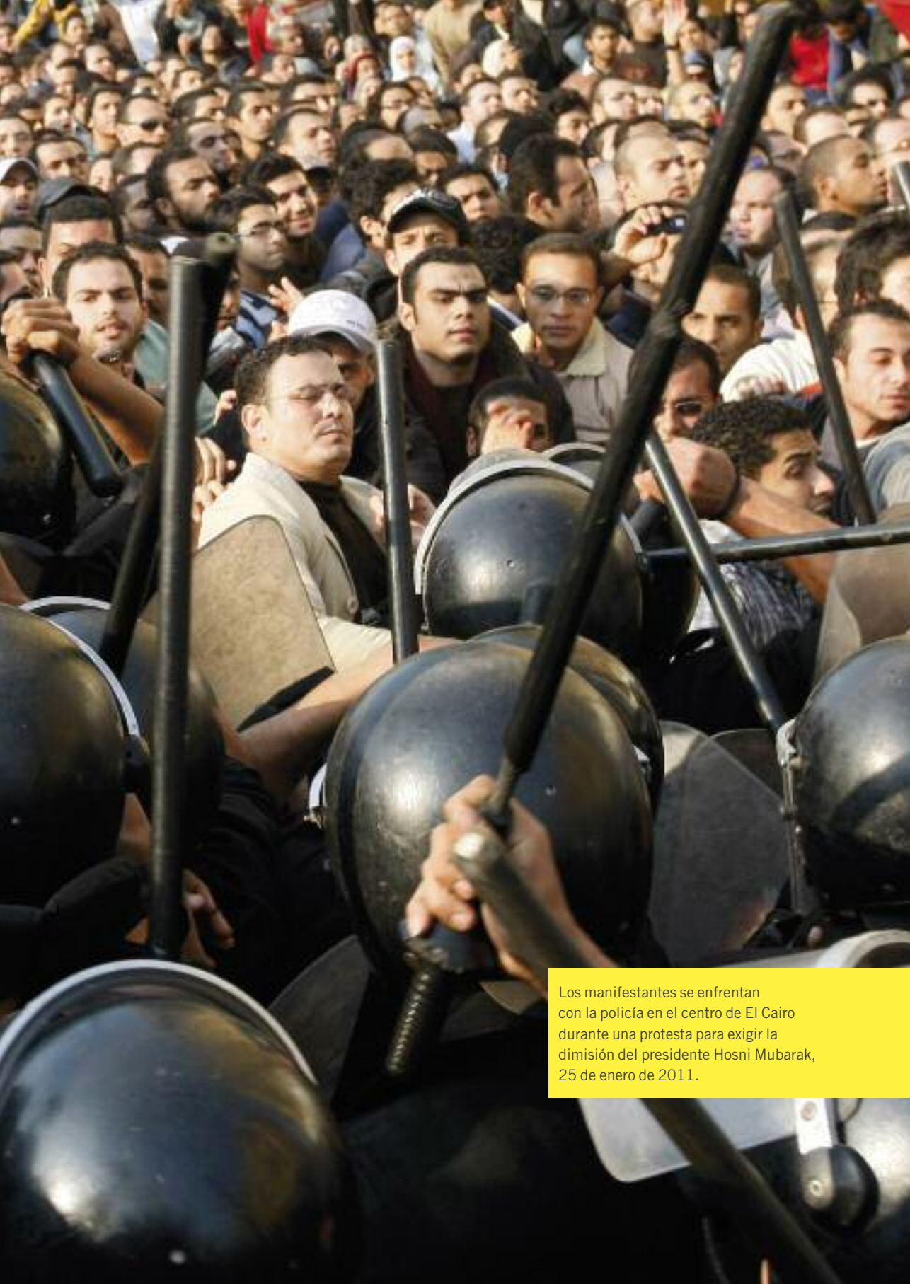
Los manifestantes se enfrentan con la policía en el centro de El Cairo durante una protesta para exigir la dimisión del presidente Hosni Mubarak, 25 de enero de 2011.