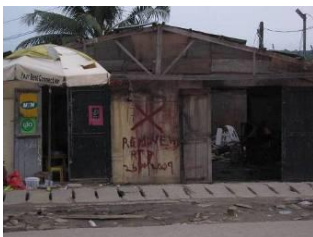
Bâtiments le long de Njemanze Street marqués d'une croix rouge signalant leur démolition prochaine. Ils ont été détruits en novembre 2009.

Des résidents ont déclaré que les hommes en civil, qui n'appartenaient pas semble-t-il aux forces de sécurité, avaient pillé des maisons pendant les opérations. Amnesty International a appris par des occupants et des témoins que les forces de sécurité n'étaient pas intervenues pour arrêter les pilleurs.