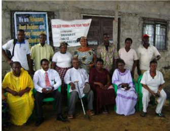
Membres de l'association des propriétaires du quartier d'Abonnema Wharf.

« J'ai pensé à partir. Le problème, c'est l'argent [...]. À l'heure actuelle, les gens n'ont même pas assez pour manger. Comment vont-ils se réinstaller ? Il y a des gens [dont les revenus proviennent] du littoral [pêche, etc.]. Que feraient-ils ? Puisque je n'ai pas d'argent, je resterais bien là [également] [...]. Même pour moi, cela va être un très gros problème. Et pour ceux qui ne sont pas instruits ? »