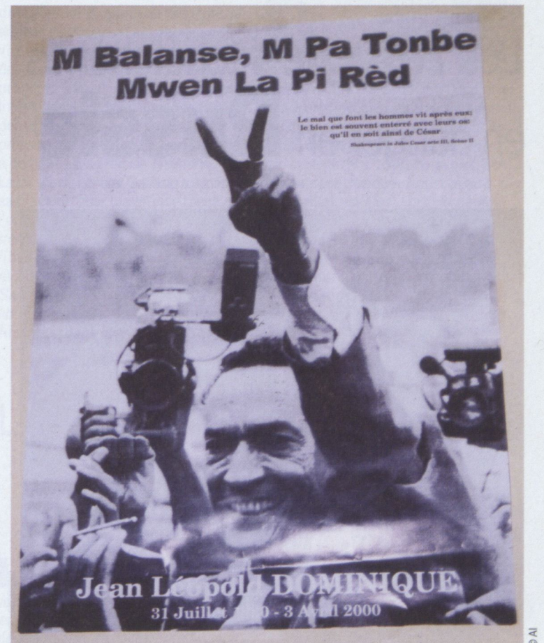
« Je n'ai d'autre arme que mon métier de journaliste, mon micro, et ma foi inébranlable de militant pour le changement » (extrait d'un éditorial de Jean Dominique diffusé en octobre 1999).