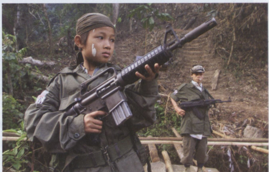
Un enfant de douze ans qui se bat aux côtés des rebelles karen contre le gouvernement militaire du Myanmar pose avec son fusil (janvier 2000).