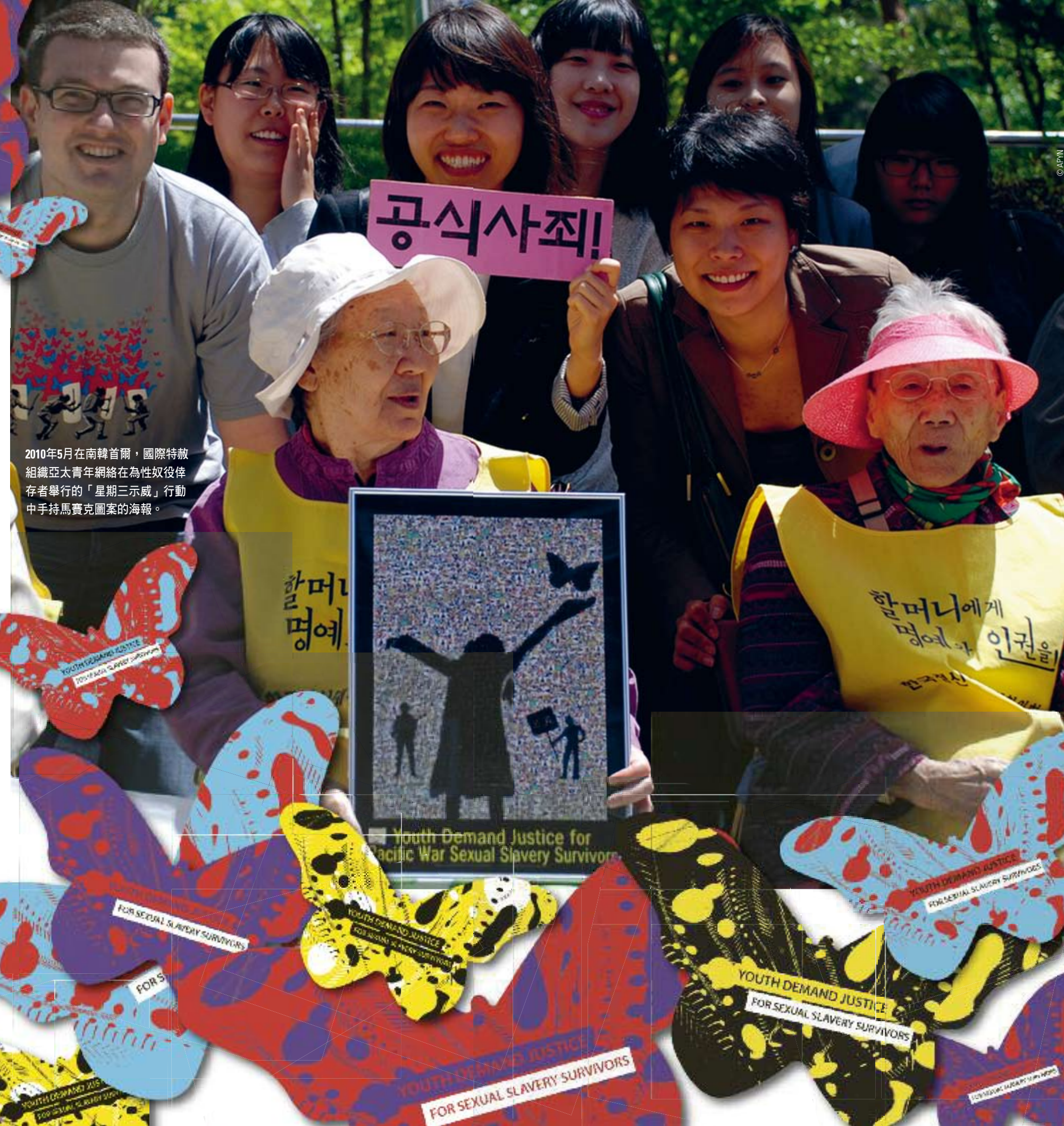
2010年5月在南韓首爾，國際特赦組織亞太青年網絡在為性奴役倖存者舉行的「星期三示威」行動中手持馬賽克圖案的海報。

國際特赦組織與人權團體Conectas共同合作，撰寫國際人權期刊（International Journal on Human Rights）的特別號，主題是關於千禧年發展目標（MDGs）與企業責任議題。當2010年9月聯合國關於MDGs高峰會召開時，這些文章就能免費在線上閱讀： www.surjournal.org