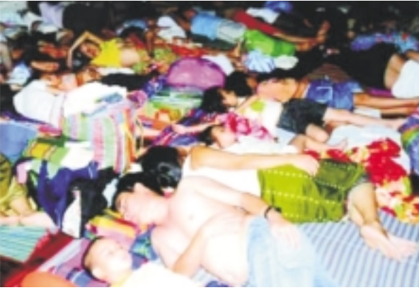
寮國苗族難民被拘留在泰國北部Nong Khai鎮一所沒有窗戶且過度擁擠的移民拘留中心內。

泰國提供暫時性的庇護給鄰國數以千計為躲避迫害與衝突而流亡的人們，其人道形象普獲肯定。因此，國際特赦組織呼籲泰國政府繼續堅守其國際法上的義務。所有關於遣返寮國苗族尋求庇護者的計畫都必須停止，直到泰國政府建立一個公平、完善的程序，以確保他們能夠行使其尋求庇護的權利。