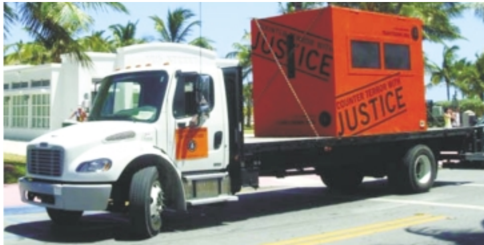
仿造關達那摩灣真實囚室製作的同比例模型，正於美國境內進行巡迴展出。

這項巡迴展於5月8日在邁阿密展開，之後行經費城、緬因州的波特蘭、紐約、最後預計在6月26日，也就是「國際酷刑被害人日」（International Day in Support of Victims of Torture）當天，抵達華盛頓首府。