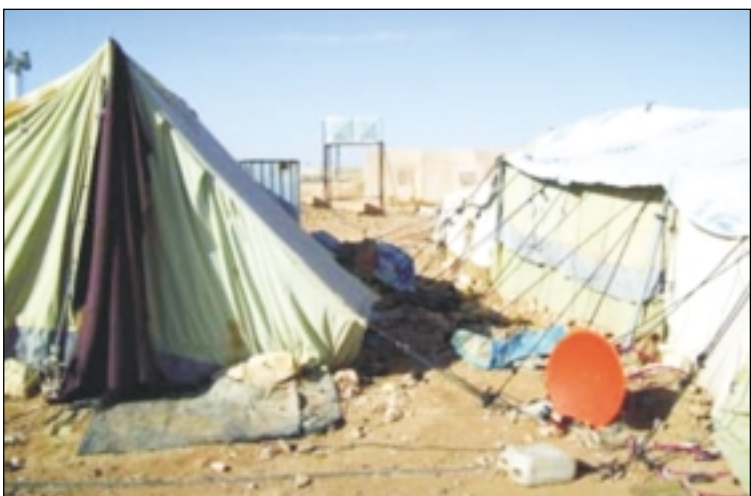
位於伊敘邊境三不管地帶的al-Tanf難民營。（2008年3月，國際特赦組織攝）

參見：Suffering in silence: Iraqi refugees in Syria (MDE 14/010/2008).