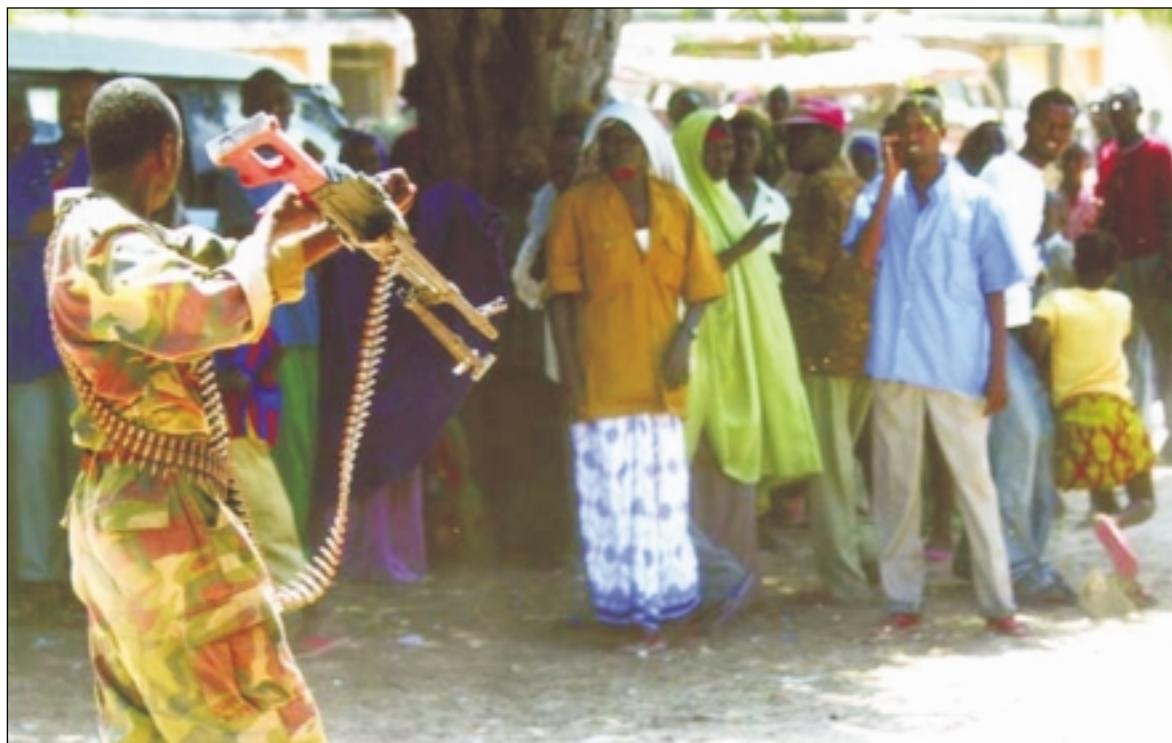
索馬利亞首都摩加迪休，一名看守糧食的政府軍士兵高舉機槍威脅平民。（2007年5月）