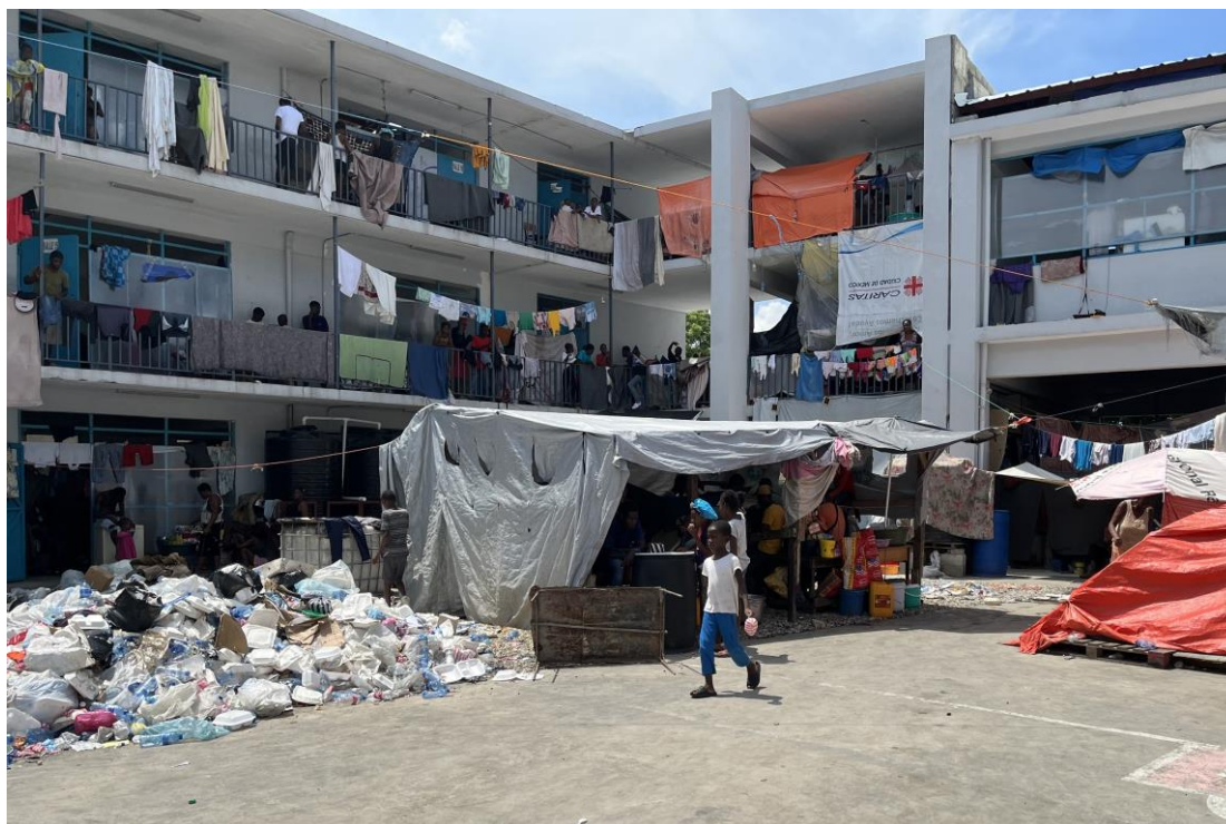
Vyolans gang yo te deplase di mil moun. Anpil moun te oblije pran abri nan lekòl tankou sa nan kapital la, Pòtoprens.

Distans pou rive fen 2024, plis pase 1 milyon moun – plis pase mwatye nan yo se timoun – te deplase atravè Ayiti. 28 Sa te reprezante yon multiplikasyon pa twa pa rapò a 2023. 29 Moun yo refijye nan divès lekòl, legliz, batiman gouvènmantral yo, divès espas louvri ak fanmi akèy. 30 Anpil moun te kouri ale nan pati nò ak pati sid peyi a, sa ki ogmante presyon sou enstalasyon ak resous yo ki deja limite nan rejyon sa yo. 31 Prè 180000 moun twouve yo nan sit deplasman yo, konfwonte a divès risk konsiderab nan kesyon pwoteksyon nan divès kondisyon vi ekstrèmman pa apwopriye, 32 ke chèchè Amnisti Entènasyonal yo te kapab konstate dirèkteman reyalye a.