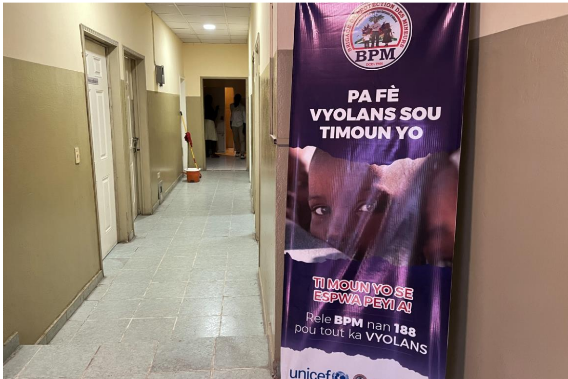
Yon afich nan youn nan biwo santral Brigad Polis Nasyonal Ayisyen an pou Pwoteksyon Minè yo dekri timoun yo kòm "espwa peyi a" e li avèti pou yo pa komèt vyolans kont yo.

Temwayaj sa yo ak prèv nimerik souliye anplè travay ki nesese pou asire yon gerizon kominote efikas pou tout pwosesis reentegrasyon fonksyone. Tout pwosesis reentegrasyon pa dwe ap desann. Ayisyen yo pa gen anpil lafwa nan gouvènman santral siksesif yo, 135 e konsa pwosesis ki baze nan kominote a ki ta pi enpòtan pou kominote ki afekte yo epi jwenn sipò yo ta dwe priorize.