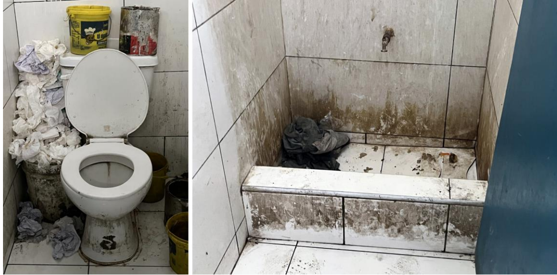
Pandan vizit Septanm 2024 yo a, chèchè Amnisti Entènasyon yo te obsève kòman twalèt nan sit deplasman yo pa t aksesib pou moun andikape yo.

Eta yo gen obligasyon “pou pran tout mezi nesèsè” pou pwoteje timoun yo kont efè danjere vyolans ame yo ak pou garanti ke yo “jwenn aksè ak sèvis sante ak sosyal apwopriye, ki gen ladan yo retablisman sikososyal ak reentegrasyon sosyal”. 409 Gouvènman dwe garanti disponibilite ak aksesibilite sèvis sante mantal yo nan repons li an, ki gen ladan yo mande yon asistans teknik ak yon asistans finansyè; donatè yo ak lòt aktè imanite yo dwe kontribiye ak ranfòsman sistèm sante mantal yo. Òf sèvis sante mantal yo pa dwe diminye aprè faz ijans lan – kreyasyon sistèm swen dirab yo ap esansyèl. 410