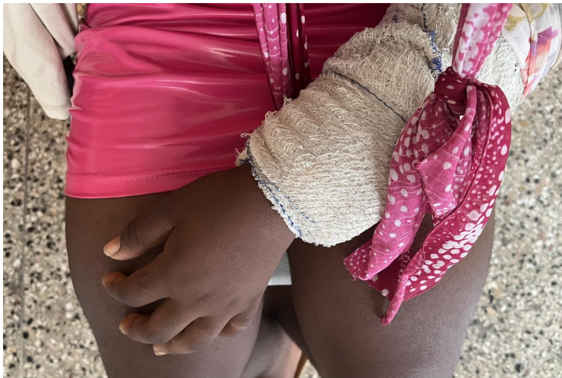
Yon tifi 14 ane te dekre bay Amnisti Entènasyonal ke li te touche pa kat bal 11 Septanm 2024 nan moman afwontman gang yo apre yon abit nan yon match foutbòl nan Site Solèy te akòde yon chout penalite ki konteste.

al wè zanmi... Mwen pa vle yo pran mwen pa sipriz ankò epi pou yo touye mwen nan mitan katouch... Toutan m ap eseye dòmi, tout bagay ap fè m mal. 319