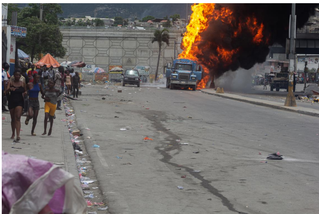
Moun k ap kouri aprè manm gang ki t ap eseye sezi yon kamyon sitèn dyèzèl te tire yon katouch ki lakoz kamyon an eksploze, Pòtoprens, 4 Jen 2024.

“MWEN SE YON TIMOUN, POUKISA SA TE RIVE MWEN?” ATAK GANG YO SOU ANFANS TIMOUN YO AN AYITI