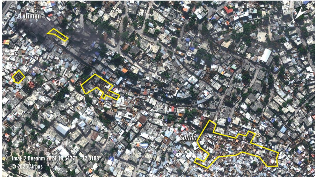
Imaj Satelit 2 Desanm 2024 endike kèk destriksyon nan katye Solino Pòtoprens, yon zòn ki temwen gwo afwontman ant gang yo ak lapolis. Poligòn jòn yo mete aksan sou zòn ki gen gwo domaj ak batiman ki detwi. Lafimen vizib k ap monte nan yon zòn.

Nan kanaj ki genyen nan anvayi katye yo, manm gang yo konn pafwa kraze mi pou antre nan kay yo epi asasine fanmi yo ak zam kole sou yo. Nan mwa Out 2023, manm gang yo ki te anvayi yon kay nan Kafou-Fèy te tiye ak katouch yon mesye epi te blese pitit gason l lan ki te gen 10 ane, sa ke de (2) travayè imanitè te deklare. 326 Papa a te pran bal ant zye li yo devan timoun lan. Amnisti Entènasyonal te rankontre timoun ki te konfime evènman yo epi te montre chèchè yo sikatris sou pwatrin li akòz yon bal li te pran nan vant.