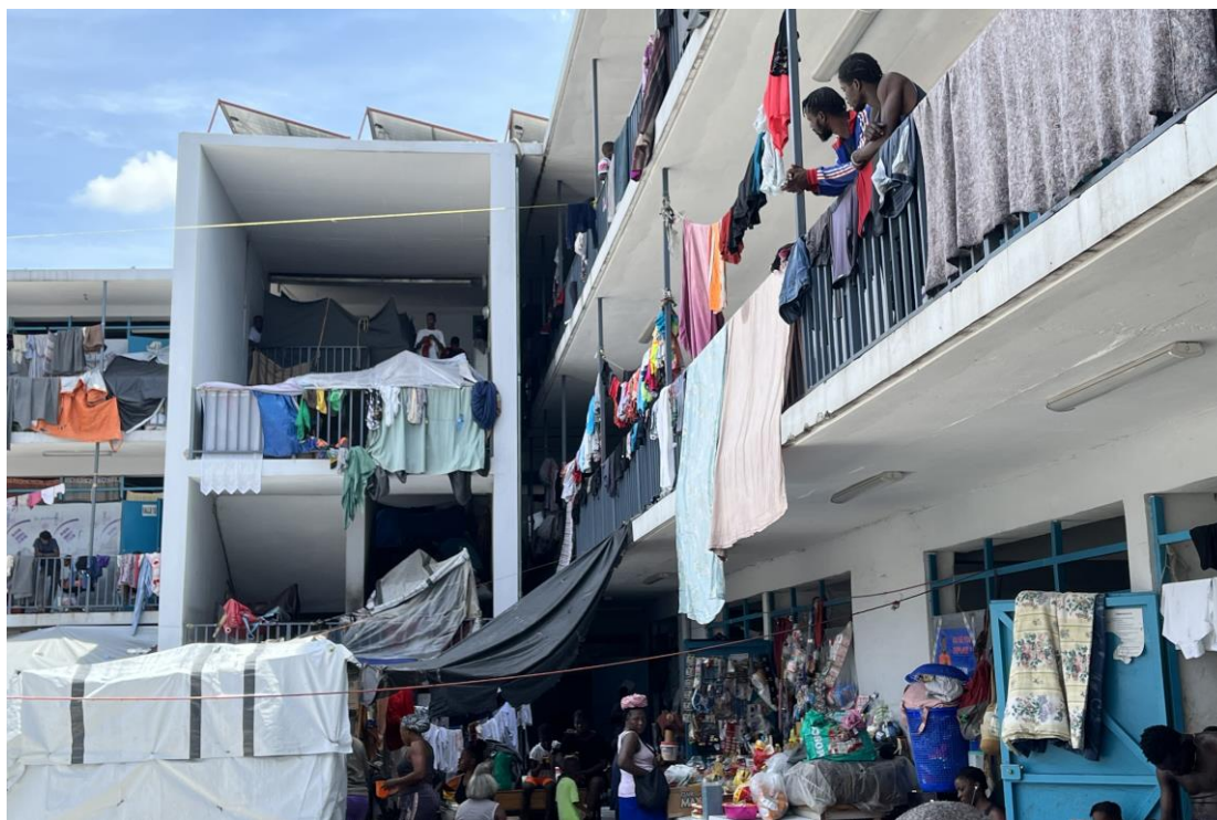
Chèchè Amnisti Entènasyon yo te obsève mank entimite ak kondisyon sipopilasyon an nan de (2) sit depasman yo te vizite an Septanm 2024. Chanm ki ouvri byen laj ak espas pou benyen yo ki pa kouvri, kote travay imanitè yo te di ke se yon bagay ki komen nan lòt kan yo tou, sa ki rann tifi yo ekspoze.