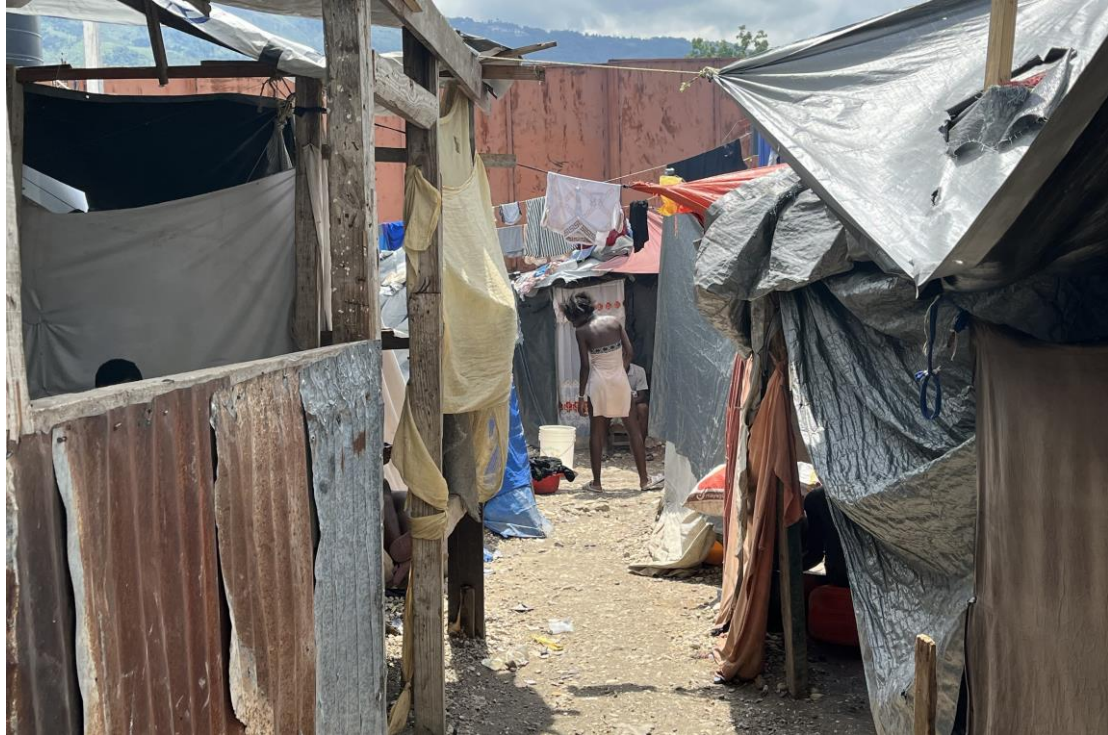
Deplasman an mas la te istorikman kite fanm ak tifi yo ann Ayiti nan ogmantasyon risk vyolans seksyèl. Dapre Nasyonziini an, vag deplasman repete yo an 2024 te lakòz yon nivo vyolans "san parèy".

CRC mande tou pou eta yo pwoteje timoun yo kont eksplwatasyon ak abi seksyèl, ki gen ladan yo pwostitasyon, menm jan tou kont tòti ak lòt tretman kriyèl, mechan, oswa degradan, ki gen ladan yo zak kadejak ak vyolans seksyèl. 166 Anplis de sa, selon Pwotokòl Opsyonèl nan Konvansyon sou Dwa Timoun nan vant timoun yo, pwostitasyon timoun ak pònografi timoun dwe entèdi ak anpeche eksplwatasyon timoun yo nan fè sèks komèsyal, tankou pou pran tout mezi posib pou sipòte sivivan yo ak rekiperasyon fizik yo ak sikolojik yo. 167 Enstriman rejyonal yo egzije tou pou eta yo entèdi vyolans seksyèl. 168