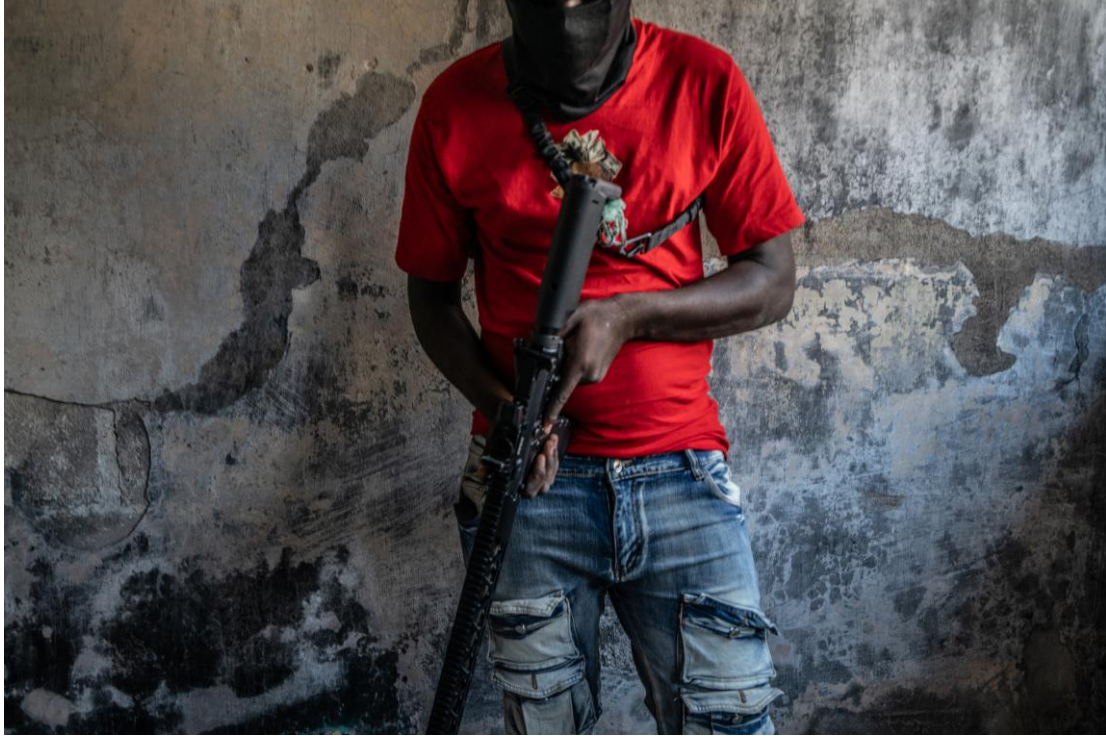
Manm gang yo, tankou sa yo te pran foto li nan kapital Pòtoprens lan 22 Fevriye 2024, souvan mete mask an piblik. Nan pifò ka Amnisti Entènasyonal yo te dokimante, manm gang yo te mete mask pandan y ap vyole tifi yo, yon pwoblèm ke plizyè tifi te site kòm youn nan rezon ki te anpeche yo rapòte atak yo paske yo pa t kapab idantifye agresè espesifik yo.

Nan mwa Septanm 2024, otorite Ayisyen yo ak Nasyonzini te sijen yon pwotokòl ki vize pou kreye chanm jidisyè espesyalize pou pouswiv "kriminèl an mas, ki gen ladan vyolans seksyèl ak krim finansye ". 297 Otorite Ayisyen yo dwe an ijans bay priyorite operasyon pwotokòl la epi asire ke òganism jidisyè sa yo gen pèsònèl pwofesyonèl ki resevwa fòmasyon pwofesyonèl espesyal pou asiste viktim krim sa yo ak pou yo swiv pwosedi ki santrè sou viktim yo ak enfòmè sou twomatis. Kòm yon kad nan efò yo pou asire pwosesis jidisyè efikas ak swen pou sivivan, otorite yo dwe travay kole kole ak òganizasyon sosyete sivil nasyonal ak entènasyonal ki prezan nan domèn nan e ki te nan premye liy pou ede viktim yo ak fanmi yo.