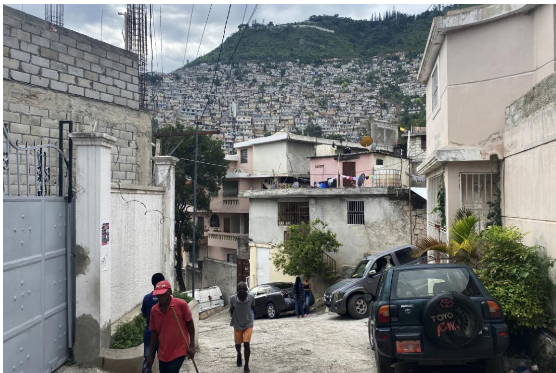
An 2024, gang ame yo te entansifye atak yo nan zòn metwopolitèn Pòtoprens ak anviwon li yo, nan pran kontwòl divès zòn adisyonèl epi ranfòse anpriz yo sou kominote yo.