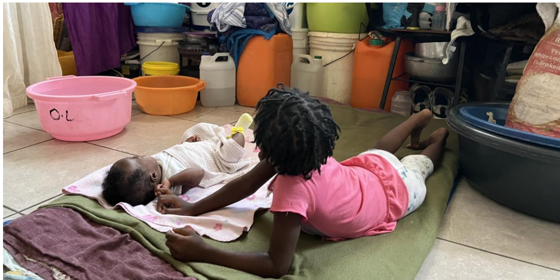
Selon Nasyonzini, Ayiti ap fè fas ak youn nan kriz grangou ki pi grav nan mond lan, avèk 5,4 milyon moun k ap viv nan yon grangou egi. Plizyè timoun nan risk malnitrisyon egi epi lanmò ki gen rapò ak grangou konn menm rive trape yo.

Gouvènman Ayiti a oblije respekte, pwoteje ak satisfè dwa moun ki dekri nan trete sa yo. Avèk sipò nan men patnè entènasyonan yo, li ta dwe pran mezi konkrè an ijans pou pwoteje timoun yo kont menas kontinyèl rezonab ki te poze pa gang yo. Abi gang yo komèt epi ki dekri nan rapò sa vyole lwa Ayisyen yo. Anplis de sa, gen règleman entènasyonan ak estanda ki enpoze restriksyon dirèk sou kondwit gang ame yo, ki gen ladan yo Konvansyon sou Pi Move Fòm Travay Timoun ak Pwotokòl Palermo sou trafik moun. 55