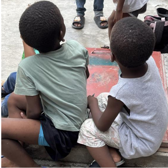
Gang yo eksplwate timoun yo nan plizyè tach tankou kolekte enfòmasyon. Avèk divès milye moun ki deplase akòz vyolans lan, anpil timoun nan risk pou gang yo rekrite yo ak itilize yo.

Amnisti Entènasyonal te fè entèvyou avèk twa tifi plizyè gang te itilize pou fè travay domestik, tankou fè manje ak netwayaj, tankou fè livrezon. 74 Manm gang yo "mande mwen achte bagay pou mennaj yo ak pou netwaye kay la pou yo ... yo jis ban mwen 250 goud [anviwon 2 USD] pou manje", te di yon tifi 17-ane ki ap viv nan yon zòn ki kontwole pa gang ti Bwa. 75 Yon tifi 17-ane ki ap viv nan yon zòn kontwole pa 5 Segonn te di: "Mwen te fè manje anpil fwa pou yo ... pafwa pou yon gwoup ant 10 ak 15 moun ... dènye fwa mwen te fè sa te mwa pase a ... Yo voye lajan pou mwen; mwen prepare manje epi rele yo pou vin pran li." 76