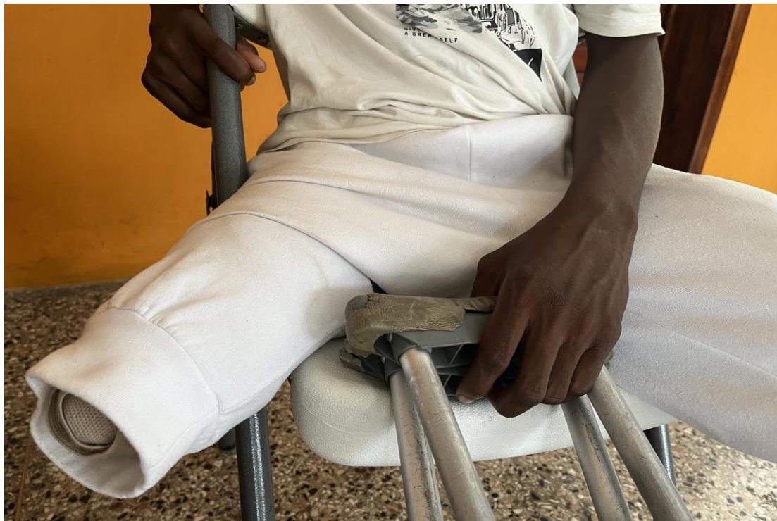
Yon ti gason 16-ane, ki gen janm li koupe an Janvyè 2024 apre yon manm gang te tire sou li, yon ONG te ba li beki, men nan moman entèvyou avèk Amnisti Entènasyonal an Septanm, beki yo te deja fè plizyè moso, epi li pa t kapab jwenn sa ki nouvo.

Manman tifi ki gen 12 ane avèk mobilite limite ki te kouri kite Kafou-Fèy san chèn woulant li a nan mwa Out 2023 te di ke li te vle achte yon lòt pou pitit fi li a amelyore lavi tifi a nan depasman, men li pat gen lajan an. Lòt timoun ki andikape yo te kesyone ki bezwen aparèy asistans pa t janm gen youn avan sa. Aparèy asistans ak pwotèj yo esansyèl pou pèmèt moun ki gen andikap mennen yon vi aktif, ak endepandan.