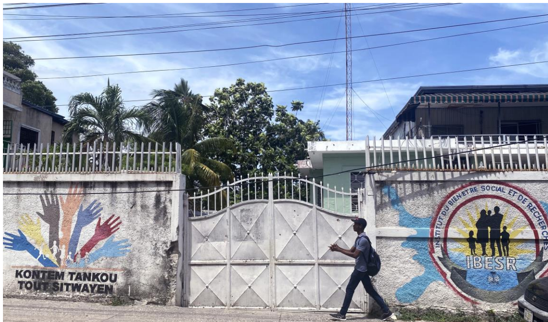
Amnisti Entènasyonnal te vizite Sant pou Revedikasyon Minè an Konfli avèk Lalwa yo, oubyen CERMICOL (ki kapab remake nan foto ki nan tèt la), epi te dokimante sou sipopilasyon prizon yo ak lòt pratik detansyon ilegal k ap fèt la. Chèchè yo te pale avèk responsab ki la yo ak nan ajans pwoteksyon timoun, IBESR (ki kapab remake nan foto anba a), konsènan pwoblèm ki trennen reentegrasyon an.

“MWEN SE YON TIMOUN, POUKISA SA TE RIVE MWEN?” ATAK GANG YO SOU ANFANS TIMOUN YO AN AYITI