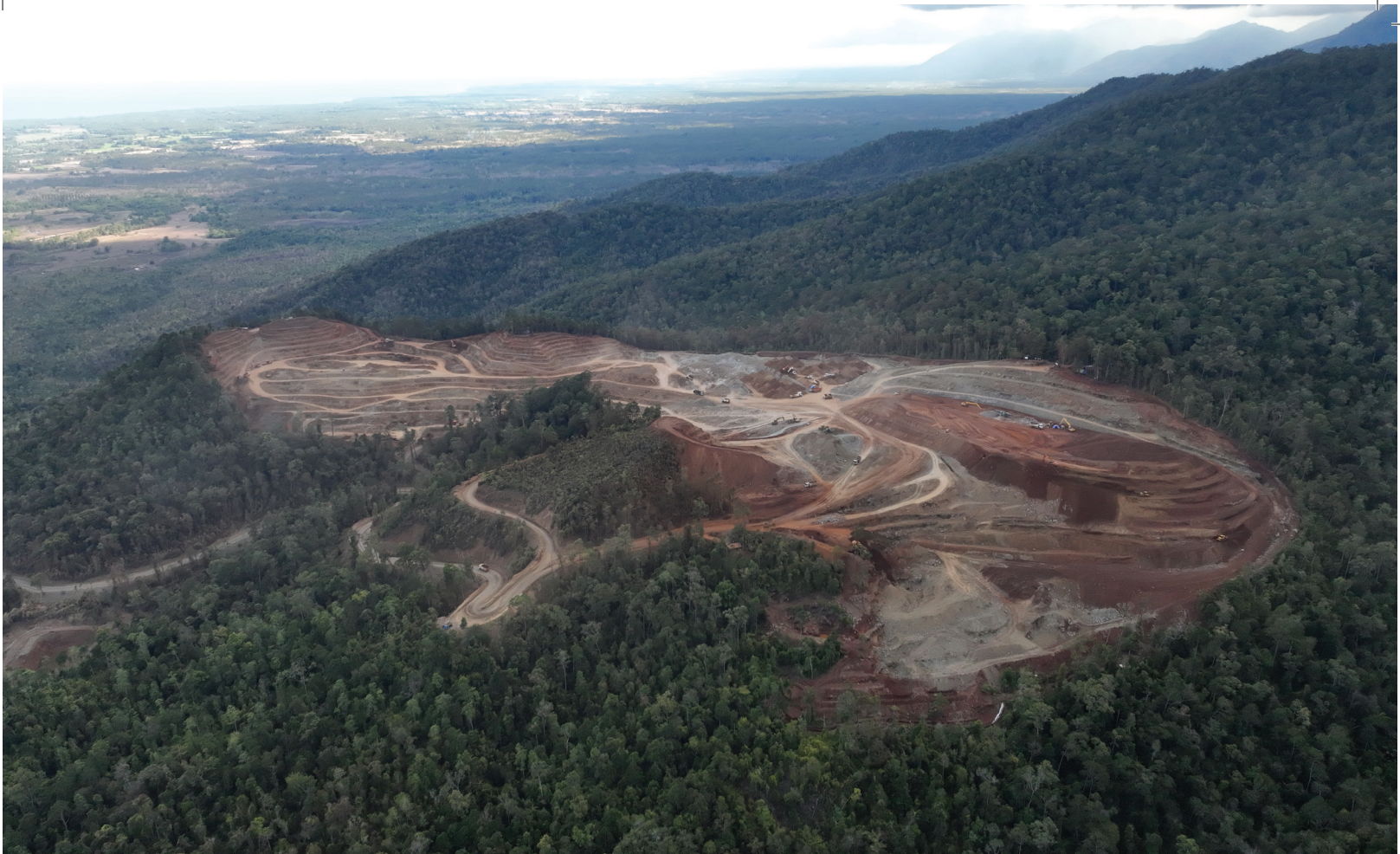
Isang open pit nickel mine sa Palawan, Pilipinas

Dahil sa tindi ng mga panganib na dulot ng mga nickel mining operation, dapat ihinto ng mga kumpanyang kasama sa ulat na ito ang lahat ng operasyon hanggang sa mapatunayan nilang ligtas ang kanilang mga operasyon at hindi nakapipinsala sa mga karapatang pantao at sa kapaligiran.