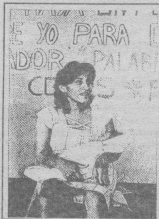
Мати з малим дитям, що народилося у в'язниці в Ель-Сальвадорі. Ніколи не слід ув'язнювати матір з дитиною, мучити їх та знуцатися з них.

Мільйони жінок опиняються поміж урядовими й опозиційними збройними формуваннями, кожне з яких, переслідуючи свою мету, вдається до насильства.