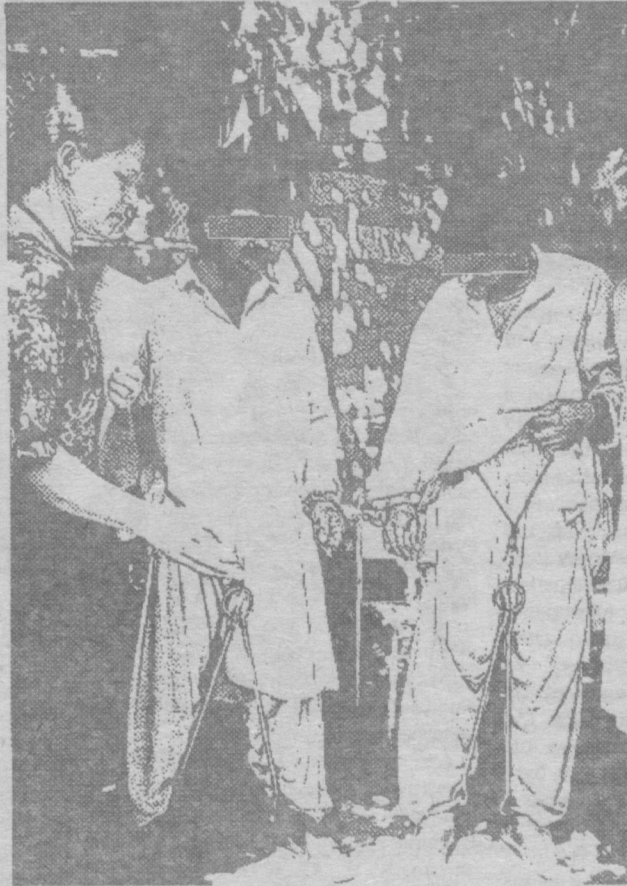
Дослідниця з МА бере інтерв'ю у двох чоловіків, які мають на ногах кайдани

Офіцер не знав, що відповісти, і відійшов. Тим часом почався допит