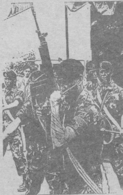
Військовослужбовець Колумбійської армії.

Втім, невдовзі уряд відкинув ті положення проекту закону, які передбачали кримінальну відповідальність за "зникнення" людей, а також виведення розслідувань і суду з-під військової правової системи і переведення їх під юрисдикцію цивільного права. Неспроможність уряду вивести кримінальні справи щодо порушень прав людини з-під