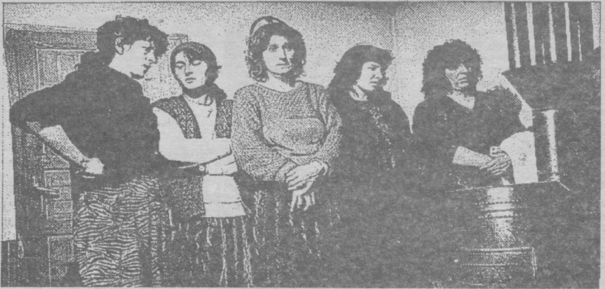
Жінки з одного села в провінції Косово прийшли морально підтримати албанця, якого побила сербська поліція. Етнічні меншини і безправні соціальні групи продовжують бути об'єктами насильства з боку офіційних інстанцій у всьому світі.

армії. Сексуальні злочини супроти жінок - це постійні супутники воєнного лихоліття, під час якого мусульман і хорватів постійно залякують і знуцаються над ними. Все це змушує їх рятуватися втечею або ж їх просто виганяють з рідних домівок.