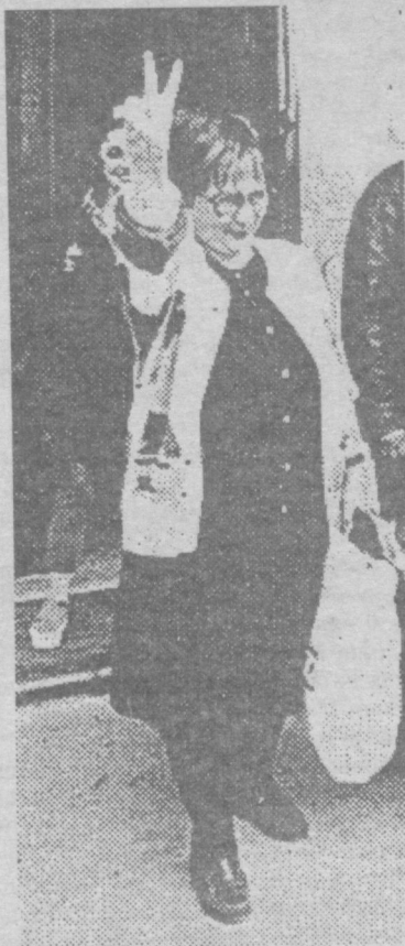
Айзе Нур Зараколу, турецька правозахисниця й видавець, яку влада постійно переслідуює.

В деяких країнах жінок переслідують за їхню статеву орієнтацію. Лесбійки