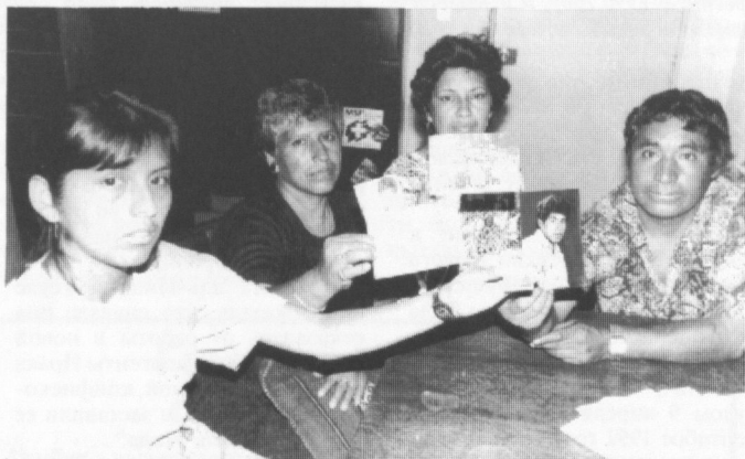
Семья профессора и нескольких студентов университета Кантута, исчезнувших и якобы убитых сторонниками перуанских военных