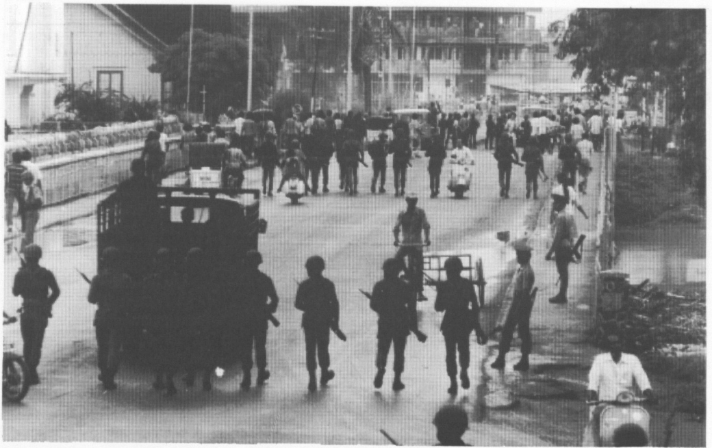
Индонезийские войска патрулируют Банда Ачех

Все получили обвинение по суровому Закону по борьбе с подрывной деятельностью - декретом президента от 1963 года, который используется до сих пор, несмотря на то, что индонезийские юристы и Специальный докладчик ООН по пыткам настойчиво рекомендуют его отменить.