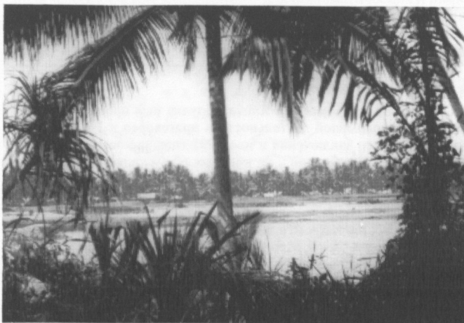
Деревья на побережье в районе Ачех Бесар, пров. Ачех