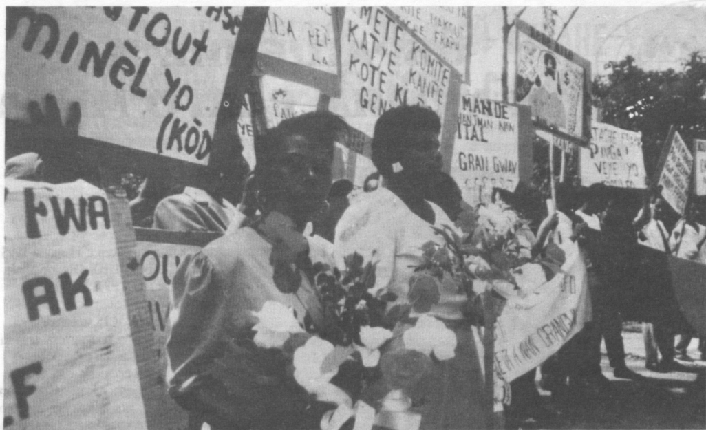
Демонстранты в Гранд-Гуаве в октябре 1994 года, требующие принять меры против военнослужащих и членов полувоенных формирований, ответственных за нарушения прав человека в период военной диктатуры. Принесенные женщинами цветы были возложены к могилам жителей, ставших жертвами этих нарушений.