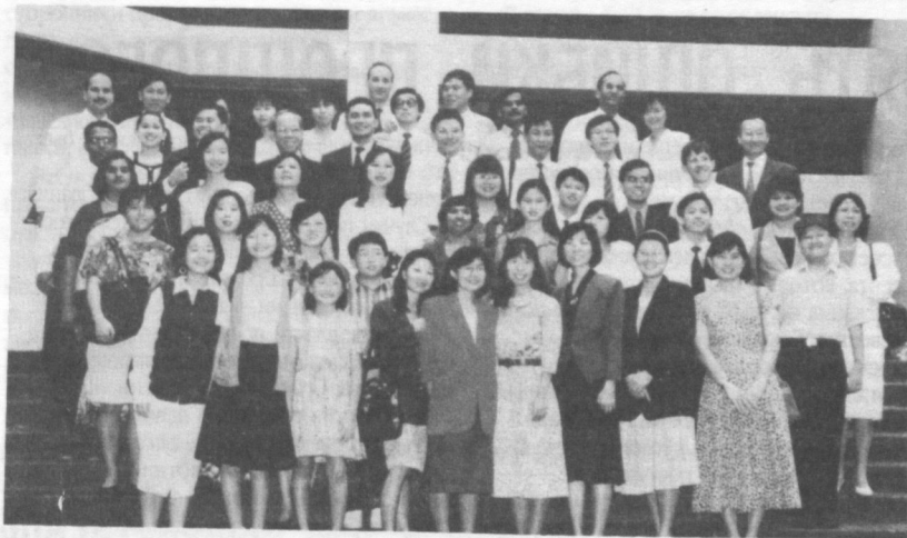
Группа представителей «Свидетелей Иеговы» перед зданием суда незадолго до их конференции перед процессом в марте 1995 года.

Шестьдесят четыре члена секты «Свидетели Иеговы» были осуждены за принадлежность к незаконной секте, несмотря на гарантии свободы вероисповедания в Конституции Сингапура. Мужчинам и женщинам в ходе разбирательств в ноябре 1995 — январе 1996 года были назначены штрафы, которые многие из них отказались платить по убеждению, за что были заключены в тюрьму на срок до четырех недель. Некоторым из них придется еще раз предстать перед судом в 1996 году за хранение запрещенной религиозной литературы.