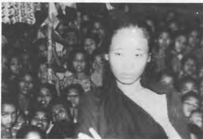
Бангладеш: эта женщина, изнасилованная солдатами на своей родине, бежала в лагерь для беженцев в Индии