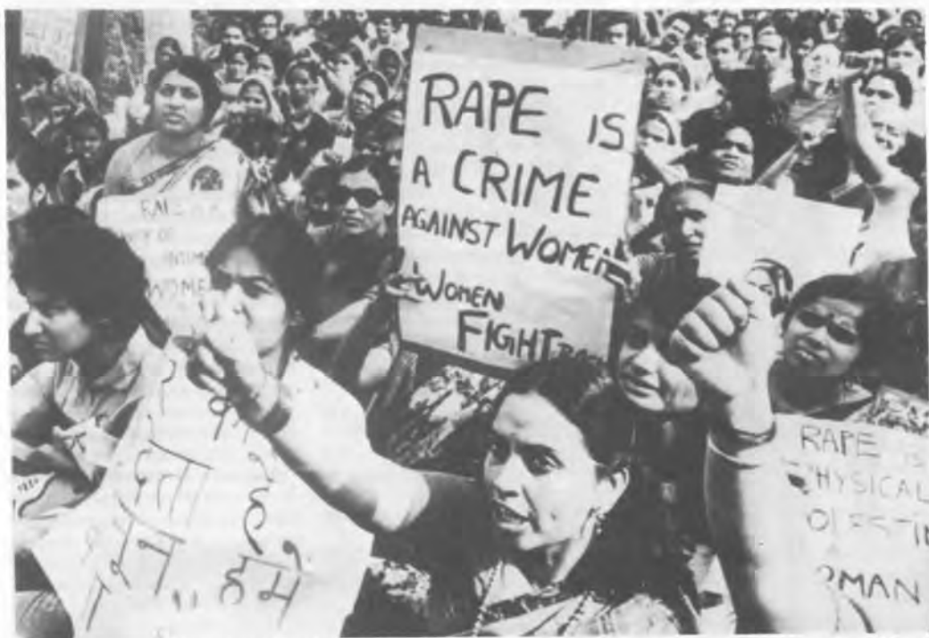
Индийские женщины вышли на улицы столицы Нью-Дели в знак протеста против изнасилования и надругательства

Самое необычное в этом инциденте — то, что о нем публично сообщалось. Во всех странах мира правительственные агенты используют изнасилование или надругательство с целью принуждения, унижения, наказания или запугивания женщин. Когда полицейский или солдат изнасиловал женщину, находящуюся под его стражей, изнасилование уже более не является актом частного насилия, а становится актом пытки или жестокого обращения, за который несет ответственность государство. Международное право обязывает правительства к защите всех мужчин, женщин и детей от пыток и жестокого обращения, а также требует проведения быстрого и тщательного расследо-