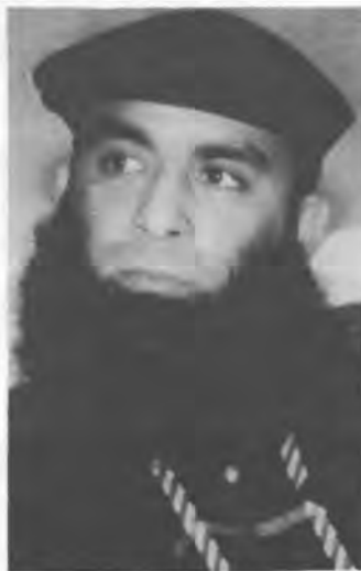
Мухаммад аль-Фаси

мент Кундинамарка. У входа в дом также были обнаружены тела двух других мужчин, личность которых еще не установлена. По заявлению командующего 13-й бригадой колумбийской армии, убитые являлись членами партизанских групп и погибли во время вооруженного столкновения с солдатами. Эта версия событий противоречила показаниям очевидцев, а также заключениям полиции и журналистов, вскоре прибывших на место действия, которые, по сообщениям, не обнаружили каких-либо доказательств того, что находившиеся в доме люди стреляли в нападающих. Единственный взрослый, оставшийся в живых после нападе-