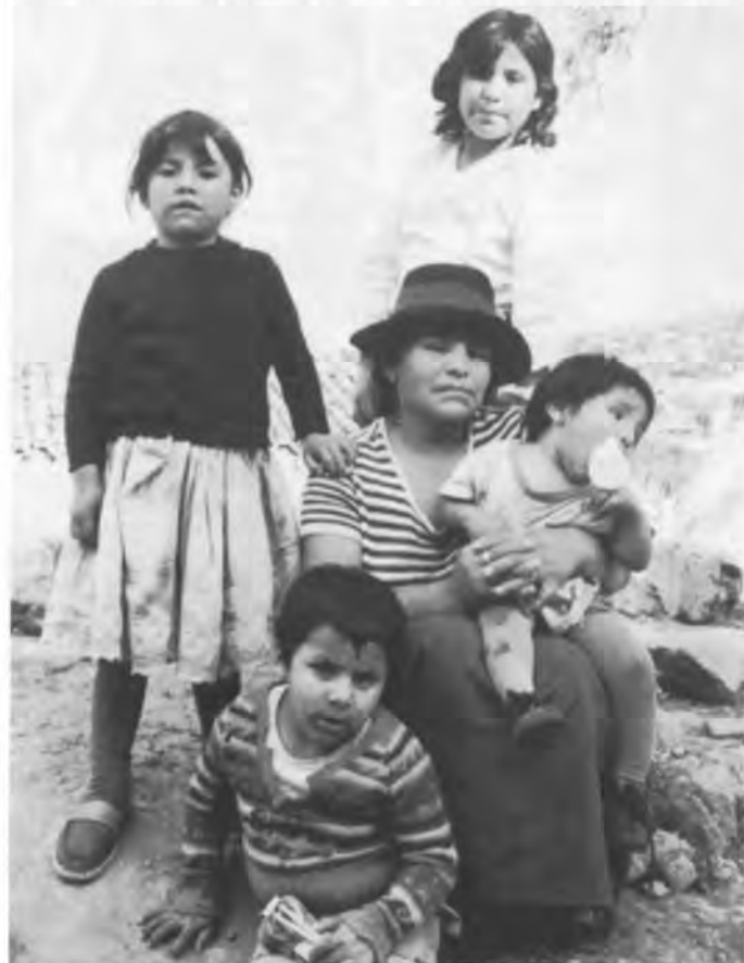
Перу: по сообщениям, ребенок, сидящий на коленях матери, был зачат, когда она была изнасилована правительственными солдатами в военной зоне Аякучо