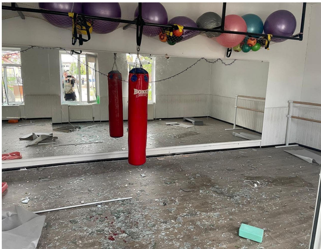
The aftermath of the attack on the sports club in Derhachi, Kharkiv oblast, 2 May 2024.