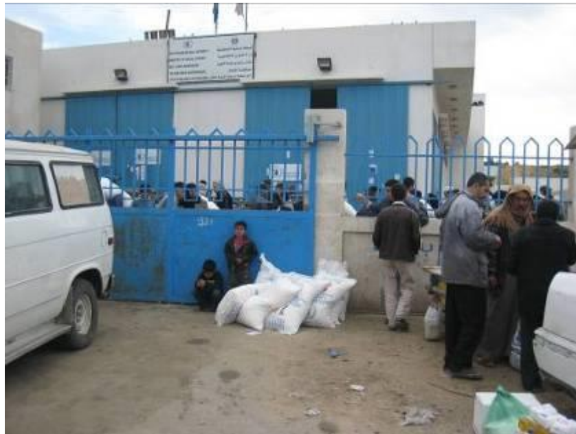
מחכים למשלוחי מזון לאחר תום מבצע "עופרת יצוקה"

במשך למעלה משנה (מאז ה-18 בינואר 2008) אסרה ישראל על ייצוא סחורות מכל סוג שהוא מרצועת עזה. הגבלות קיצוניות כאלה הביאו לקריסת הכלכלה, ויצרו מצב שבו 80% מהאוכלוסייה תלויים במשלוחי סיוע של מזון. למרות זאת, המשיכה ישראל והידקה בהדרגה את עניבת החנק מסביב לצווארה של הרצועה וצמצמה עד מאוד גם את הכנסת הסיוע הומניטארי, כולל מזון. בחודש נובמבר 2008 נכנסו לרצועת עזה במוצע 23 משאיות אספקה ביום, פחות מ-5% מן הממוצע היומי בחודש מאי 2007. 82