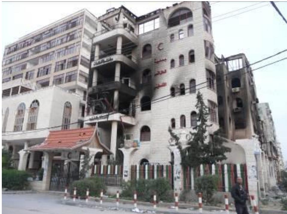
בית החולים אל-קודס

שתי הקומות העליונות של המבנה המרכזי של בית החולים וכן בניין המנהלה, הסמוך לבית החולים ומחובר אליו בגשר, נהרסו כמעט לחלוטין מאש שהתלקחה בגלל הזרחן הלבן. בבית המרקחת של בית החולים, בקומה השנייה, פגע לפחות פגז טנק אחד. ניסיונותיהם של רופאים ושל חברים אחרים בצוות בית החולים, כולל רופאים זרים שביקרו במקום, לכבות את האש באמצעות דליי מים ומטפים עלו בתוהו. מכבי האש וכלי רכב של ההגנה האזרחית לא יכלו להגיע לבית החולים במשך יותר משעה.