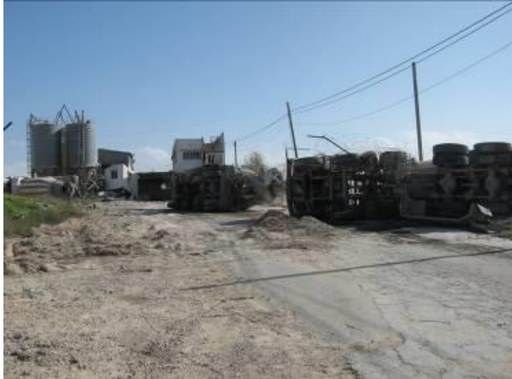
כלי רכב שנפגעו במפעל לבטון שבשכונת א-זייתון

לאחר שהכוחות הישראליים עזבו ב-18 בינואר נראה האזור כאילו נחרב ברעידת אדמה, אלא שהוא היה זרוע במוקשים ישראליים נגד טנקים (שרבים מהם לא התפוצצו ונאספו על-ידי המשטרה) ובתרמילים של פגזי טנק ישראליים בקוטר 120 מ"מ. בכל מקום ניתן היה להבחין בעקבות הייחודיות לטנקים ולמשוריינים. ב-10 בינואר הותקפה גם טחנת הקמח באדר בצפון-מערב רצועת עזה , שנוסדה בשנת 1920, וחלק גדול מן המכוונות שבה ניזוקו ללא תקנה. טחנת הקמח פעלה מדי יום עד שהותקפה, ובעליה עומדים בתוקף על כך שהאתר לא שימש לירי רקטות או לאחסון נשק. הצבא הישראלי מצדו לא סיפק כל ראיות לגרסה ההפוכה.