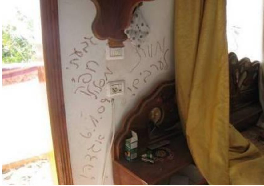
”מוות לערבים”: כתובת החתומה בידי חטיבת גבעתי של צה”ל בבית משפחת א-סמוני

בסוף חודש ינואר 2009, ימים ספורים לאחר תום מבצע ”עופרת יצוקה”, התחייבה ממשלת ישראל לספק סיוע ותמיכה לקציני צבא שיועמדו לדין בחו”ל על פשעי מלחמה שביצעו כביכול ברצועת עזה. ראש הממשלה דאז, אהוד אולמרט, טען כי ”המפקדים והחיילים שנשלחו לעזה צריכים לדעת כי הם בטוחים מפני טריבונאלים שונים”. 19