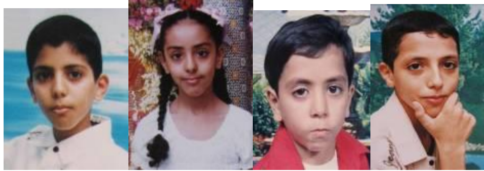
ילדי משפחת עליווה, שנהרגו ב-5 בינואר יחד עם אמם

נציגי ארגון אמנסטי אינטרנשיונל מצאו בבית שיירים של פגז טנק בקוטר 120 מ"מ. נתיב הירי מחלון חדר השינה שדרכו נכנס פגז הטנק הוביל לנקודה במרחק של ק"מ אחד מצפון-מזרח לבית, באזור גיבל רייס, שבו הוצבו הטנקים הישראליים בעת התקיפה. כשביקרו במקום נציגי אמנסטי אינטרנשיונל עדיין ניתן היה לראות את עקבות הטנקים בחול. 34