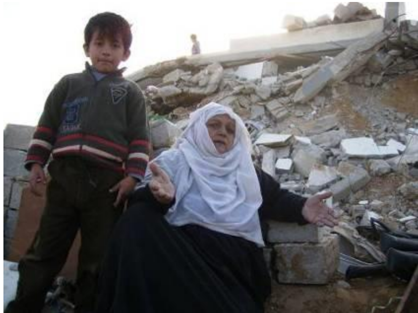
מחוסרי דיור לאחר ההרס

במבצע "עופרת יצוקה" נהרסו למעלה מ-3,000 בתי מגורים ומאות נכסים אחרים, כולל מפעלים, בתי מלאכה, חוות חקלאיות ומטעים, כמו-גם בנייני ממשל, תחנות משטרה ובתי כלא, ולמעלה מ-20,000 ניוזקו. 88 ההסבר שסיפקו לכך הרשויות הישראליות היה "צורך צבאי/ביטחוני".