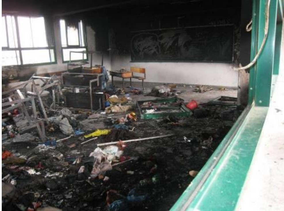
בית הספר של אונר"א בבית לאהיה, שבו נהרגו ב-17 בינואר שני ילדים בהתקפת ארטילריה וזרחן לבן של ישראל

יומיים לאחר ההתקפה ביקרו בבית הספר נציגי אמנסטי אינטרנשיונל ומצאו גושי זרחן לבן שעדיין בערה בהם אש חנוקה, וכן שיירים של פגזי ארטילריה בקוטר 155 מ"מ שהכילו זרחן לבן. הכיתה שבה נהרגו הילדים נשרפה כליל. ילדים שמצאו מחסה בבית הספר אמרו לנציגי אמנסטי אינטרנשיונל כי הם ישנו, וכשהתעוררו "כדורי אש ירדו על בית הספר כמו גשם וכולנו היינו מפוחדים וצעקנו". שיירים נוספים של פגזי ארטילריה המכילים זרחן לבן נמצאו בסמוך. אין זה ברור כמה פגזי ארטילריה המכילים זרחן לבן נורו מעל בית הספר וסביבתו, אך בתמונות ובקטעי וידאו שצולמו במשירי טלפון ניידים נראים השמיים מלאים בכדורי אש שהומטרו על בית הספר. 44