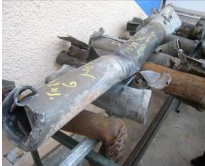
רקטות פלסטיניות שנאספו בתחנת המשטרה באשקלון

היו שטענו כי הירי מכוון אל בסיסים או מוצבים של הצבא הישראלי הממוקמים בתוך יישובים בדרום ישראל ובסביבתם, וכי יישובים הסמוכים לרצועת עזה הם בעיקר בסיסים צבאיים. אף שייתכן כי חלק מהרקטות יפגעו במטרות צבאיות, תוצאה שהארגונים יעריכו כבעלת ערך אסטרטגי רב יותר, טיעון זה בטל הן בשל טבען חסר ההבחנה בבירור של ההתקפות והן משום שנפגעי ההתקפות היו תמיד אזרחים. דוברים אחרים טענו כי הרקטות קטלניות רק לעתים נדירות וכי מטרתן העיקרית היא "לשבש" את החיים בישראל כל זמן שישראל אינה מאפשרת לפלסטינים לחיות חיים נורמאליים.