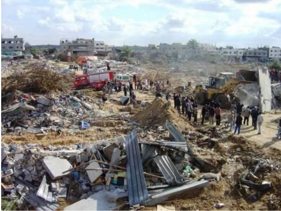
גופותיהם של בני משפחת א-סמוני מחולצות ב-18 בינואר 2009