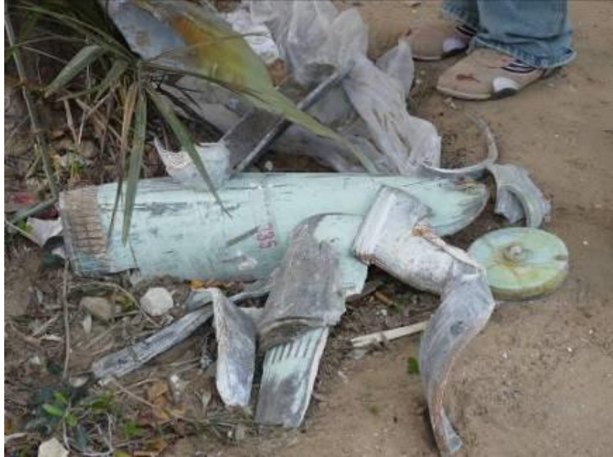
שיירים של פגז ארטילריה תוצרת ארה"ב בקוטר 155 מ"מ הנושא זרחן לבן, שנורה בידי כוחות ישראליים לתוך רצועת עזה

באותו יום צוטט ראש הממשלה דאז אהוד אולמרט כאומר למזכ"ל האו"ם: "איני יודע אם ידוע לך אך החמאס תקפו מתוך מתחם אונר"א". בנוסף לכך, דובר מטעם הצבא הישראלי טען כי "מחבלים ירו רקטות נגד טנקים מתוך המתחם של אונר"א לעבר כוחות צה"ל שהיו פרוסים בקרבת מקום. בתגובה השיב צה"ל אש. 49 אונר"א דחתה בתוקף את ההאשמות הללו, שמעולם לא הוכחו, ובהמשך הרשויות הישראליות חזרו בהן מהן.