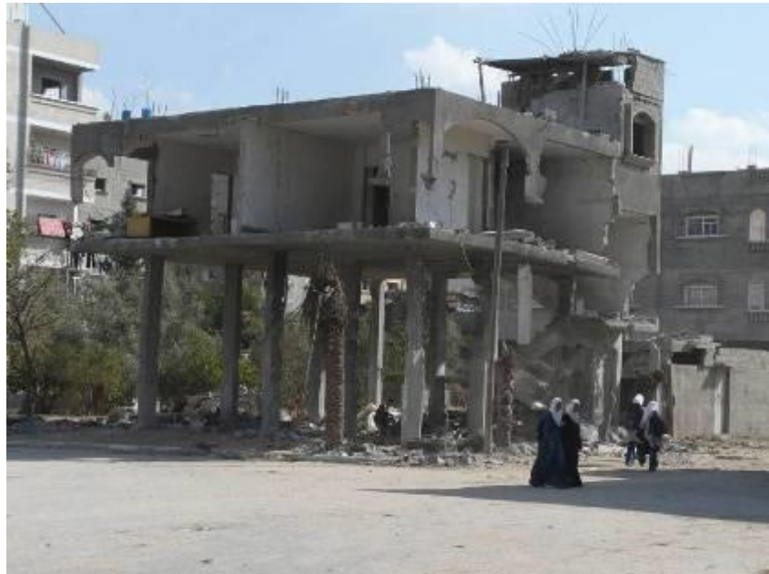
בית משפחת סלחה, שהופצץ ב-9 בינואר 2009

החוצה ראשונות כדי להינצל, בעוד אמם, אחיהן ודודה אחת הצליחו להגיע רק לתחתית המדרגות כאשר הבית הופצץ.