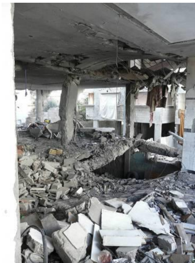
בית משפחת אבו עיישה שהופצץ ב-5 בינואר 2009

במהלך מבצע "עופרת יצוקה" התקשר הצבא הישראלי לאנשים מסוימים והורה להם לעזוב את בתיהם כיוון שיופצצו בתוך כמה דקות. 26 ככל הידוע לארגון אמנסטי אינטרנשיונל, חוץ מאשר במקרה אחד, 27 כל האנשים שקיבלו אזהרות מסוג זה צייתו להוראות והתפנו מבתיהם לפני שהופצצו. עם זאת, בני שש משפחות לפחות, שקרובי משפחתם נהרגו בהפצצת בתיהם, אמרו לארגון אמנסטי אינטרנשיונל כי לא קיבלו שום אזהרה מוקדמת. בכל המקרים הללו היו הבתים ממוקמים באזורים בנויים ותושביהם חשבו שהם בטוחים יותר שם מאשר במקומות אחרים ברצועה. באף אחד מן המקרים הללו אין ראיות לכך שניתן היה לראות בבתים או בתושביהם מטרות צבאיות.