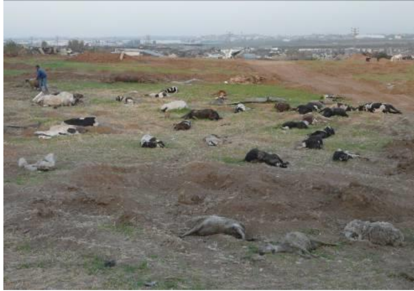
חיות מתות בסמוד לחווה שנהרסה בצפון רצועת עזה

חקלאים בצפון הרצועה ובמזרחה ראו כיצד מטעיהם מצטמקים בהדרגה, עם הרחבת האזורים שהצבא הישראלי אוסר את הכניסה אליהם לאורך הגדר המפרידה בין ישראל לעזה. ב-25 במאי 2009 פיזר מטוס ישראלי קופסאות המכילות אלפי כרוזים מעל שמי צפון רצועת עזה ומזרחה. בכרוזים הוזהרו תושבי עזה להתרחק מן האזור המשתרע במרחק של עד 300 מטר מן הגבול, וצוין כי מי שעובר על איסור זה מסתכן בכך שיירו עליו. 105 על הכרוזים מופיעה מפה של רצועת עזה, שבה מסומן פס לאורך הגבול. אולם, אין במפות אלה קו מבחין בתוך רצועת עזה המציין במדויק היכן עוברים גבולות האזור האסור לכניסה.