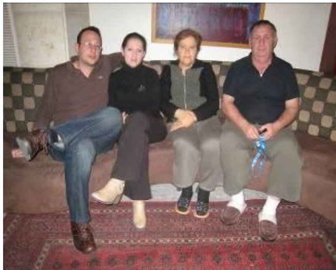
משפחת ברדיצ'ב בדירור זמני לאחר שרקטה פלסטינית פגעה בדירתה

בני הזוג אמרו כי רצו לעבור למרכז הארץ בעקבות ההתקפה, אבל אסתר חששה לאבד את משרתה: "אף פעם לא חשבנו שנהיה במצב כזה, שלא יהיה לנו מקום להניח בו את הראש שלנו... עברנו לישראל ממולדובה בשנת 1992. עבדנו קשה כדי לבנות את החיים שלנו בבית הזה. עכשיו איבדנו הכול. לפחות בשנת 1992 היו לנו הבגדים שלנו".