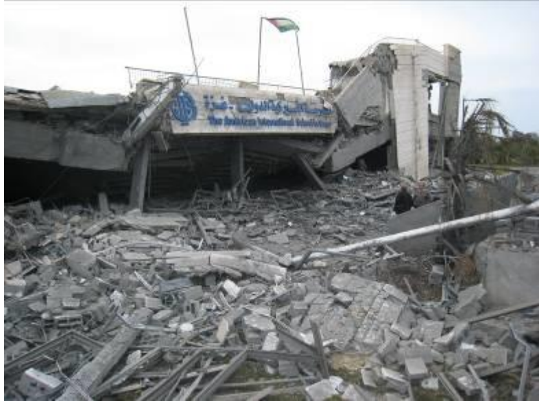
בית הספר האמריקני הבינלאומי בעזה

רס"ן אביטל לייבוביץ, דוברת מטעם הצבא הישראלי, הצדיקה התקפות אלה בטענה כי "כל מה שקשור בחמאס הוא מטרה צבאית". 97 קצין מודיעין בכיר אמר בראיון לעיתון הניו-יורק טיימס כי הצבא תקף "את שתי הפנים של חמאס: ההתנגדות, או הזרוע הצבאית, והדעווה, או הזרוע החברתית", וטען כי חמאס הוא מקשה אחת וכי בעת מלחמה, כלי השליטה החברתיים והפוליטיים שלו הם מטרות לגיטימיות ממש כמו מצבורי רקטות". 98