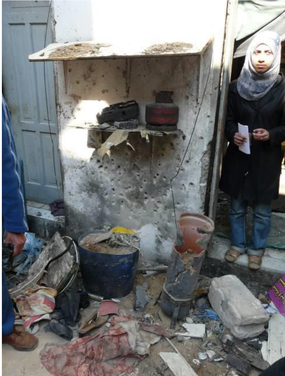
פתחייה מוסא בחצר ביתה, שבה נהרגו בני משפחתה

למחרת, ה-15 בינואר 2009, בשעה 9:00 בבוקר, נהרגו חמישה בני משפחת ארמילאת, שלושה ילדים, אמם וסבתם, מפגיעת טיל ששוגר ממל"ט בעת שישבו מחוץ לביתם בכפר בדואי קטן בפאתי בית לאהיה, שבצפון רצועת עזה. ההרוגים היו אמל ארמילאת, בת 29, חמותה בת ה-60 ושלושת ילדיה, סאברין, בת 13, בראא, בת 13 חודשים, והתינוקת אריג', בת חודשיים וחצי. אבי הילדים, עטא חסן חוסיין ארמילאת, אמר לארגון אמנסטי אינטרנשיונל: "התארחנו אצל קרובים שלנו בשיכון שיח' זאיד שנמצא מול הבית שלנו, מעבר לכביש, כי שם בניין הדירות הוא גדול וחזק והרגשנו בו בטוחים יותר מאשר בבית [בית המשפחה הוא מבנה רעוע בלב פרדס]. ב-15 בינואר בבוקר הלכתי בחזרה הביתה כדי להביא לתינוקת תחליף חלב אם, ואימא שלי ואשתי הלכו אחריי עם הילדים. כשהייתי בבית, הם התיישבו בפרדס ממש מחוץ לבית. שמעתי פיצוץ, יצאתי מהבית וראיתי מחזה של טבח. כולם נהרגו מיד. הגופות שלהם היו מפוזרות מסביב. איבדתי את כל המשפחה שלי, כל הילדים שלי, אשתי, אימא שלי. אין לי כלום". באתר ההתקפה מצאו נציגי אמנסטי אינטרנשיונל חורים המאפיינים את רסיסי המתכת הזעירים והקובייתיים, המתפזרים מתוך טילים המשוגרים על-פי רוב ממל"טים.