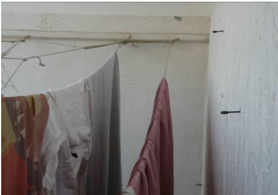
חצי פלאשט