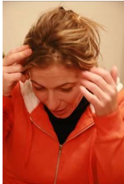
גאות ארגון מציגה את פצעי הרסיסים

נציגי אמנסטי אינטרנשיונל שוחחו עם כמה אזרחים ישראלים שסבלו מירי הרקטות הפלסטיני.