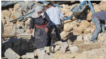
Khirbet Tana, peu de temps après la seconde démolition, en janvier 2010.

restrictions à la liberté de mouvement des Palestiniens entre la vallée du Jourdain et le reste de la Cisjordanie ont été renforcées depuis 2005 ; seuls les Palestiniens enregistrés comme résidents dans la vallée du Jourdain sont autorisés à y pénétrer à bord de véhicules privés. Les conditions de vie des Palestiniens de la vallée du Jourdain sont extrêmement dures et difficiles à supporter en raison de ces restrictions à la liberté de mouvement et de construction ainsi que des démolitions répétées dans cette zone.