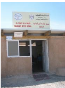
L'extérieur de l'école.