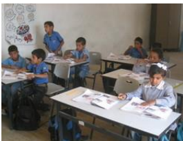
Des enfants de l'école d'al Khan al Ahmar, dans le camp des bédouins jalahins. Avril 2010.

Les autorités israéliennes émettent des ordres de démolition non seulement pour les maisons palestiniennes mais aussi pour les écoles, les dispensaires, les citernes, les pylônes électriques et les enclos pour les animaux dans les villages palestiniens.