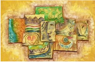
Tableau peint par Hussein al Ibrahemi, artiste et défenseur des droits humains irakien, exprimant son expérience de réfugié en Syrie.