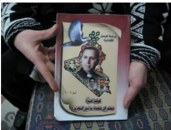
Photo de Ragheed Ghanni sur la couverture d'un livre. Ce prêtre a été tué en juin 2007 à Mossoul par des inconnus armés.

Des actes d'intimidation et de harcèlement commis par les autorités irakiennes contre la population kurde dans les « territoires contestés » ont également été signalés. Ainsi, en octobre 2008, les forces de sécurité irakiennes auraient fait une descente dans le village de Qaratepe et harcelé la population kurde qui y vit 10 .