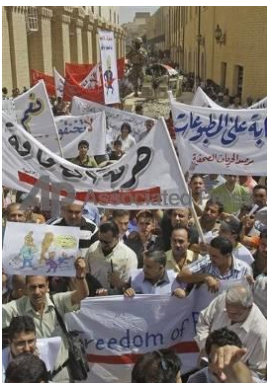
Manifestation pour la liberté de la presse à Bagdad (août 2009).

Malgré les risques et difficultés auxquelles ils continuent de faire face, les militants des droits des femmes ont obtenu quelques succès. Par exemple, un quart des sièges du parlement irakien est maintenant réservé aux femmes et, dans la région du Kurdistan des modifications apportées au Code pénal et au Code de statut personnel ont permis de renforcer les droits des femmes.