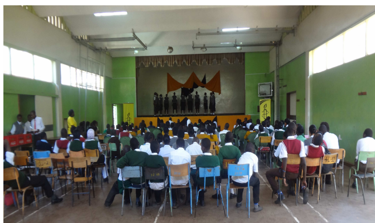
Des élèves chantent un chant en vers sur les droits humains lors de la visite d'échange d'écoles des bidonvilles à State House Girls High School, en octobre 2012.

Le forum était une opportunité unique pour des élèves vivant dans différentes communautés de se rencontrer et partager leurs connaissances, expériences et idées. Cela leur a permis d'aborder de manière positive, responsable et productive de problèmes de droits humains au sein de l'école et de la communauté.