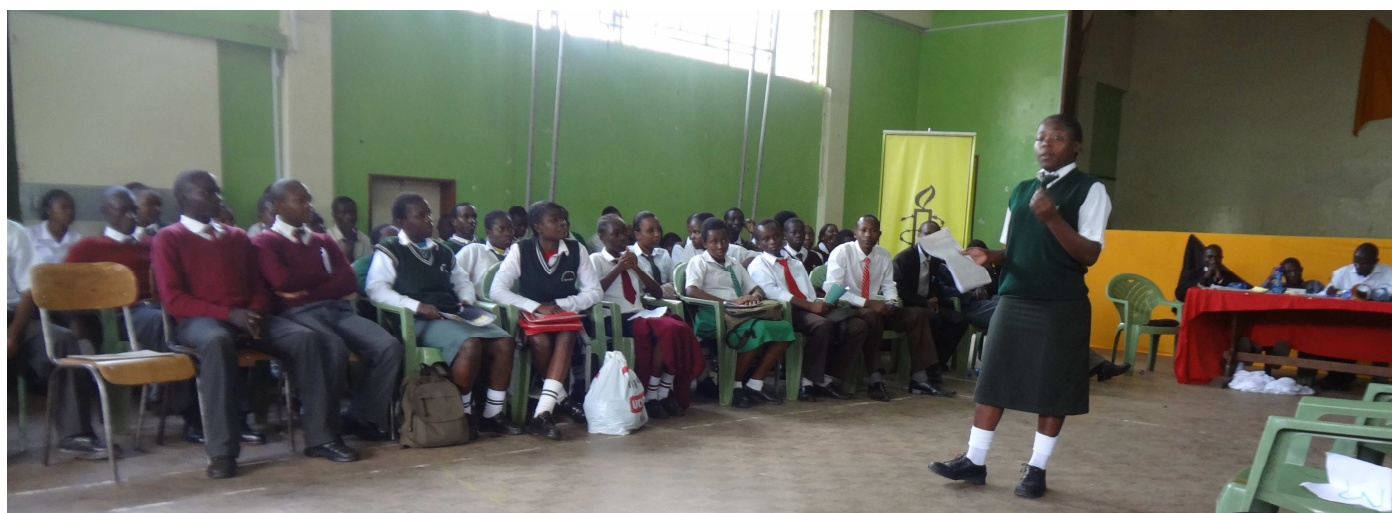
Des élèves ont participé à un débat sur les droits humains lors de la visite d'échange entre l'Ecole amie des droits humains, State House Girls High School, et des écoles situées dans des bidonvilles en octobre 2012.

Les membres des clubs de droits humains ont partagé des idées sur les manières de respecter la dignité humaine. Les idées incluait avoir des attitudes positives, renforcer les groupes de pairs, encourager le respect mutuel au sein de la société, et sensibiliser aux droits humains.