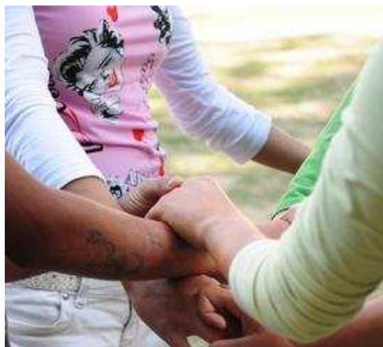
Des élèves de l'école Dr Ambedkar travaillant ensemble lors d'un atelier sur les droits humains, 2012.

L'École Dr. Ámbédkár est une école de seconde chance, offrant aux élèves des campements marginalisés des environs la possibilité de poursuivre leurs études secondaires. En effet, la plupart des élèves à Dr. Ámbédkár appartiennent à la communauté Rom, certains ont abandonné l'enseignement primaire, ou arrêté l'école à un jeune âge pour travailler.