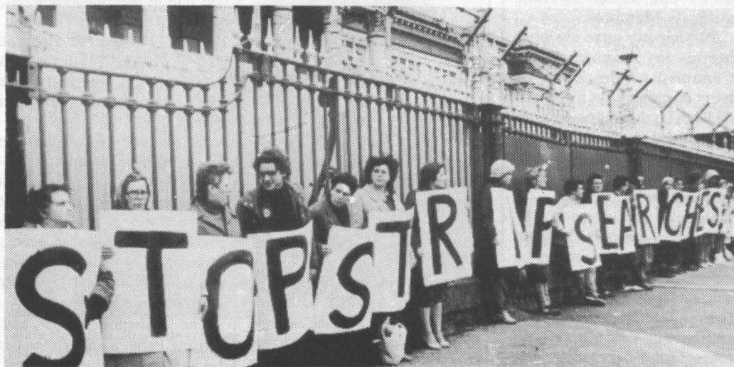
Manifestation contre les fouilles à corps, en Irlande du Nord. Les détenues peuvent être victimes de traitements cruels et dégradants lorsqu’elles sont déshabillées pour être fouillées dans le but délibéré de les humilier.

La période comprise entre l’arrestation et l’arrivée dans un centre officiel de détention est particulièrement dangereuse pour les femmes. Les arrestations peuvent avoir lieu dans des régions reculées. Les femmes qui sont arrêtées sont emmenées jusqu’au centre de détention qui est parfois très éloigné. Il y a