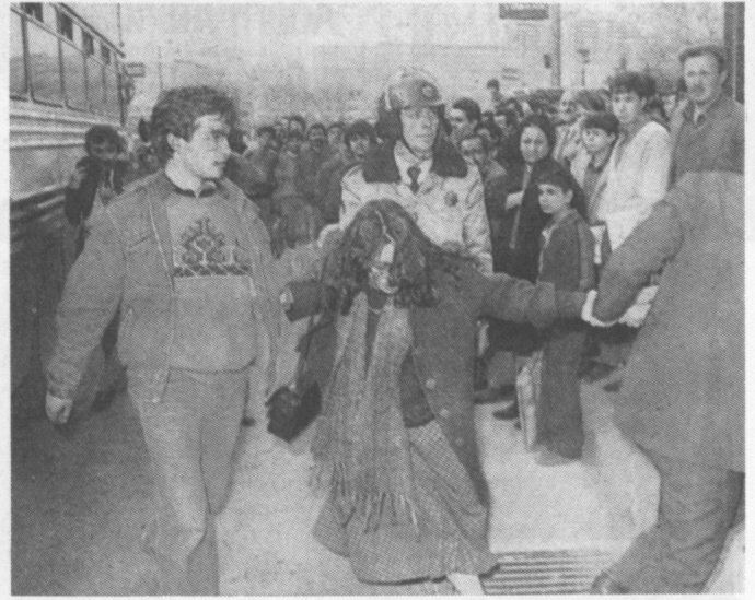
Des centaines d'étudiants ont été arrêtés en Turquie, en avril 1987, à la suite de manifestations contre les restrictions imposées aux associations d'étudiants. Une étudiante a affirmé avoir été torturée en prison.

En El Salvador, une jeune femme a été détenue par la garde nationale en avril 1987. Elle a déclaré avoir été interrogée et torturée trois jours durant, période pendant laquelle des membres de la garde