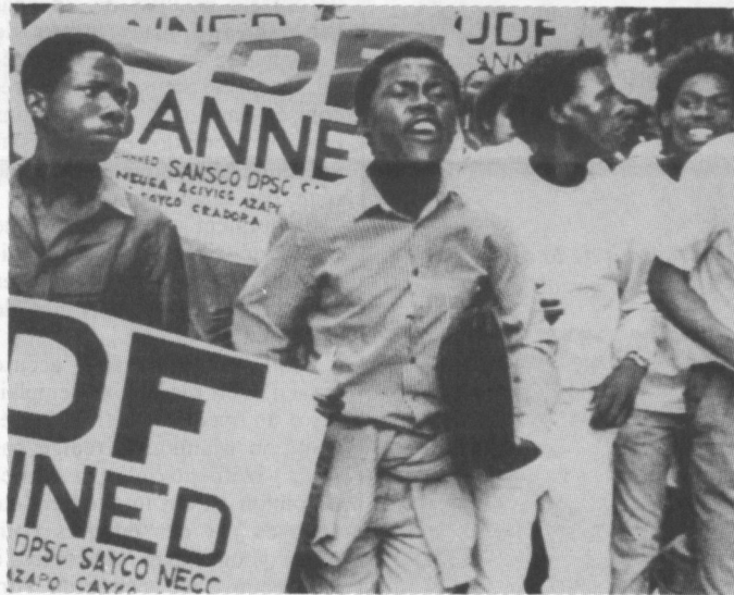
De jeunes Noirs protestent contre les restrictions, à Johannesburg.

DERNIERE HEURE : Le 14 mars, AI a demandé au président sud-africain Botha d'épargner les "six de Sharpeville", au reçu de la nouvelle que leur exécution était imminente.