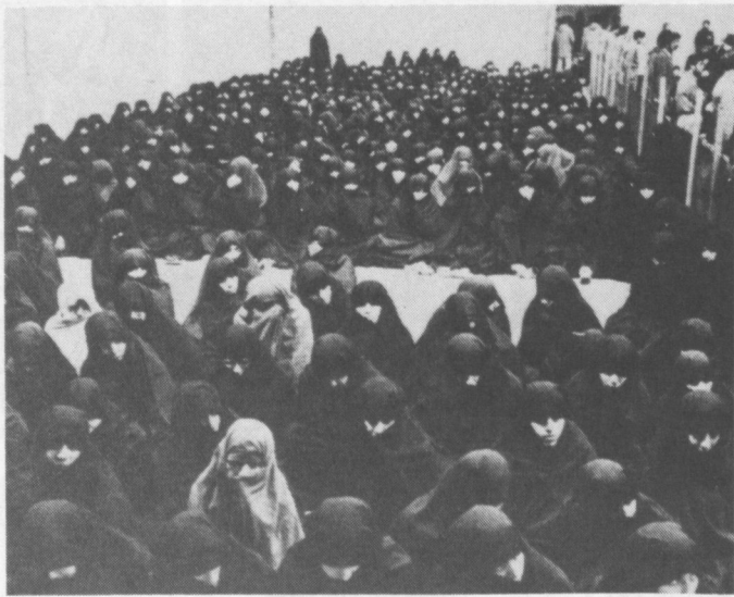
Femmes à la prison d'Evin (Iran). AI a été informée de nombreux cas de torture et de sévices sexuels infligés aux femmes qui sont emprisonnées en Iran. Les coups de fouet, notamment sur la plante des pieds, sont l'une des tortures les plus courantes.

Chili. Dans son témoignage elle décrit comment elle a été conduite, les yeux bandés, dans un centre d'interrogatoire où elle a été torturée à l'électricité, violée, droguée et forcée à signer des déclarations qu'elle n'était pas autorisée à lire. Elle a été inculpée et envoyée en prison où elle s'est rendu compte qu'elle était enceinte à la suite du viol. Elle a longuement attendu avant de recevoir les soins médicaux nécessaires, alors même qu'elle avait commencé à éprouver de vives douleurs et qu'elle perdait du sang. Le 21 novembre 1986, elle a été hospitalisée à la suite d'une fausse couche.