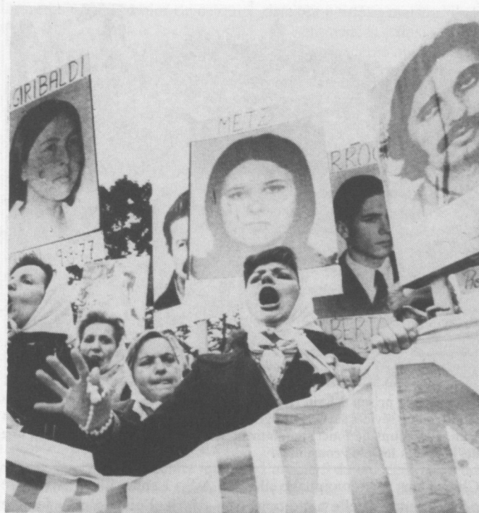
Les mères des "disparus" manifestent à Buenos Aires (Argentine). Pendant la "guerre sale" en Argentine, 150 enfants seraient nés dans des centres de détention secrets ou dans des hôpitaux militaires et enlevés à leurs mères à la naissance. Infliger de l'angoisse aux femmes en leur retirant leurs enfants est une forme de cruauté particulièrement odieuse.