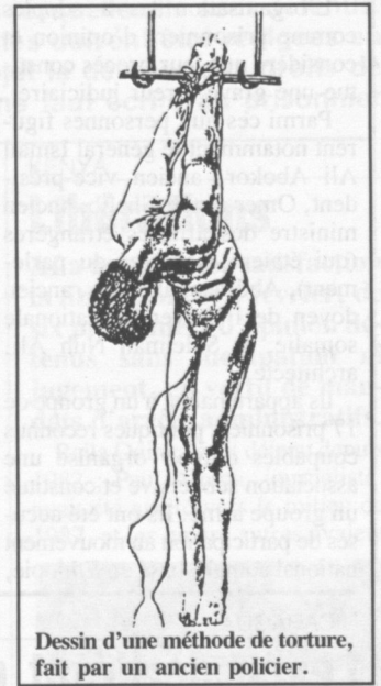
Dessin d'une méthode de torture, fait par un ancien policier.

Le 10 janvier, Fuat Atalay, député du Parti populiste social-démocrate (SHP), d'opposition, a déclaré à l'occasion d'une conférence de presse à Diyarbakir que 11 villages, dans le district de Lice,