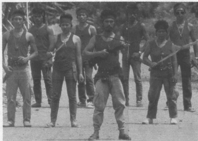
Des membres de Puluhan , l'un des groupes paramilitaires accusés d'exécutions illégales.