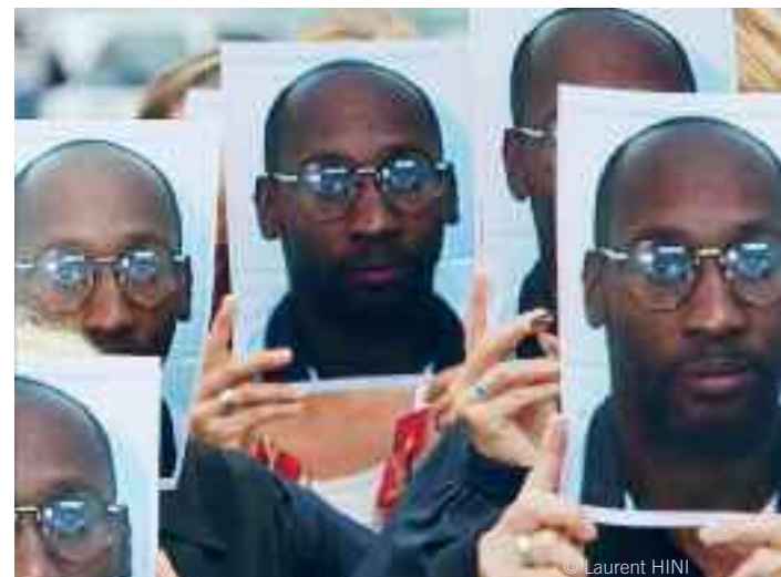
Venus de France, des militants d'Amnesty International arborant des portraits de Troy Davis protestent contre la peine de mort aux États-Unis (juillet 2008).

Les militants mettent souvent l'accent sur le nécessaire respect des normes internationales en matière d'utilisation de la peine de mort, mais ce sont les cas individuels, les noms et les visages des condamnés à mort, qui captent l'attention de l'opinion publique.