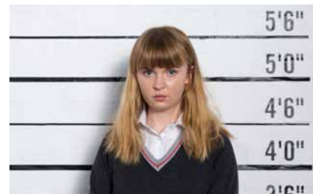
Images ci-dessus : Campagne d'Amnesty International Ce n'est pas une criminelle , qui demandait la dépénalisation de l'avortement en Irlande, septembre 2015.

référence à ces personnes pour tenter de légitimer leurs pratiques sexuelles, mais plutôt des notions d'autonomie et de travail, et où les hiérarchies sexuelles selon lesquelles le commerce du sexe est la forme la moins valorisée de pratiques sexuelles sont combattues.