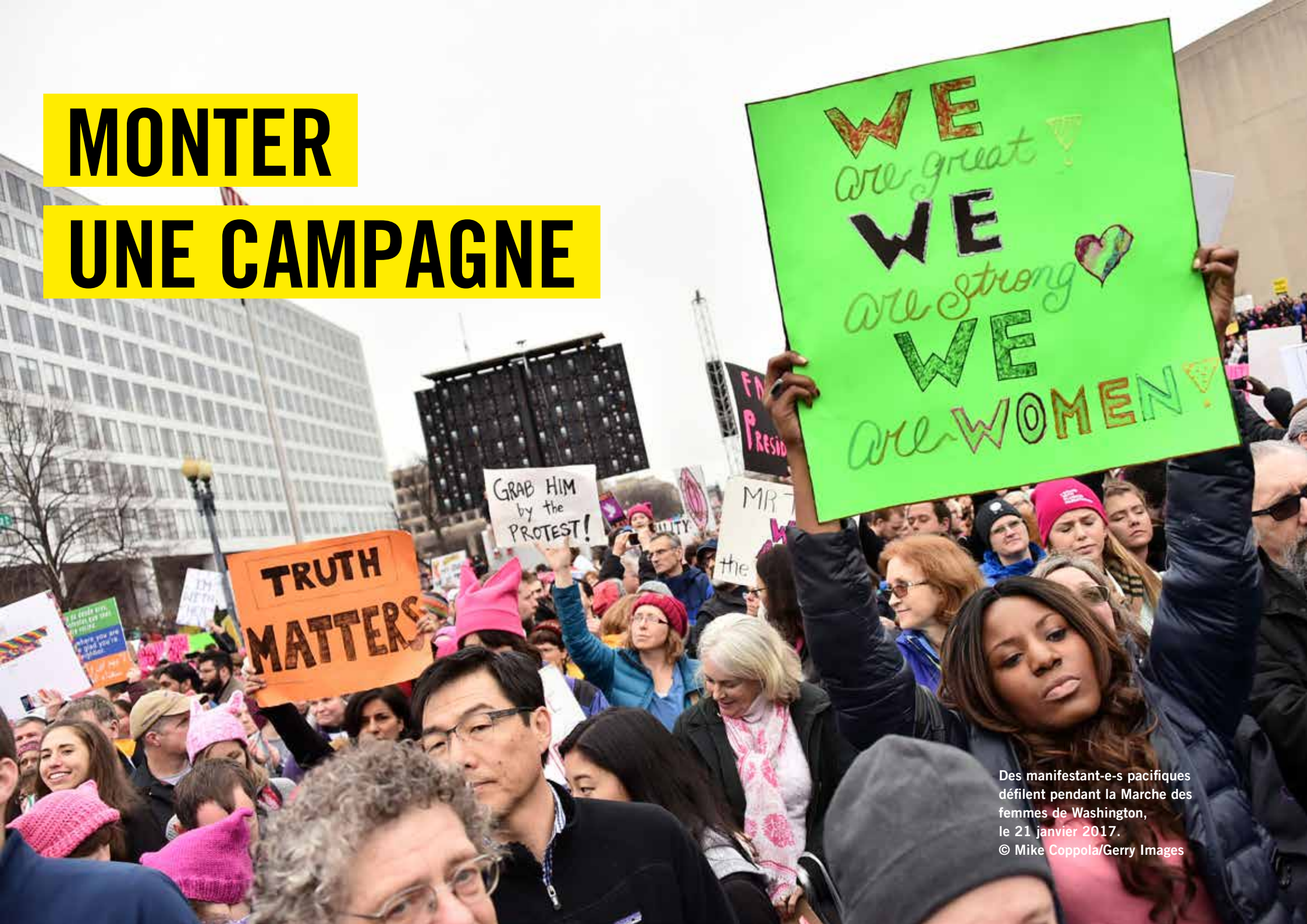
Des manifestant-e-s pacifiques défilent pendant la Marche des femmes de Washington, le 21 janvier 2017.