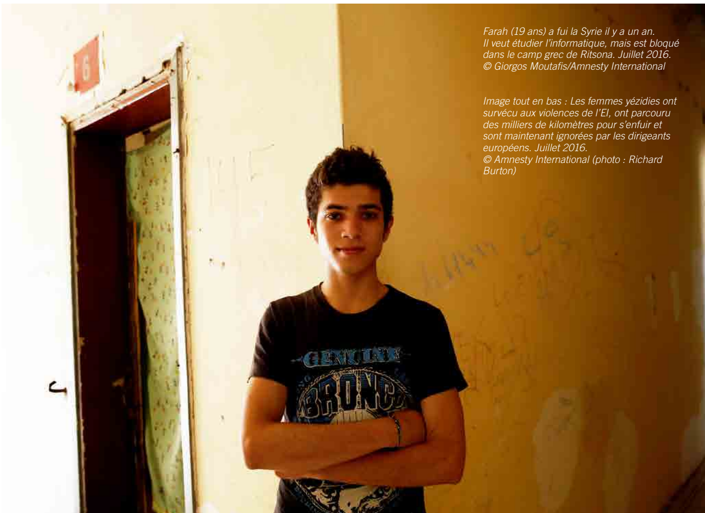
Farah (19 ans) a fui la Syrie il y a un an. Il veut étudier l'informatique, mais est bloqué dans le camp grec de Ritsona. Juillet 2016.