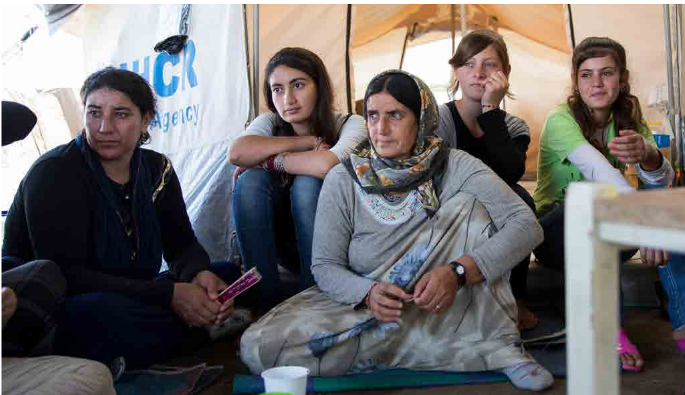
Image tout en bas : Les femmes yézidiées ont survécu aux violences de l'EI, ont parcouru des milliers de kilomètres pour s'enfuir et sont maintenant ignorées par les dirigeants européens. Juillet 2016.