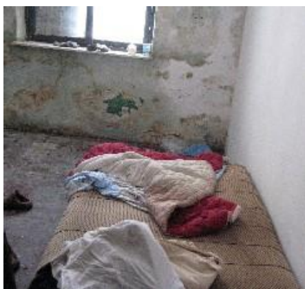
Tiranë: dhomë në ish-konviktin e Shkollës Hoteleri-Turizëm

“Sikurse janë shprehur si Komisioni për Vendbanimet Njerëzore, ashtu edhe Strategjia Globale për Strehimin për vitin 2000: ‘Strehim i përshtatshëm nënkupton ... një jetë private të përshtatshme, hapësirë të përshtatshme, siguri të përshtatshme, ndriçim dhe ajrim të përshtatshëm, infrastrukturë bazë të përshtatshme dhe vendndodhje të përshtatshme në lidhje me punën dhe lehtësirat bazë, të gjitha këto me një kosto të arsyeshme’.” 62