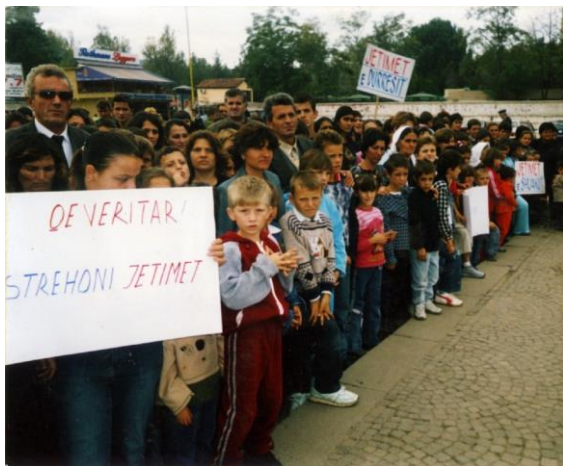
Protestë për të drejtat e jetimëve për strehim

Ky raport shqyrton se si mosmbrojtja siç duhet e të drejtave njerëzore të jetimëve në Shqipëri ka ndikuar në përkeqësimin e neglizhimit të tyre shoqëror ndërsa ata rriten. Raporti vë në kontrast të drejtën e tyre për strehim sipas legjislacionit ndërkombëtar dhe atij shqiptar, me kushtet e vajtueshme në të cilat ata gjenden kur arrijnë moshën madhore, si dhe tregon se si mohimi i kësaj të drejte ndikon në mundësinë që ata të gëzojnë të drejta të tjera, duke i çuar ata edhe më thellë në varfëri dhe përjashtim social.