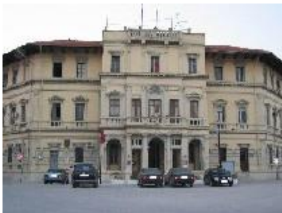
Bashkia e Vlorës

Me mbarimin e vitit të parafundit të shkollës, institucionet që trajtojnë jetimë përfshirë dhe ato arsimore, janë të detyruara të dërgojnë në Ministrinë e Punës dhe Çështjeve Sociale, si edhe tek autoritetet vendore të shërbimit social, statistika të sakta, në mënyrë që të merren masa për të siguruar strehimin dhe punësimin e jetimëve. 34