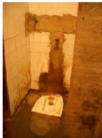
Tiranë: Kushte johigjienike në ish-konviktin e Shkollës Hoteleri-Turizëm

Ky qëndrim sugjeron se jetimët nëpër konvikte në një farë mënyre shfrytëzojnë shtetin, një akuzë e cila qartazi nuk qëndron po të kihet parasysh dështimi i shtetit për të respektuar, mbrojtur dhe përmbushur të drejtën e jetimëve për një strehim të përshtatshëm. Qëndrimi gjithashtu kërkon të tregojë se jetimët janë përgjegjës për kushtet në të cilat jetojnë, sepse nuk kanë plotësuar kërkesat formale për të marrë strehim. Është e vërtetë se jo të gjithë jetimët që Amnesty International takoi në Tiranë dhe Shkodër kishin plotësuar procedurat që