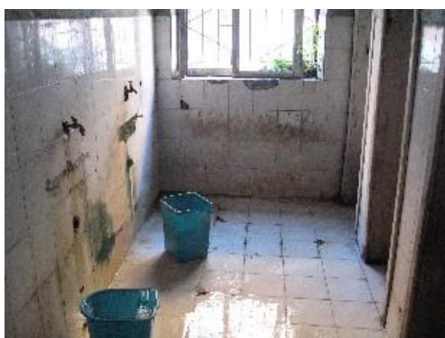
Shkodër: konvikti i shkollës industriale, pjesa e tualeteve

Jetim në moshë madhore i intervistuar nga Amnesty International