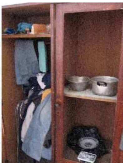
Shkodër: konvikti i shkollës industriale - pajisjet

“Strehimi është shumë i rëndësishëm, sepse një kore buke ata [jetimët] e hanë, por vazhdojnë të jetojnë në një situatë jo të mirë. Po ashtu disa prej tyre e kanë pranuar këtë gjendje dhe nuk bëjnë asgjë për ta ndryshuar. Ka të tjerë që duan të krijojnë familje e të bëjnë jetë stabël, por është e pamundur pa patur një shtëpi. Duke i dhënë strehimin, e largon nga ky vend dhe i jep atij më tepër motivim për të punuar e për të gjetur mundësi të reja. Duke i dhënë një shtëpi e detyron që të bëjë diçka për jetën e tij. Shumë OJF të huaja u kanë ofruar trajnime të ndryshme, mirëpo shumica e tyre nuk pranojnë të shkojnë në kurs sepse nuk paguhen për pjesëmarrjen. Ata preferojnë të bëjnë çfarëdo pune të vogël e të fitojnë ndonjë lek se të harxhojnë kohën duke u trajnuar.”