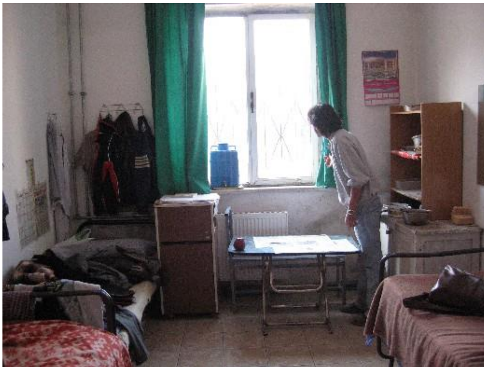
Shkodër: konvikti i Shkollës së Muzikës – duke parë të ardhmen

Ndërsa shkalla e këtyre investimeve për banesa sociale nuk rrit shpresa se do të përmbushen menjëherë nevojat për strehim të më të varfërve dhe personave më të pambrojtur, ato pasqyrojnë faktin se pranohet që këto nevoja nuk mund të injorohen më. Mbetet për tu parë se deri në çfarë pike do të respektohet e drejta e jetimëve për t’u trajtuar me prioritet për strehim, “ e drejta për të jetuar diku në siguri, paqe dhe me dinjitet ”.