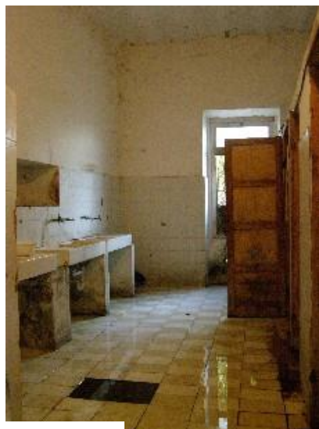
Vlorë: kushtet në ish-konviktin e Shkollës Tregëtare