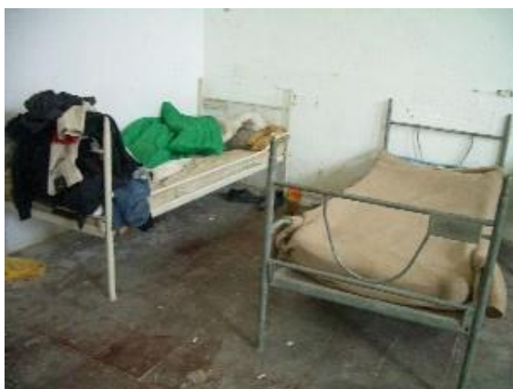
Tiranë: dhomë në ish-konviktin e Shkollës Hoteleri-Turizëm

Megjithatë, godina ishte në një gjendje aq të keqe saqë nevojitej të bëhej një punë e madhe rindërtuese, dhe mesa duket kjo familje dhe jetimët e tjerë duhet të largoheshin prej andej shumë shpejt. Autoritetet siguruan strehim të përkohshëm në konviktin e Shkollës Elektrike, por vetëm për 11 jetimë që ishin ende nxënës të shkollës së mesme.