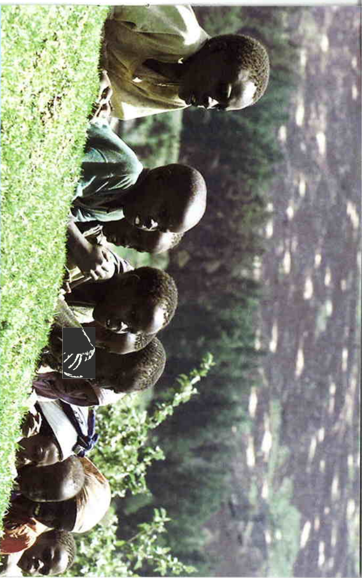
本頁：在肯亞的Kapleget，兒童正在聆聽環境保護論者演說 封面相片：政府有責任保護兒童的所有權利，包括經濟、社會、公民及政治權利。2001年7月，在菲律賓一個要求改善經濟的抗議上，赤貧區的兒童在放紙飛機。

政府有責任保護兒童的所有權利，包括經濟、社會、文化、公民及政治權利。政府不但要為政府官員違反人權的行為負責，亦須採取積極的措施防止不論在社區或家庭的個別人士侵犯兒童的人權。 國際特赦組織發起全球運動，確保兒童的人權受到保護；促請政府、反對派系及其他照顧兒童的人在看待兒童時，必須以兒童最大的利益為原則作首要的考慮。