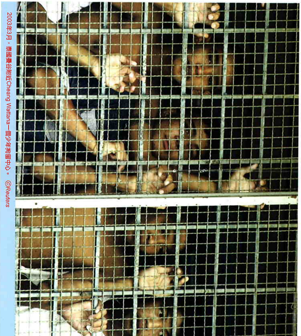
2003年3月，泰國曼谷附近Cheang Wattana一個少年拘留中心。

兒童犯通常都犯下輕微罪行，好像偷竊；而某情況下可以說他們的「罪行」就是貧窮與無家可歸。很多兒童只有靠乞討、偷竊等輕微罪行或賣淫為生。而這些活動往往使他們很容易便成為警察任意拘留及虐待的對象。無論兒童面對甚麼刑事指控，剝奪自由的拘禁都只能是最後的方法，而拘留期亦應為最短的適當時間。其實，