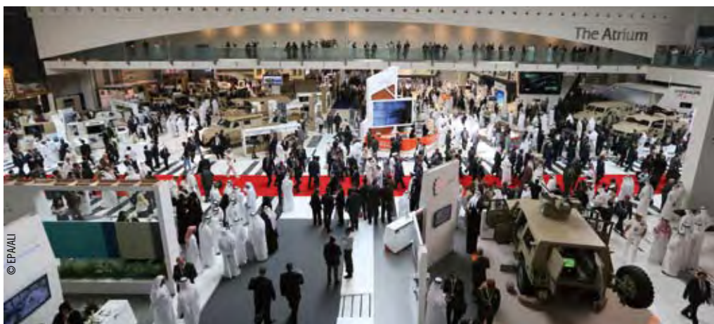
阿布扎比国际防务展是中东和北非地区规模最大的防务交易会，越来越多的中国公司在这里推销执法装备。

国际特赦组织和欧米茄研究基金会分析了多种不同中国制的装备，评估了其用于执法目的的合法性，并提供例子显示“酷刑用具”获准用于拘留场所时发生的情况；以及当合法装备在没有必要保障措施到位时被用于镇压的情况。