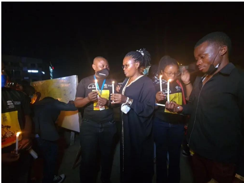
La campagne « Une Bougie pour la liberté de la presse » a été lancée par le syndicat des médias du Nord-Kivu pour montrer sa solidarité avec les personnes tuées et demander justice.

Pourtant, selon Tshivis Tshivuadi, à la fin du mois de janvier 2022, aucun progrès n'avait été constaté en la matière. 123