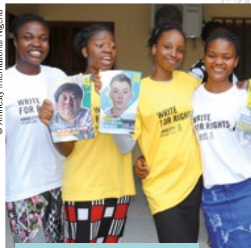
Activistas de Amnistía Nigeria participan en Escribe por los Derechos 2021.

Conoce a las personas por las que luchamos: https://www.amnesty.org/es/get-involved/write-for-rights/