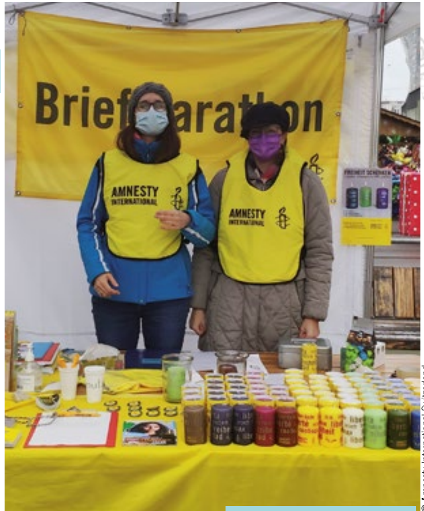
Activistas de Amnistía Suiza participan en Escribe por los Derechos 2021.

Los derechos humanos no son artículos de lujo para disfrutarlos sólo cuando las circunstancias lo permitan.