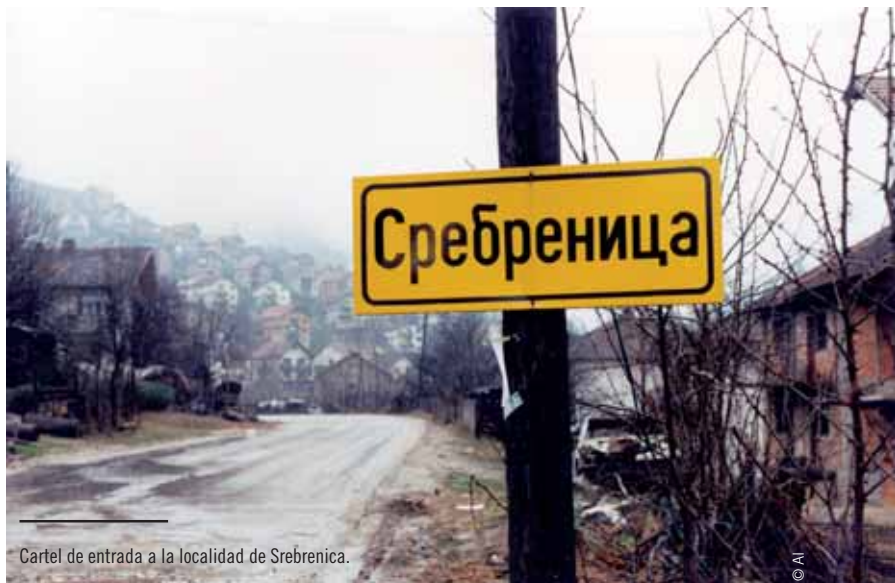
Cartel de entrada a la localidad de Srebrenica.

En el segundo fallo, los jueces han invalidado una iniciativa popular de 2008 que prohibía constitucionalmente el matrimonio entre personas del mismo sexo en el estado de California. La Corte afirma implícitamente que el mero hecho de permitir el matrimonio entre personas del mismo sexo no perjudica a otras personas ni a la comunidad en general.