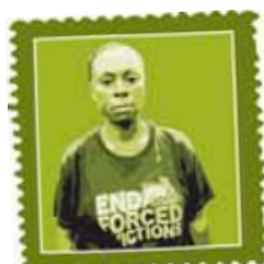
Comunidad de Badia East NIGERIA Centenares de hogares destruidos.