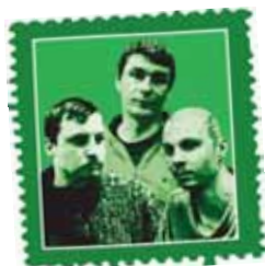
Los tres de Bolotnaya RUSIA

Activista del derecho a la vivienda encarcelada.