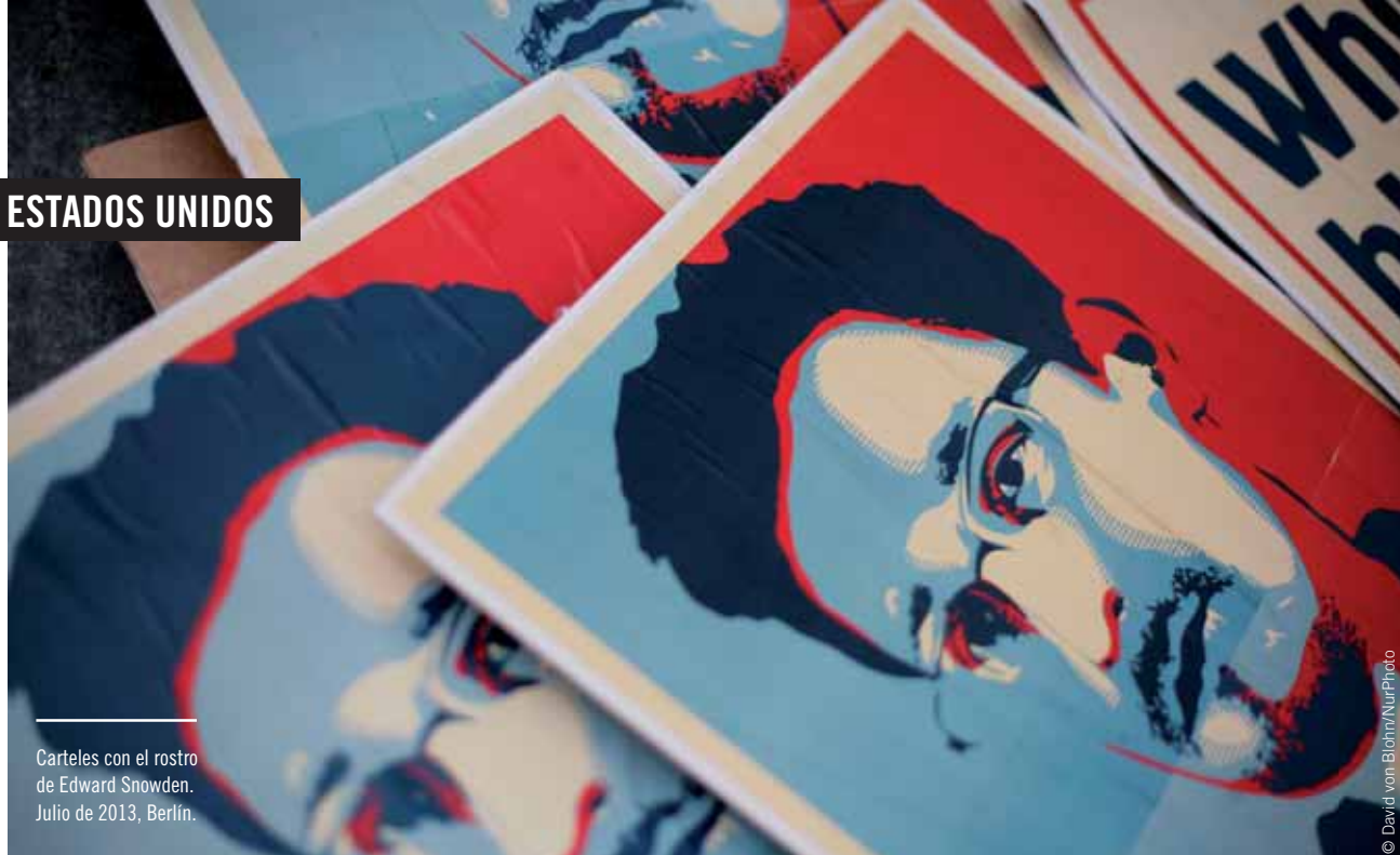
Carteles con el rostro de Edward Snowden. Julio de 2013, Berlín.