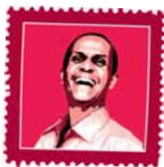
Eskinder Nega ETIOPÍA Periodista encarcelado por criticar al gobierno.