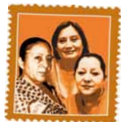
COFADEH HONDURAS Amenazas contra defensores y defensoras de los derechos humanos.