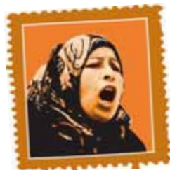
Pueblo de Nabi Saleh TERRITORIOS PALESTINOS OCUPADOS