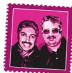
13 activistas de la oposición bahreiní encarcelados BAHRÉIN En prisión por su activismo y por expresar sus opiniones.