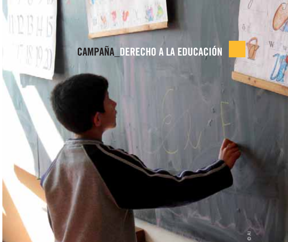
Un alumno romaní de la escuela especial en Pavlovce nad Uhom practica la escritura, marzo de 2008.

La campaña de Amnistía Internacional comenzó en noviembre de 2007 con la publicación del informe Aún separados ,