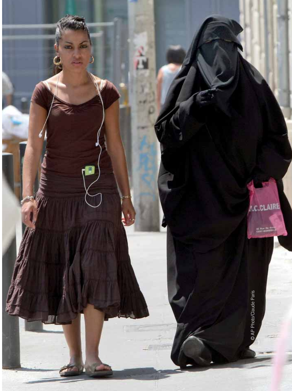
Dos mujeres pasean por el centro de Marsella, una de ellas cubierta con el niqab , velo que llevan las musulmanas más conservadoras y que sólo deja ver los ojos (junio de 2009). El pasado 21 de abril, el presidente francés, Nicolas Sarkozy, presentó un proyecto de ley que prohíbe llevar en público velos que cubran todo el rostro y el cuerpo.

La popularidad de las prohibiciones sobre el uso de velos integrales se debe