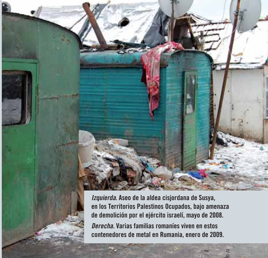
Izquierda. Aseo de la aldea cisjordana de Susya, en los Territorios Palestinos Ocupados, bajo amenaza de demolición por el ejército israelí, mayo de 2008.

Los ODM han contribuido de forma crucial a centrar la atención internacional en cuestiones de desarrollo y reducción de la pobreza. La mayoría de los organismos internacionales para el desarrollo los han apoyado y les han dado prioridad. Los ODM han proporcionado también un punto de referencia en torno al cual se ha movilizado la sociedad civil en las esferas nacional e internacional. Pero el progreso ha sido dispar y la ONU advierte que muchas de las metas no se cumplirán a menos que se intensifiquen enormemente los esfuerzos.