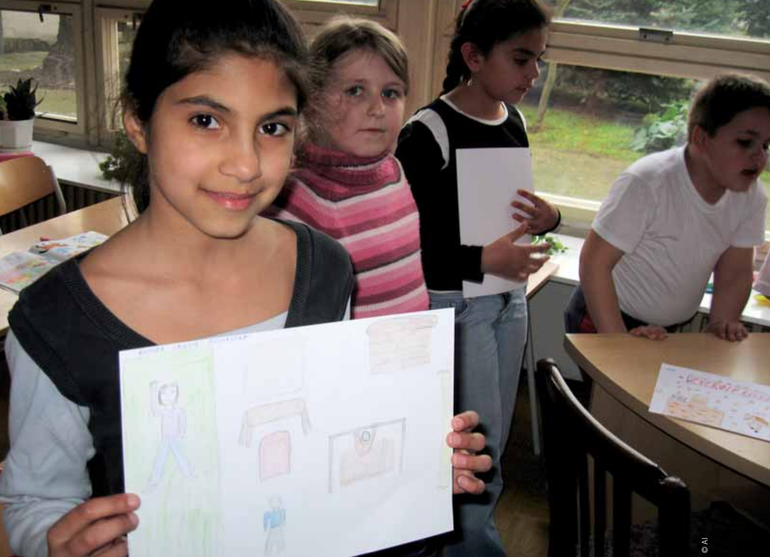
Alumnos romaníes y no romaníes en clase, en la escuela general de Pavlovce nad Uhom, marzo de 2008.