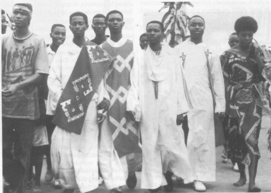
Al menos 37 personas resultaron muertas cuando las tropas zaireñas abrieron fuego contra esta manifestación pacífica.

Las autoridades tunecinas han detenido arbitrariamente a miles de simpatizantes de al-Nahda (Renacimiento), movimiento islámico ilegal. Los detenidos son rutinariamente sometidos a torturas. Al menos 8 presuntos miembros de al-Nahda han muerto en circunstancias sospechosas mientras se hallaban bajo custodia. Algunas estudiantes que usaban el velo islámico dicen que han sido blanco de detenciones y posteriores maltratos o torturas en comisarías de policía. Desde septiembre de 1990, se ha condenado en juicios sin garantías a miles de musulmanes, en su mayoría por pertenecer a una asociación ilegal y por asistir a reuniones no autorizadas. Aunque algunos miembros de al-Nahda han participado en actos violentos, la mayoría de los detenidos nunca han sido acusados de actos violentos, y son o podrían ser presos de conciencia.