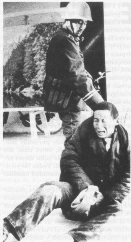
China: Monje tibetano detenido durante una manifestación en favor de la independencia del Tíbet.

En Haití, cuyo gobierno democrático fue derrocado tras un golpe militar en septiembre de 1991, se han generalizado las ejecuciones extrajudiciales, las detenciones arbitrarias y los malos tratos brutales. Los miembros del clero católico, especialmente, han sido blanco de la represión. Al menos 16 sacerdotes y tres monjas fueron detenidos