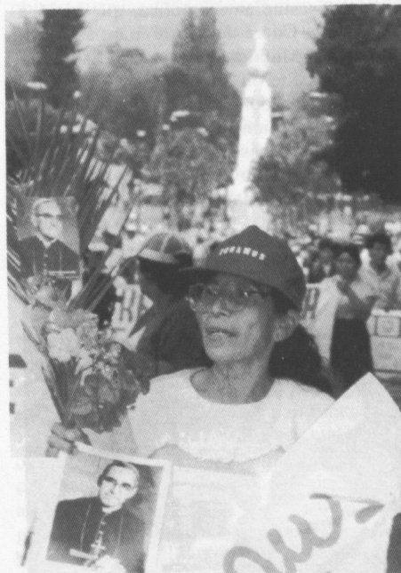
El Salvador: Una anciana lleva el retrato del arzobispo Óscar Romero en una marcha conmemorativa del duodécimo aniversario de su asesinato. En 1980, el arzobispo Romero fue abatido a tiros mientras celebraba misa, un día después de que éste hiciera un llamamiento a las fuerzas de seguridad para que dejaran de matar a sus compatriotas salvadoreños.

La tolerancia religiosa debe ser parte integral de cualquier sistema político que pretenda respetar plenamente los derechos humanos. No es de esperar que los gobiernos que violan impunemente el derecho fundamental a la libertad de fe y expresión religiosas vayan a respetar los derechos de sus ciudadanos a la vida, la seguridad personal o la libertad de expresión, asociación y reunión, derechos de los que deben gozar todas las personas sin excepción. □