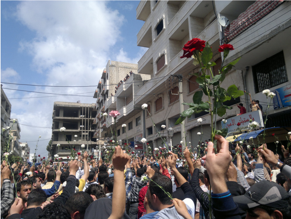
Manifestación pacífica a favor de las reformas en Baniyas, localidad costera situada al norte de Damasco.

Desde finales de 2010, millones de personas de Oriente Medio y el Norte de África se han echado a las calles para pedir mayores derechos y libertad y la sustitución de regímenes autoritarios. En Siria, gobernada con mano de hierro por Hafez al Assad de 1971 a 2000 y posteriormente por su hijo Bashar al Assad, comenzaron a celebrarse pequeñas manifestaciones en febrero, que no se convirtieron en protestas masivas hasta mediados de marzo. Desde entonces, las protestas se han extendido por todo el país y han alcanzado unas dimensiones sin precedentes y un impulso que no muestra signos de decaer pese a la severa represión del gobierno, que ha causado cientos de muertos.