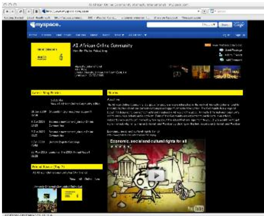
Comunidad Online Africana de Amnistía Internacional en MySpace.