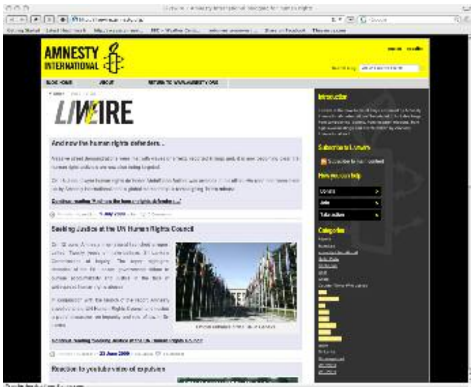
Livewire, el blog de Amnistía Internacional, en http://livewire.amnesty.org/?lang=es .