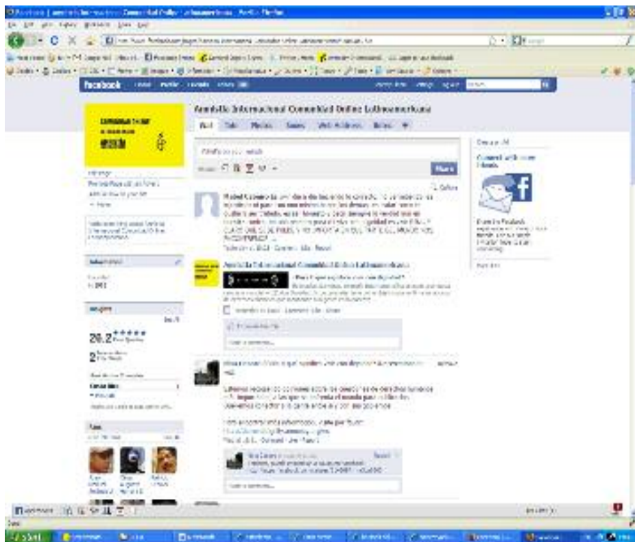
Comunidad Online Latinoamericana de Amnistía Internacional en Facebook.