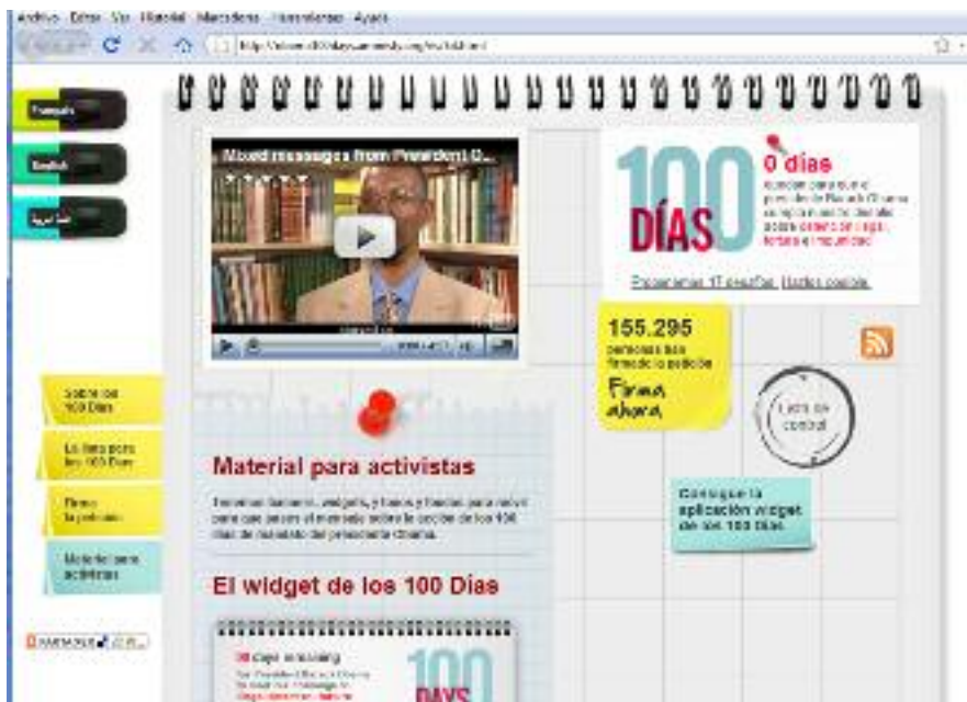
Banner de la campaña ¡Aviva la llama! (arriba) y widget de la campaña 100 Días de Amnistía Internacional (abajo).