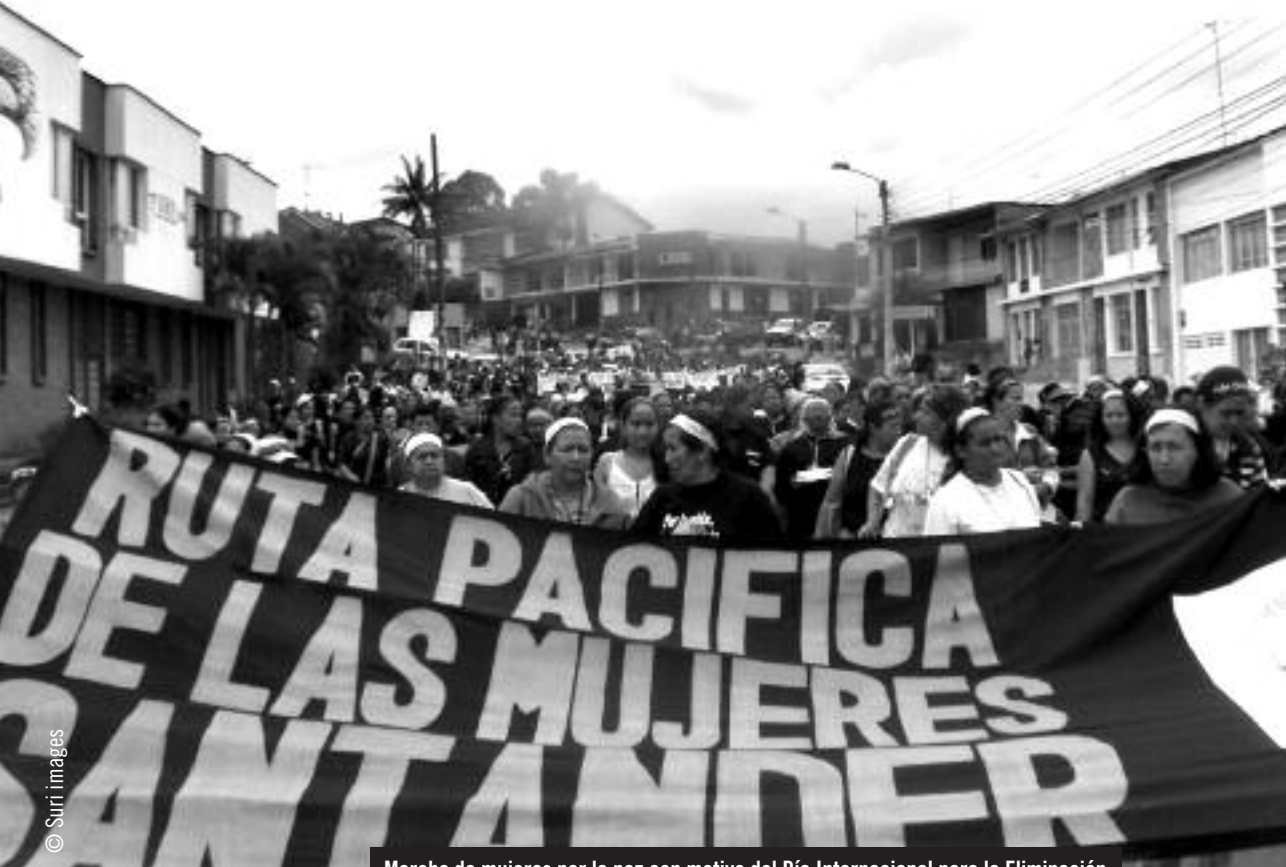
Marcha de mujeres por la paz con motivo del Día Internacional para la Eliminación de la Violencia contra las Mujeres, 25 de noviembre de 2007. La manifestación comenzó en Popayán (departamento de Cauca) y continuó hasta Rumichaca (departamento de Nariño), que está en la frontera con Ecuador, para poner de relieve el sufrimiento de las mujeres desplazadas en el sur del país.

las niñas son víctimas de la violencia social y doméstica. Sin embargo, el conflicto agudiza estas formas de violencia y los estereotipos de género que las sustentan.