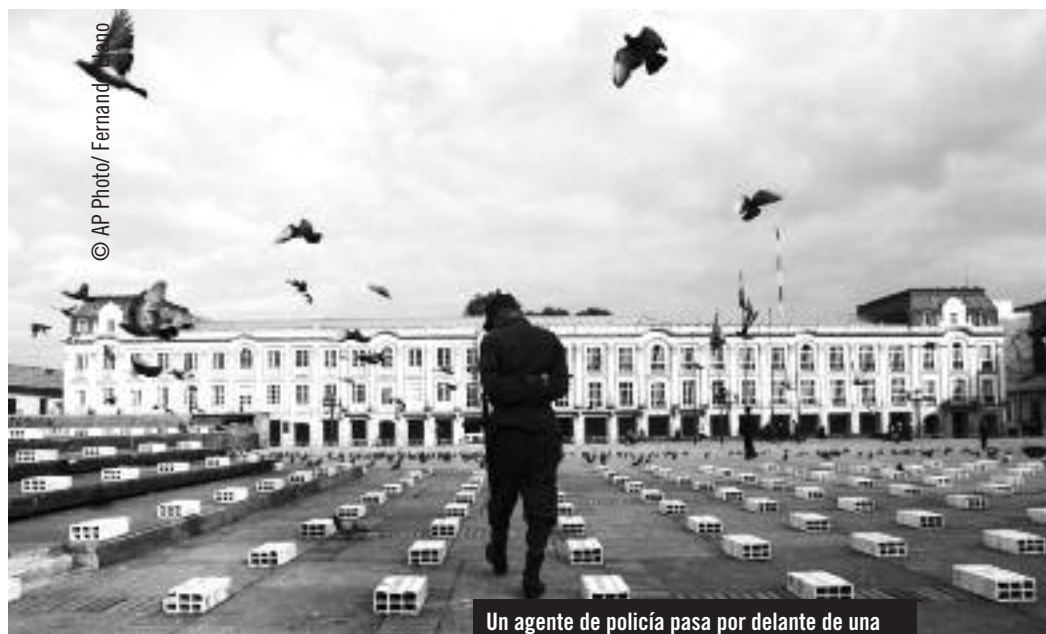
Un agente de policía pasa por delante de una inscripción conmemorativa de nombres de víctimas del conflicto en la plaza de Bolívar, Bogotá, abril de 2008.

humanos y sindicalistas es motivo de grave preocupación. También hay indicios que muestran claramente que los grupos paramilitares continúan activos y siguen cometiendo violaciones de derechos humanos, a pesar de que el gobierno afirma lo contrario.