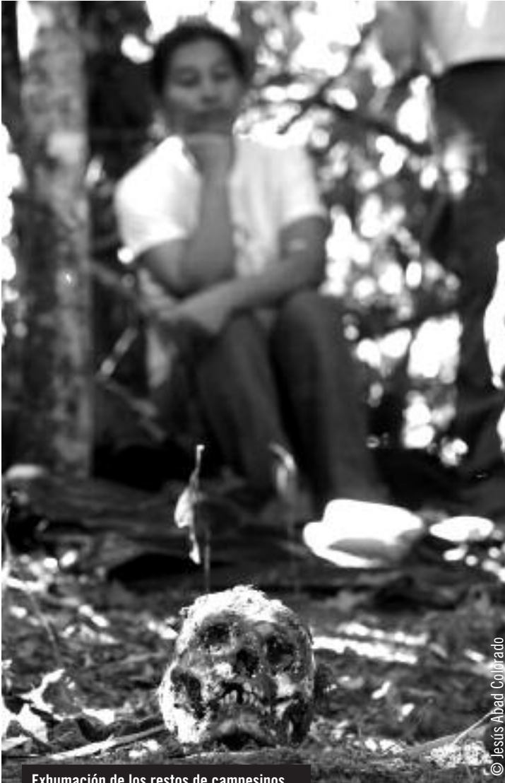
Exhumación de los restos de campesinos muertos a manos de paramilitares realizada en 2007 en San Carlos (departamento de Antioquia).