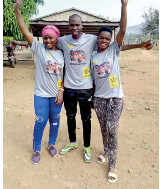
La membresía de Amnistía Internacional Togo reunida para la campaña Escribe por los Derechos, 2019. Cada año movilizan a personas de todos el país para que participen.

Desde las atrocidades cometidas en la Segunda Guerra Mundial, los instrumentos internacionales de derechos humanos, empezando por la Declaración Universal de Derechos Humanos, proporcionan un sólido marco para el establecimiento de legislación nacional, regional e internacional dirigida a mejorar la vida de las personas en todo el mundo. Los derechos humanos pueden considerarse leyes para los gobiernos, pues crean para éstos y para las autoridades del Estado la obligación de respetar, proteger y hacer efectivos los derechos de las personas que están bajo su jurisdicción y también para quienes están fuera de ella.