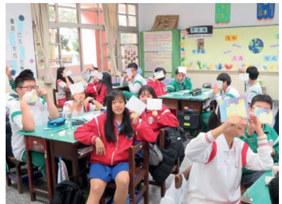
Estudiantes y docentes de Taiwán organizaron eventos de envío de cartas con Amnistía Internacional para la campaña Escribe por los Derechos 2019.

Si los métodos de aprendizaje participativo no te son familiares, consulta el Manual de Facilitación de Amnistía Internacional antes de empezar. Lo encontrarás en www.amnesty.org/es/documents/ACT35/020/2011/es/