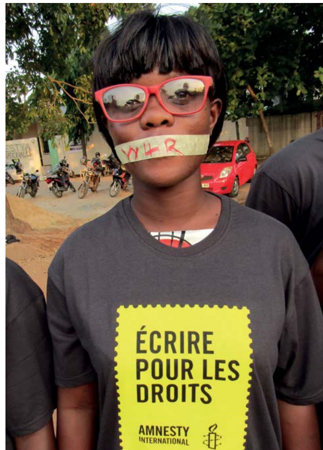
Simpatizantes de Amnistía hacen campaña en favor de los defensores y defensoras de los derechos humanos en Togo como parte de Escribe por los Derechos 2018.

Evariste Ndayishimiye fue investido presidente el 18 de junio —antes de la ceremonia de traspaso de poderes prevista para agosto de 2020— tras la muerte del presidente Nkurunziza, oficialmente de un ataque al corazón, el 8 de junio. El 23 de junio, el nuevo presidente nombró primer ministro a alguien acusado por múltiples organizaciones burundesas de haber tenido un papel preponderante en la represión de manifestaciones y disidentes desde abril de 2015.