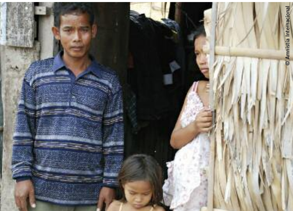
Una familia desalojada por la fuerza de su hogar en la calle 202 de Phnom Penh, capital de Camboya, a la entrada de su vivienda en Chambok Thom, uno de los muchos reasentamientos inadecuados cerca de la ciudad, febrero de 2008.

que utilizar “letrinas colgantes” (tenderetes hechos de madera o trapos, a menudo suspendidos sobre cursos de agua abiertos o fosos de lodo) o “retretes volantes” (pequeñas bolsas de plástico que usan los residentes para deshacerse de sus excreciones).