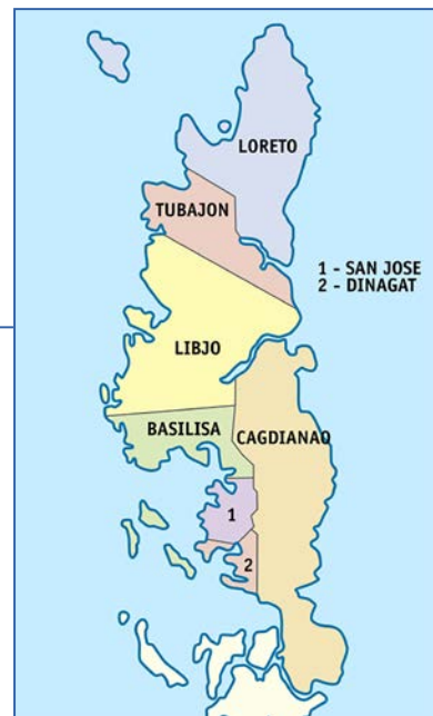
Mapa sa probinsya sa Dinagat Islands.