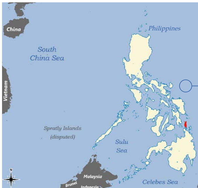
Mapa sa Pilipinas.

sa balor sa pagmina sa rehiyon sa Caraga, diin sakop ang lalawigan sa Dinagat Islands, sa PHP 17.74 bilyon (US $350 milyon) sa 2018. Kini gibanabana nga 16.8% sa gross regional domestic product. 20 Gibanabana nga 2,300 ka mga tawo ang nakatrabaho sa sektor sa pagmina sa lalawigan sa Dinagat Islands kaniadtong 2019. 21 Kini 1.8% sa 127,000 nga populasyon sa lalawigan. 22 Sa nasyonal, gibanabana nga 0.5% nga trabaho sa "mga nag-unang grupo sa industriya" (nga kauban ang agrikultura, industriya, ug serbisyo) naa sa sektor sa pagmina ug quarry. 23 Kini nagsugyot nga ang pagtrabaho sa minahan sa lalawigan sa Dinagat Islands mas taas kaysa sa nasudnon nga average. Bisan pa sa ilang kaabunda sa mineral, ang Dinagat Islands, Surigao del Norte, ug uban pang mga probinsya sa rehiyon ang pipila sa labing ka pobre sa Pilipinas. 24 Adunay 36% nga mga pamilya sa lalawigan sa Dinagat Islands nga ang kita mas ubos pa sa linya sa kakabus. 25 Bisan pa sa ilang kaabunda sa mga gigikanan sa mineral, ang rehiyon sa Caraga, partikular na ang lalawigan sa Dinagat Islands, pobre.