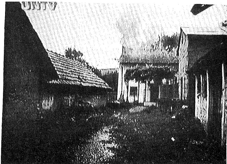
Snimke zapaljenih kuća u Gruborima, 25. kolovoza 1995., koje je snimila UNTV.