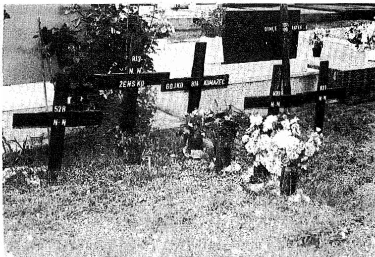
Grobovi na zadarskom groblju. Na križu označenom brojem 813 piše samo 'žensko'.

izvansudski smaknuti ili na drugi način nezakonito ubijeni. Broj smrti je vjerojatno mnogo veći čak i od službene statistike; u nekim slučajevima iz straha za vlastitu sigurnost susjedi ili rodbina sami su, potajno, sahranjivali mrtve bez da su podatke o tome prijavljivali vlastima ili osoblju UN-a. Posebno su bili u strahu od počinitelja ubojstava koji su se još uvijek mogli nalaziti na tom području ili se vratiti kako bi