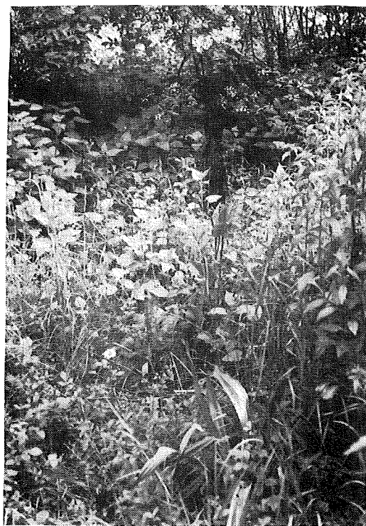
Mjesto za koje rodbina vjeruje da je grob, Donji Skrad.