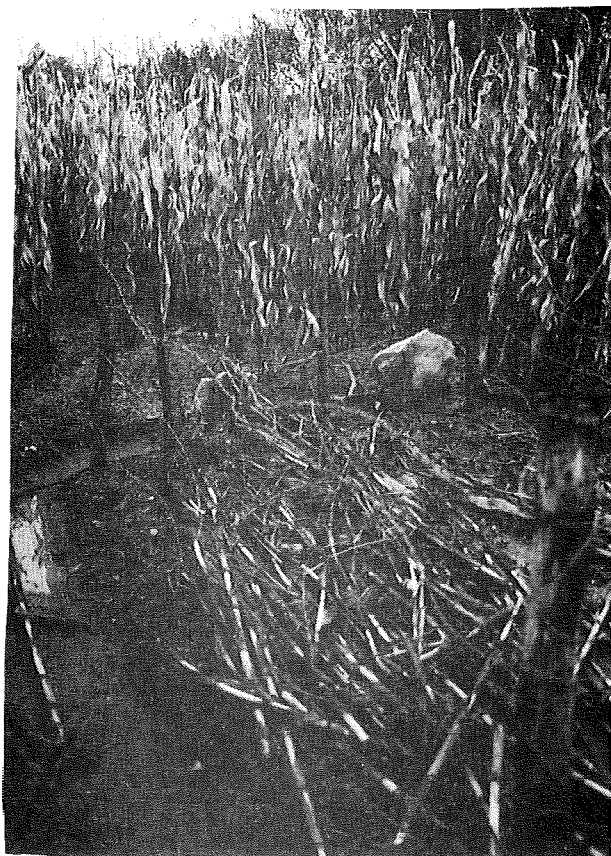
Tajni grobovi pokazani predstavnicima Amnesty Internationala u rujnu 1995.

Većina od 9.000 ljudi koji su ostali u Krajini nakon operacije 'Oluja' su stariji ljudi. Kontekst tih zloupotreba, gdje je stanovništvo bilo tako raspršeno i izolirano, znači da umiranje stanovništava Krajine znači i umiranja izvora velikog dijela istine o Krajini. U dva navrata, kada su predstavnice Amnesty Internationala pokušale saznati što se dogodilo s jednim