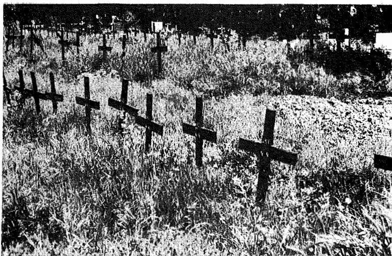
Groblje u Kninu, svibanj 1998.

Vozeći se Krajinom tri godine kasnije, kraj je zadržao nenormalno ozračje. Većinu kuća potpuno su uništile vatra ili pljačka, a polja su obrasla. Tu i tamo obrađena polja ili obješeno rublje upućuje na tragove života. Međutim, odjeća koja visi najčešće uključuje i