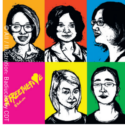
© All / Illustration: Baduacady by CDT

أصدرت محكمة إيطالية في مايو حكماً يقضي بعدم قانونية المخيم الذي نُقل إليه عائلات من طائفة الروما للإقامة فيه كونه أقيم على أسس عرقية يُعزل بموجبها أفراد الطائفة داخله. وجاء الحكم التاريخي بعد حملات شنتها منظمة العفو الدولية وجهات أخرى طوال سنوات من أجل وقف عمليات الإخلاء القسري التي تُنفذ بحق أبناء الروما ووضع حد للتمييز والفصل العنصري الممارس ضدهم. وكانت السلطات قد أجبرت الكثير من عائلات الروما على الانتقال للإقامة في مخيم معزول يتكون من حاويات مسبقة الصنع في 2012. ودُمرت منازل الكثيرين منهم، وبفضل كل من ساهم في حملتنا وساندها، فلن نتوانى عن الاستمرار بالمطالبة بحصول أبناء الروما على نفس الخيارات الإسكانية المتاحة لباقي الأشخاص العاديين.