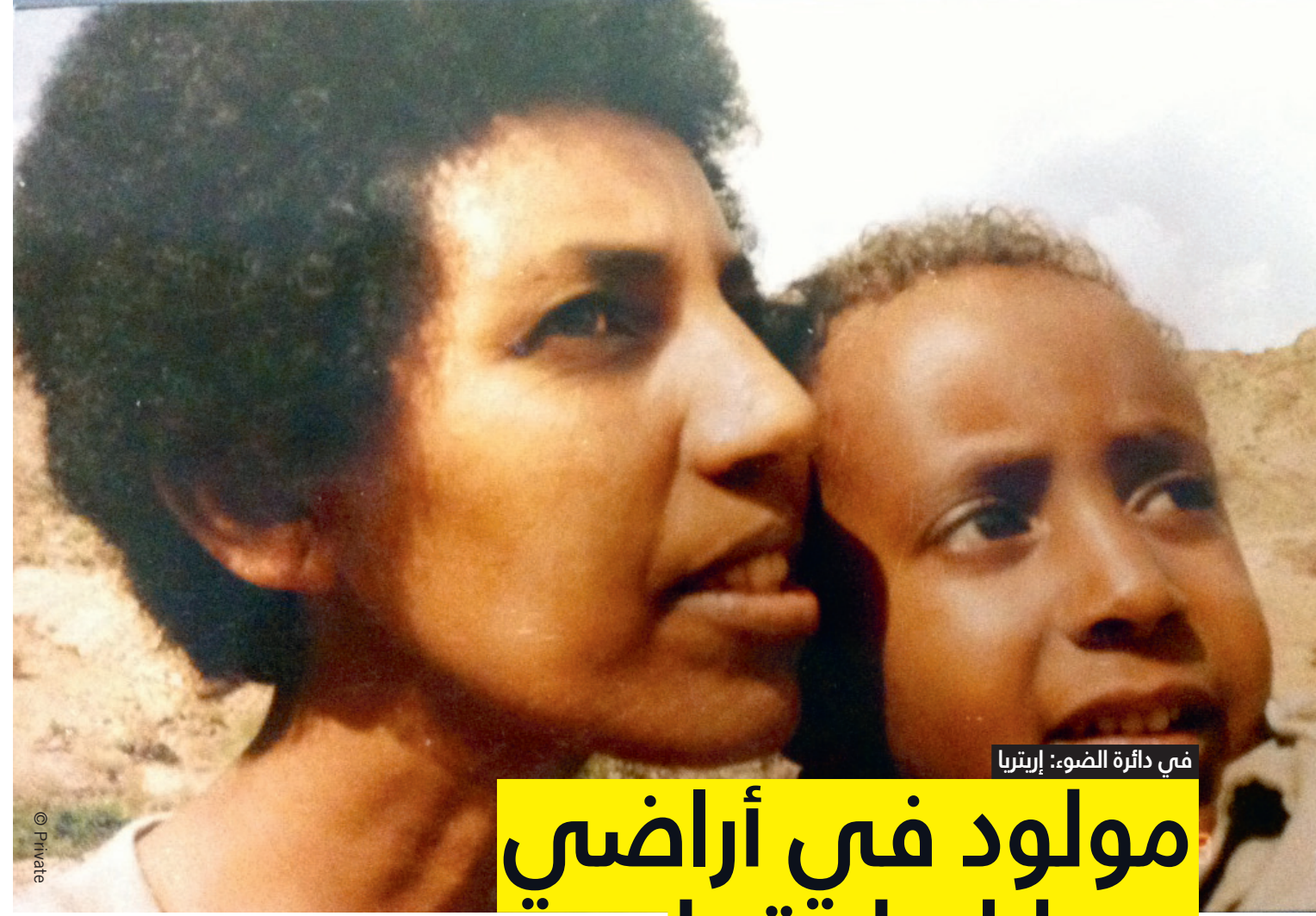
في دائرة الضوء: إريتريا