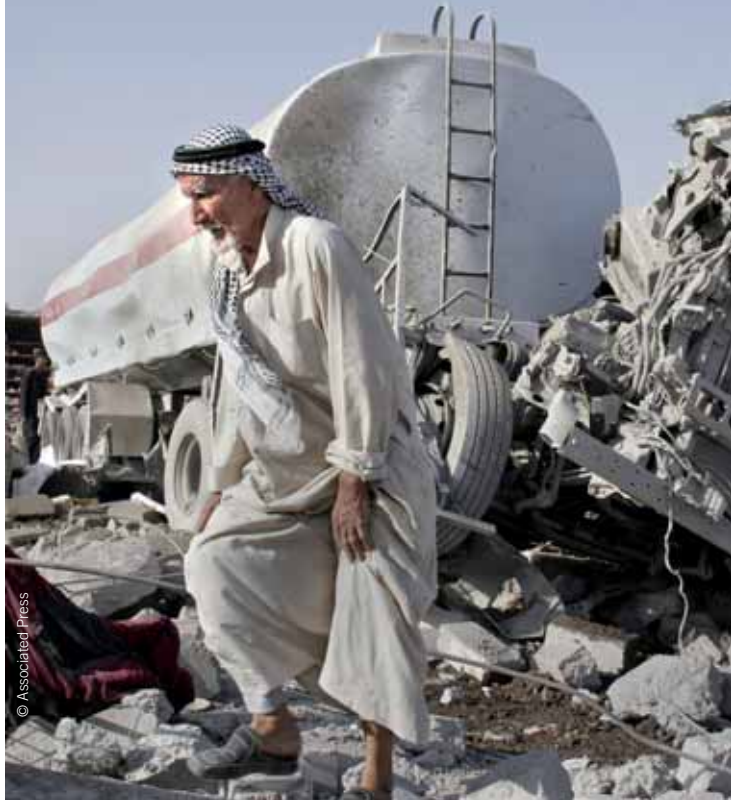
Secuelas de un atentado en un pueblo habitado principalmente por miembros de la minoría shabak. Murieron al menos 34 personas (10 de agosto de 2009).

Las activistas que combaten la violencia contra las mujeres son objeto directo de ataques, principalmente por parte de grupos armados y milicias islamistas. Algunas, como la periodista Sahar Hussain al Haideri, han muerto asesinadas. Su crimen sigue impune. ■