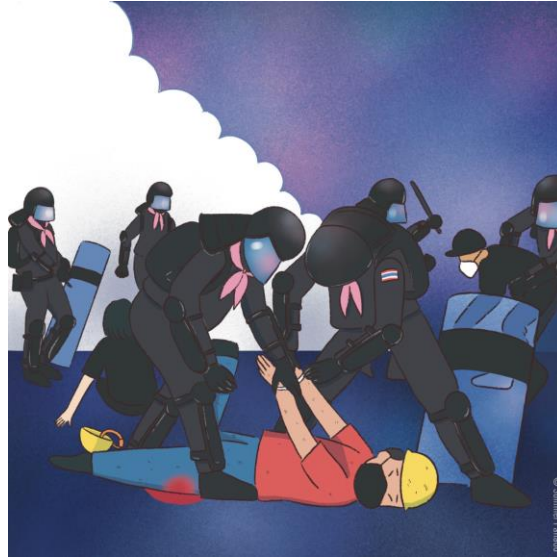
ภาพวาดแสดงให้เห็นเหตุการณ์ตอนที่สายน้ำถูกจับด้วยความรุนแรงโดยเจ้าหน้าที่ตำรวจระหว่างการสลายการชุมนุม