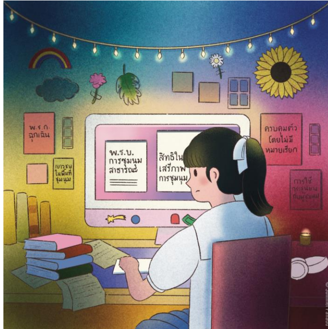
ภาพวาดแสดงให้เห็นถึงแนวคิดขณะกำลังศึกษากฎหมายไทยเพื่อเตรียมตัวสำหรับการไปชั้นศาล / © Amnesty International / Summer Panadd

กฎหมายอาญาอีกตัวที่ใช้เพื่อพุ่งเป้าจัดการกับเด็กในการชุมนุมประท้วงคือกฎหมายหมิ่นพระบรมเดชานุภาพ (ประมวลกฎหมายอาญา มาตรา 112) ที่บัญญัติว่า “ผู้ใดหมิ่นประมาท ดูหมิ่น หรือแสดงความอาฆาตมาดร้ายพระมหากษัตริย์ พระราชินี รัชทายาท หรือผู้สำเร็จราชการแทนพระองค์ ต้องระวางโทษจำคุกตั้งแต่ 3 ปีถึง 15 ปี” 74 แอมเนสตี อินเทอร์เน็ต เนชั่นแนล ได้แสดงข้อห่วงกังวลในหลายกรณีอยู่เป็นประจำเกี่ยวกับการใช้กฎหมายหมิ่นประมาทกษัตริย์เพื่อลงโทษและจำคุกบุคคลที่แสดงเสรีภาพในความคิดเห็นโดยสงบ รวมถึงคำพิพากษาของศาลเมื่อ พ.ศ. 2564 ที่จำคุก “อัญชัญ” อดีตข้าราชการ เป็นระยะเวลา 87 ปี เนื่องจากได้เผยแพร่คลิปในรายการทอล์กโชว์ออนไลน์ที่มีการแสดงความคิดเห็นที่หมิ่นประมาทกษัตริย์ 75