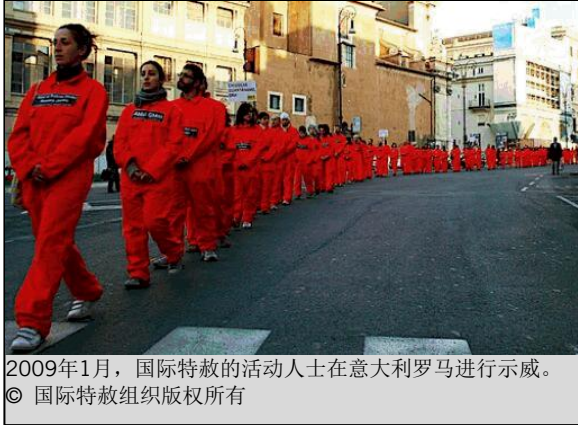
2009年1月，国际特赦的活动人士在意大利罗马进行示威。

行政令本身仅要求评估“在依据美国宪法第三条款建立的法院对此类人员提出起诉是否可行”。行政令没有排除军事法庭审判或军事委员会审判的可能性。