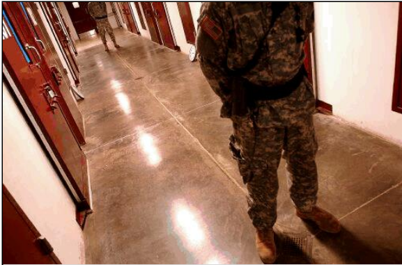
2006年11月，美军士兵守卫在关塔纳摩拘留营第5号营地的牢房外。

政府没有适当信息来说明某些拘留的正当性，这些解释的理由是无关紧要的。如果政府无法提供最基本的法律和事实依据来拘留某人，此人就应立即获释。人人都应享有自由和安全权利，如果这些人不予释放，他们的权利就受到侵犯，政府也因而违反禁止任意拘留的国际准则。