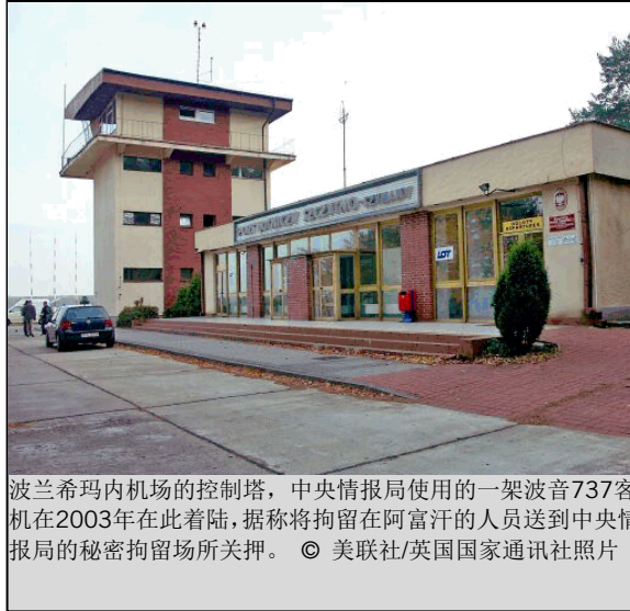
波兰希玛内机场的控制塔，中央情报局使用的一架波音 737 客机在 2003 年在此着陆，据称将拘留在阿富汗的人员送到中央情报局的秘密拘留场所关押。

但在 2009 年 4 月 16 日，当司法部公布了法律顾问办公室在 2002 年和 2005 年为中央情报局编写的 4 份法律意见书时，奥巴马总统和司法部长霍尔德都称，任何“真诚”地依据法律意见书中的建议而行事的人都不会被起诉。意见书所许可的审问方法包括有红十字国际委员会的报告中描述的手段，即对遭到与外界隔绝的秘密关押的人员实施水刑、剥夺睡眠、折磨性姿势、对恐惧症的利用、强迫裸体和冷水浸泡。