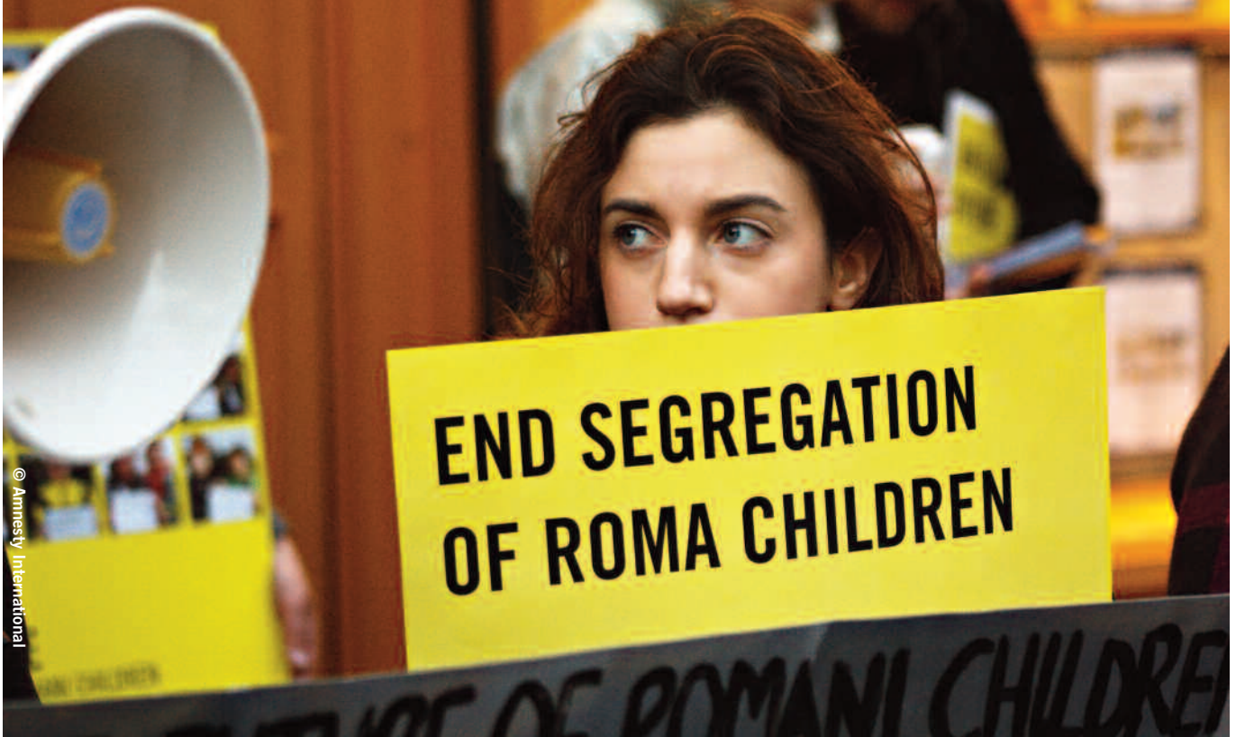
Demonštrácia za ukončenie segregácie rómskych detí pred slovenským veľvyslanectvom v Londýne, 2010.