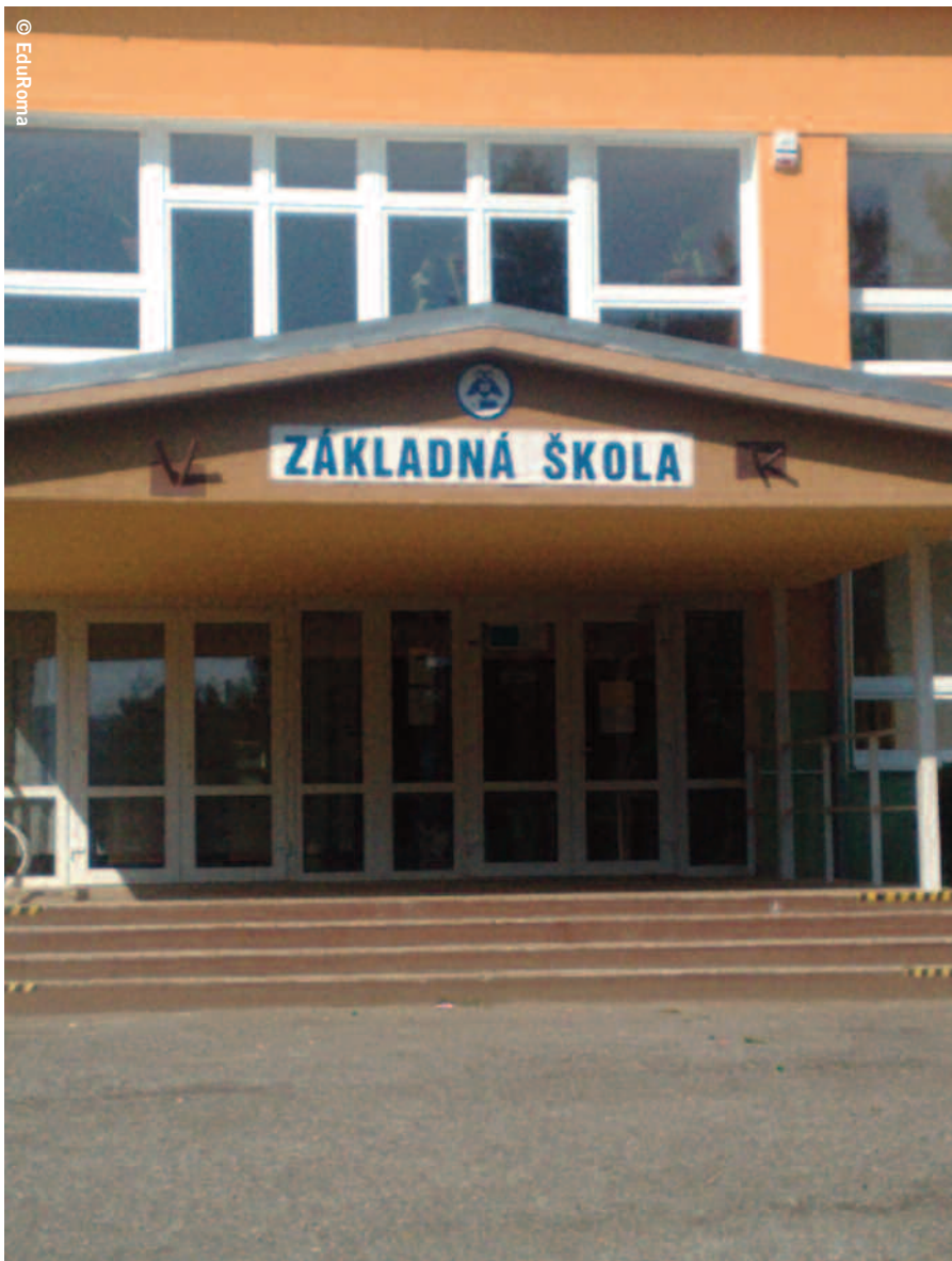
Pred základnou školou v Šarišských Michalanoch, východné Slovensko, 2013.

škole žalobu na okresnom súde. Poradňa argumentovala, že umiestnenie rómskych detí do oddelených tried bolo diskriminačné a porušovalo právo na rovný prístup k vzdelaniu.