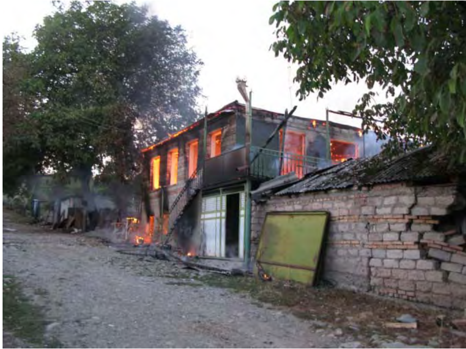
Охваченные огнём дома в грузинском селе Эредви в Южной Осетии, 26 августа 2008 года.