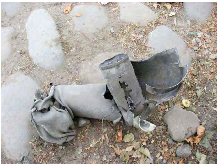
Остатки снаряда, попавшего один из домов на улице Тельмана в Цхинвали (Южная Осетия).

«Стрелять по селу начали 7 августа. Сначала обстрел шёл на краю села, а затем начали стрелять по центру. Никто не ожидал, что начнётся обстрел центра села. Отец волновался за нас и вышел из дома. Он вышел, чтобы только посмотреть, что происходит. В этот момент рядом с ним упали две бомбы, и его убило осколками. Два дня мы оставались там, чтобы его похоронить. Обстрел всё не прекращался. Восьмого пришли грузины, с танками. Во вторую ночь обстрел был сильнее всего, били ракетами «Град» и артиллерией. Два снаряда упали на наш дом, когда мы находились на первом этаже».