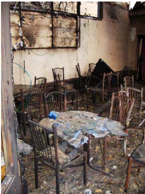
Разбомбленное кафе в центре Цхинвали (Южная Осетия), август 2008 года.