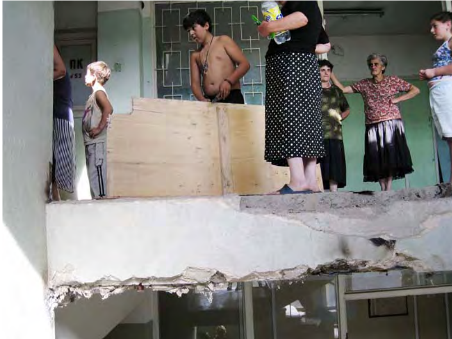
Вынужденные переселенцы в бывшем военном учреждении в Тбилиси, превращённом в центр для вынужденных переселенцев. Тбилиси, 20 августа 2008 года.