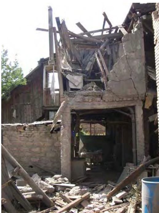
Дом в Цхинвали (Южная Осетия), разрушенный ракетой «Град».

«Для обеспечения уважения и защиты гражданского населения и гражданских объектов стороны, находящиеся в конфликте, должны всегда проводить различие между гражданским населением и комбатантами, а также между гражданскими объектами и военными объектами и соответственно направлять свои действия только против военных объектов».