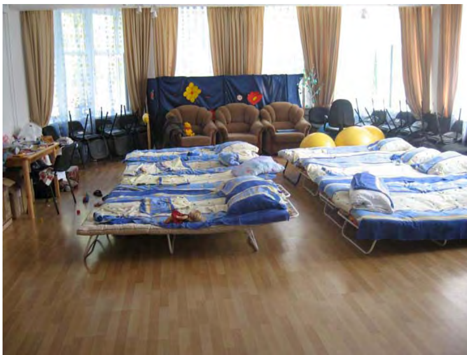
Спальные места в центре для беженцев в Северной Осетии (Российская Федерация), 24 августа 2008 года.

Как показали наблюдения Amnesty International, российские службы экстренной помощи успешно справлялись с удовлетворением важнейших медицинских и материальных нужд лиц, временно размещённых на территории Российской Федерации. После возвращения большинство из них смогли снова поселиться в своих домах, которые либо не пострадали, либо нуждались лишь в мелком ремонте, таком как замена оконных стёкол. На момент составления настоящего доклада лица, чьи дома в Южной Осетии были полностью разрушены, на период восстановительных работ разместились в немногочисленных государственных зданиях или поселились у друзей. Уже начались восстановительные работы и оказание помощи, для чего со всей Российской Федерации прибыли материалы и строители. Тем не менее, пока неясно, удастся ли к зиме привести сильно пострадавшие дома в пригодное для жизни состояние.