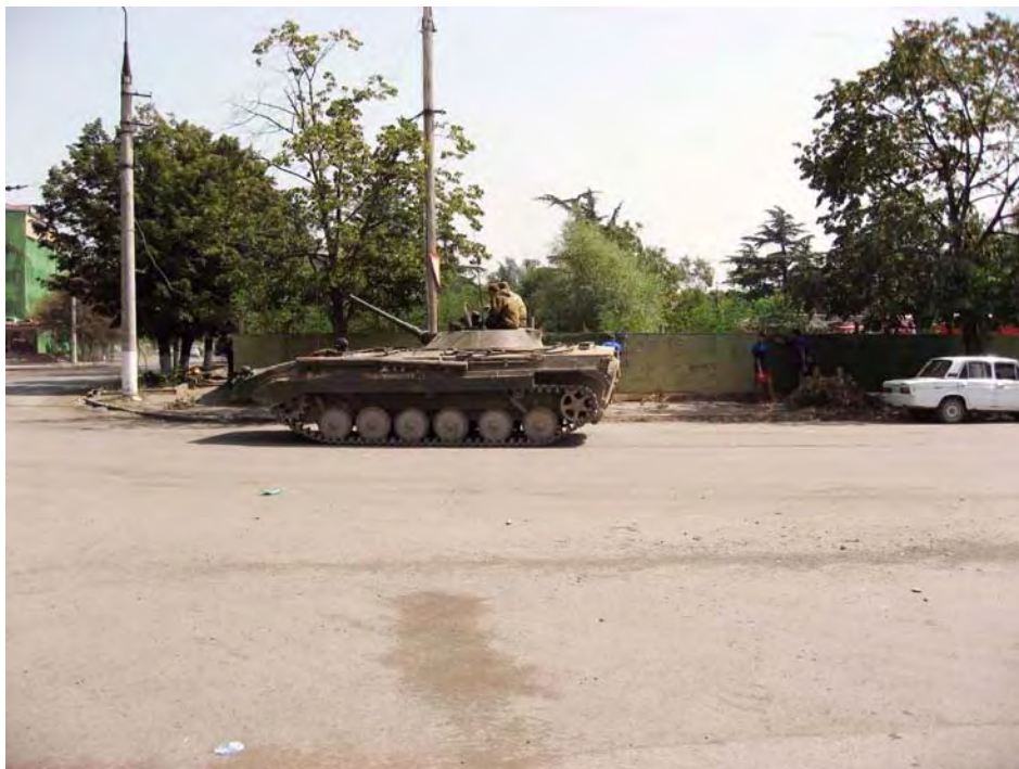
Российская боевая машина в Цхинвали (Южная Осетия), 26 августа 2008 года.