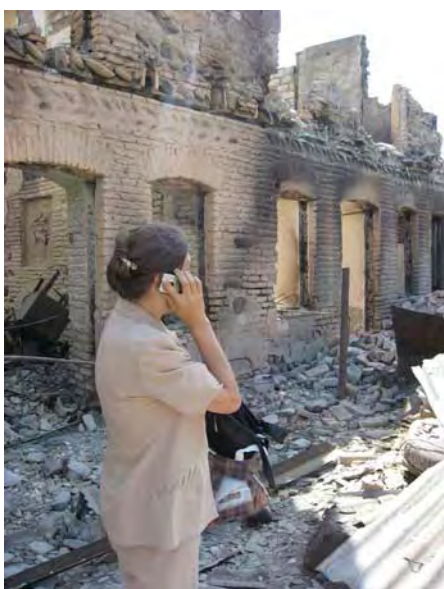
Женщина стоит перед развалинами, оставшимися от её дома на улице Тельмана в Цхинвали (Южная Осетия), 24 августа 2008 года.

С точки зрения международного права, несоразмерное нападение 25 считается военным преступлением, наряду с совершением нападения, которое становится причиной гибели или увечья гражданских лиц или ущерба гражданским объектам. 26 Незаконное, бессмысленное и крупномасштабное уничтожение и присвоение имущества, не вызванное военной необходимостью, является военным преступлением. 27