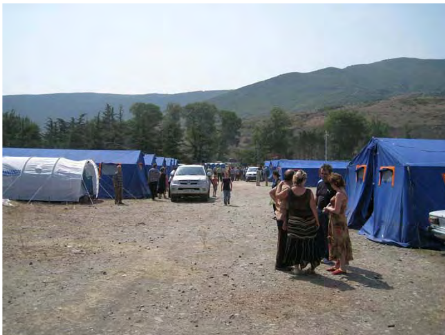
Лагерь для вынужденных переселенцев около Гори (Грузия), 29 сентября 2008 года.

Хотя действия властей при поступлении массовой первой волны переселенцев с 8 по 12 августа отвечали требованиям обстановки, сохраняется серьёзная обеспокоенность касательно долгосрочных перспектив для лиц, не имеющих возможности вернуться. В основном эта обеспокоенность связана с городом Гори и его окрестностями. Там, по данным официальной грузинской статистики, в настоящее время находятся 248 палаток, служащих убежищем для 2300 вынужденных переселенцев, среди которых более 700 детей в возрасте до 17 лет 68 . Представители Amnesty International посетили Гори 29-30 августа и ознакомились с условиями в палаточном лагере, организованном УВКБ на футбольной площадке в центре города, а также побывали в нескольких школах и детских садах, где разместились беженцы. По наблюдениям Amnesty International, наиболее насущные потребности размещённых в этих местах людей обеспечиваются нормально: представители организации наблюдали за раздачей различных продуктов питания в достаточных количествах, а опрошенные беженцы подтвердили, что всё самое необходимое у них есть. Тем не менее, сохранялась обеспокоенность в связи с увеличением числа беженцев и необходимостью обеспечить их жильём на длительный срок ввиду скорого начала учебного года и приближения зимы.