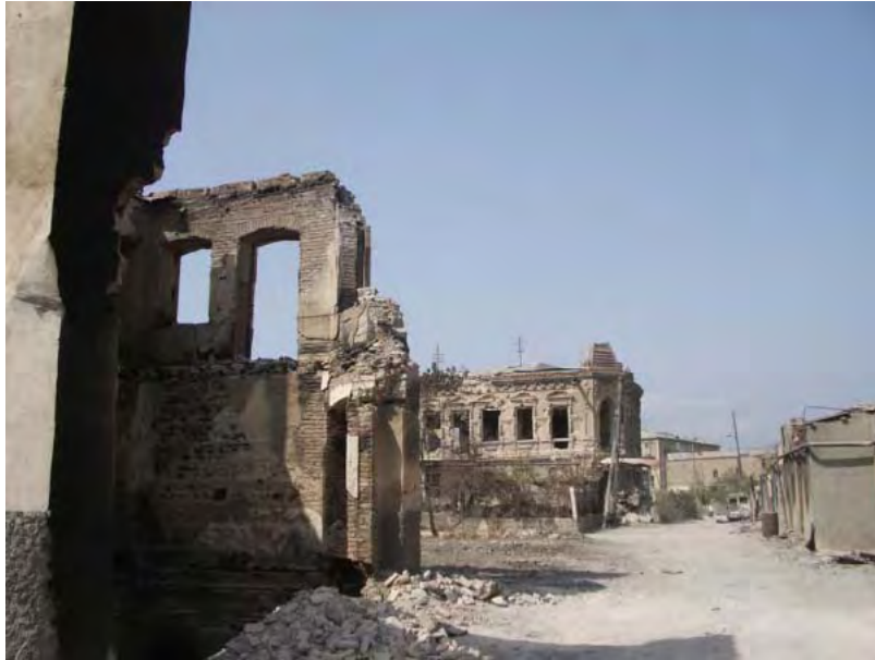
Разрушенные здания на улице Тельмана в Цхинвали (Южная Осетия), 29 сентября 2008 года.