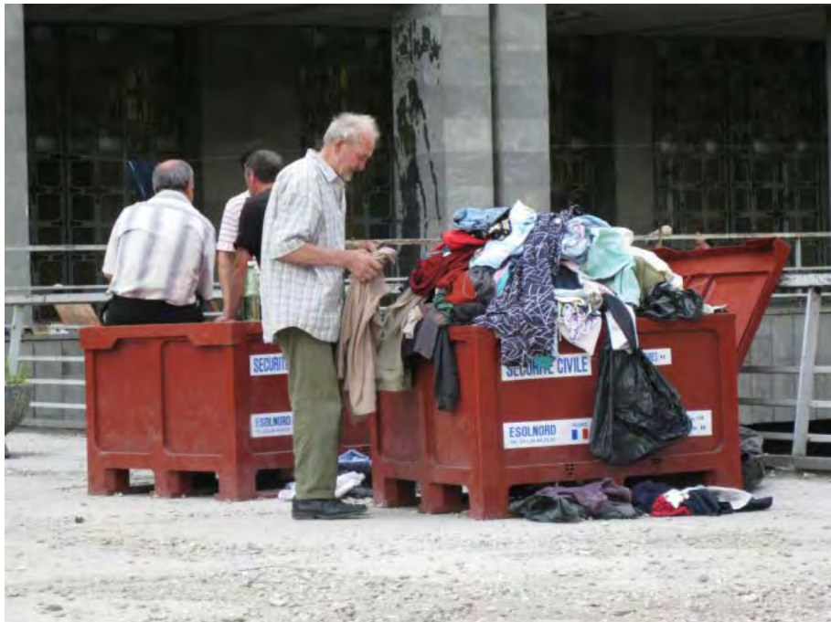
Центр размещения вынужденных переселенцев в Тбилиси (Грузия), 20 августа 2008 года.