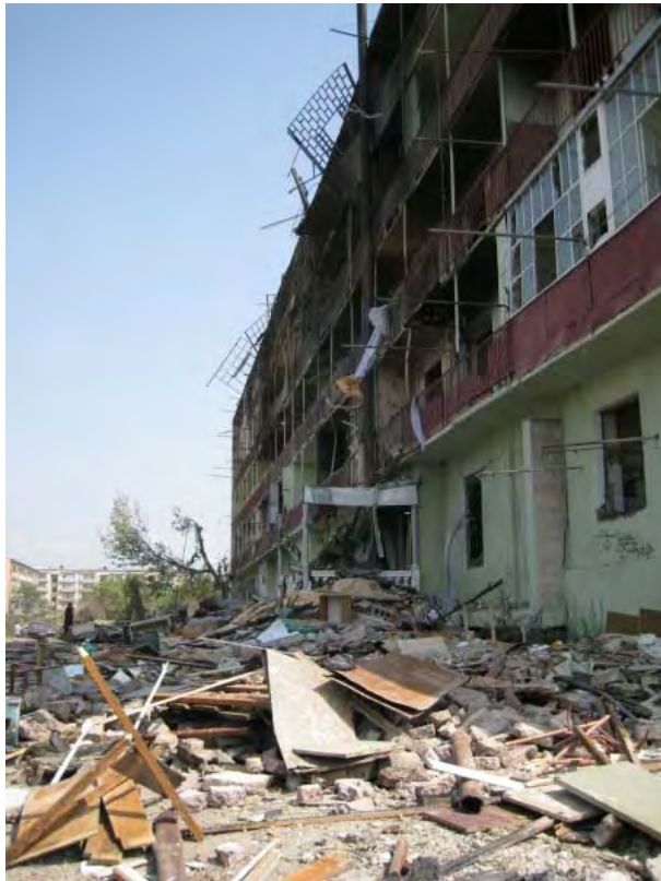
Разбомбленное здание в Гори (Грузия), 29 сентября 2008 года.