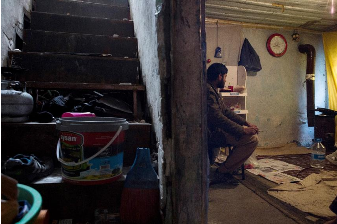
Ένας Αφγανός αιτών άσυλο που ζει στην Κωνσταντινούπολη. Οι Αφγανοί δεν έχουν καμία ρεαλιστική προοπτική είτε να ενσωματωθούν στην Τουρκία είτε να επανεγκατασταθούν σε άλλη χώρα.