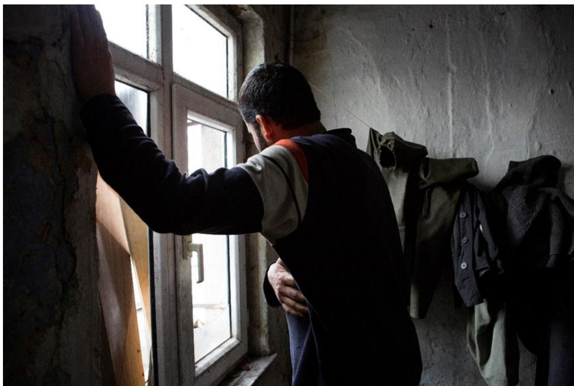
Ένας Αφγανός αιτών άσυλο κοιτάζει έξω από το διαμέρισμά του στην Κωνσταντινούπολη