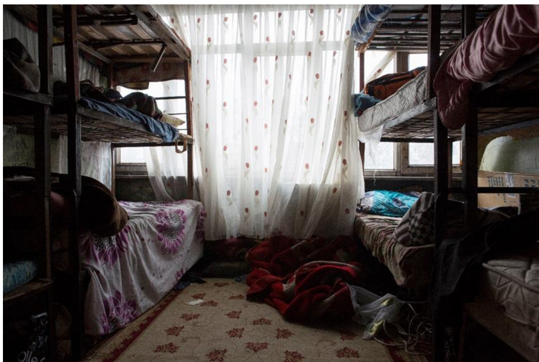
Περίπου 12 αιτούντες άσυλο από το Αφγανιστάν ζουν σε αυτό το δωμάτιο στην Κωνσταντινούπολη, κάτω από το οποίο βρίσκεται μια βιομηχανική επιχείρηση, όπου τα ανακυκλώσιμα υλικά που συλλέγουν από τα σκουπίδια ζυγίζονται και ταξινομούνται.