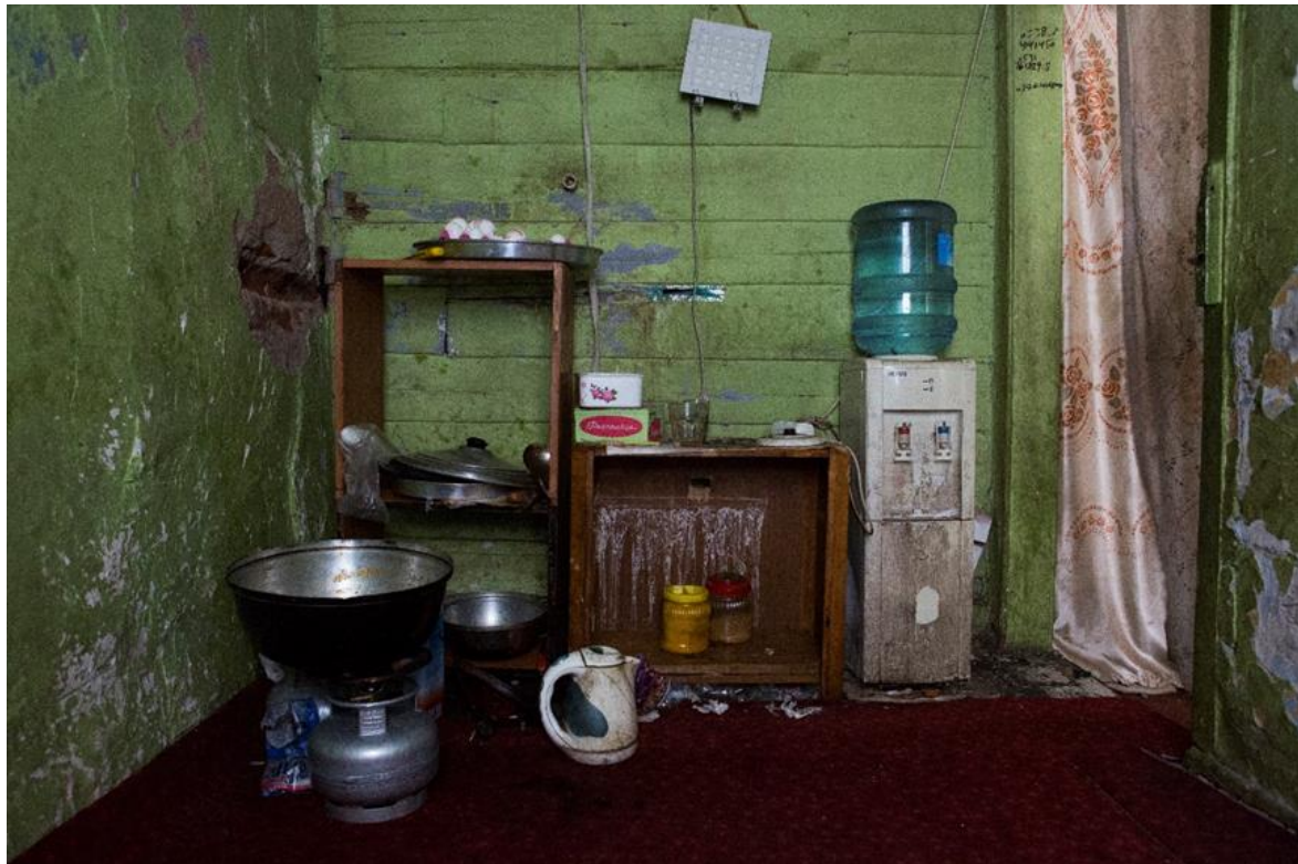
Η κουζίνα που χρησιμοποιούν 15 Αφγανοί και Πακιστανοί αιτούντες άσυλο οι οποίοι ζουν στην Κωνσταντινούπολη.

δεν εφαρμόζονται σε όλες τις περιπτώσεις με τον ίδιο τρόπο ή κάποιες φορές δεν εφαρμόζονται καθόλου. 99 Οι κυβερνητικές υπηρεσίες σε επίπεδο επαρχιών δεν έχουν τους πόρους για να ανταποκριθούν στις ανάγκες διαβίωσης όλων των αιτούντων Διεθνή Προστασία στις περιοχές τους, και η εισροή Σύριων υπό Προσωρινή Προστασία έχει καταπονήσει ακόμα περισσότερο αυτές τις υπηρεσίες. 100 Για παράδειγμα, σε μια έρευνα που αφορούσε πάνω από 10.000 Σύριους πρόσφυγες στο Σουλτάν Μπεϊλί, ένα εργατικό προάστιο της Κωνσταντινούπολης, ούτε ένα άτομο δεν είπε ότι είχε λάβει οποιαδήποτε οικονομική στήριξη από το κράτος. 101