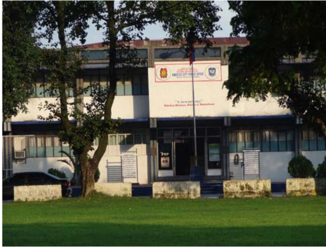
Fig. 2 – Tomas Pepito Police Camp, diin gi-torture si Jerryyme Corre.

(gibana-bana nga US$ 220) ug mopirma sa usa ka kasabotan nga dili siya manghilabot sa kaso ni Jerryyme.