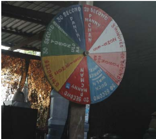
Fig. 4 – Usa ka "roleta sa torture" sa usa ka wala gibutyag nga safe house sa pulisya sa probinsya sa Laguna, habagatang bahin sa Manila, Pilipinas.