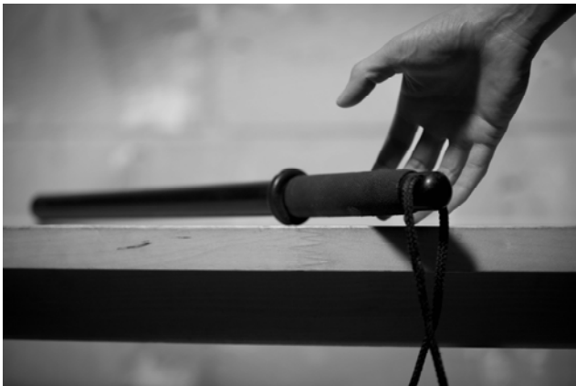
Fig. 8 – Balik-balik nga gibunalan sa mga opisyal sa pulisya ang mga biktima sa torture, apil si Rowelito, gamit ang bunal, mga truncheon o mga batuta (interpretasyon nga hulagway base sa testimonya). © Amnesty International

Gihulagway ni Rowelito kung unsa ang nahitabo kaniya sa parkingan: “Giposasan nila ang akong mga kamot sa akong likod ug gibunalan ang akong mga bagtak gamit ang kahoy nga tugsok. Gipuwera nila sa pagsulod sa akong baba ang usa ka trapo ug nagputos og masking tape sa palibot niini. Unya gipahigda nila ako nga nag-atubang sa yuta ang nawong. Gitangtang nila ang mga posas, giisa ang akong mga bukton padulong sa atubangan ug giposasan pag-usab ang akong mga kamot. Gihawiran sa usa ka opisyal sa pulisya ang akong mga kamot ug gihawiran sa laing opisyal sa pulisya ang akong mga tiil. Gibunalan nila ang akong lawas gamit ang bunal ug balik-balik akong gipatiran sa kilid sulod sa mokabat sa 15 ka minuto. Sakit kaayo kadto nga gusto na nakong mamatay ug mawala.”