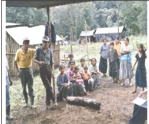
Li k'aleb'aal Santa Inés, sa' xteepal "Alta Verapaz", ke'isiik sa' li wuqub' xb'e li po julio re li chihab' 2005, ab'anan ke'sutq'i wi' chik sa' li na'ajej.

laj "Amnistía Internacional" kextaq'la jun li hu re li Najolomink reheb' laj Tz'ilol Ch'a'ajkilal, sa' li hu ke'xch'olob' chan ru naq wank li ch'a'ajkilal, ut ke'xpatz' aj wi' naq xb'een wa tento xaqab'ankil ani tz'aqal laj eechal re li na'ajej ut chi rix a'an naru rilb'al wi' naru xpatz'b'al li risinkileb' laj k'alom winq. Sa' xkutankil li xtz'iib'ankil li hu a'in toj maji' naqak'ul xsumenkil li hu.