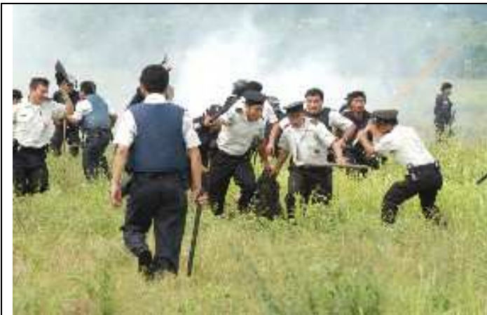
Naab'al li jalamuuch b'ar wi' nak'utun naq yookeb' chi sak'eek laj k'alom winq xb'aaneb' laj k'aak'alanel tenamit. Sa' li jalamuuch a'in yookeb' chi xjukinkil ut xtenlikileb' laj k'alom winq.

Eb' laj k'aak'alanel tenamit ke'xk'at 300 li ochoch rik'in chi xjunil li wank chi sa'. Wank jitom chi rix naq ke'ok sa' eb' li ochoch wankeb' nach' rik'in Nueva Linda, ab'anan moko re ta. 104