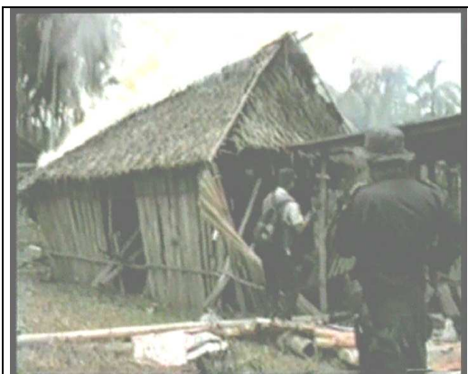
Jun laj k'aak'alanel tenamit ut jun laj k'anjel yookeb' xjuk'inkil jun li ochoch naq yo li isink Chi Tokan.

Li k'aleb'aal kixye naq eb' li ixq ut eb' li kok'al tikto ke'eelalik naq ke'ok chi xkutb'al li rahil sib', ut eb' li winq ke'kana. Sa' li puktasib'aal aatin kiyeeman naq li "Cruz Roja Guatemalteca" kixye naq junmayeb' poyanam ke'lub' xb'aan li sib', wankeb' kok'al sa' xyanqeb'. 77