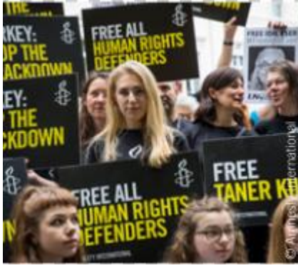
مظاهرة أمام مبنى السفارة التركية في لندن، ١٢ يوليو/ تموز ٢٠١٧.

منظمة العفو الدولية حركة عالمية تضم أكثر من ٧ ملايين شخص يأخذون الظلم على محمل شخصي. ونحن نشن حملات من أجل عالم يتمتع فيه الجميع بحقوق الإنسان.