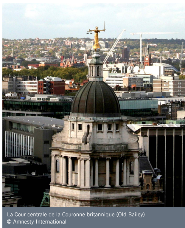
La Cour centrale de la Couronne britannique (Old Bailey)

Amnesty International a exprimé ces préoccupations in extenso dans une lettre au ministre chargé de la Police, de la Criminalité, de la Justice pénale et des Victimes, qui dépend à la fois du ministère de l'Intérieur et du ministère de la Justice.