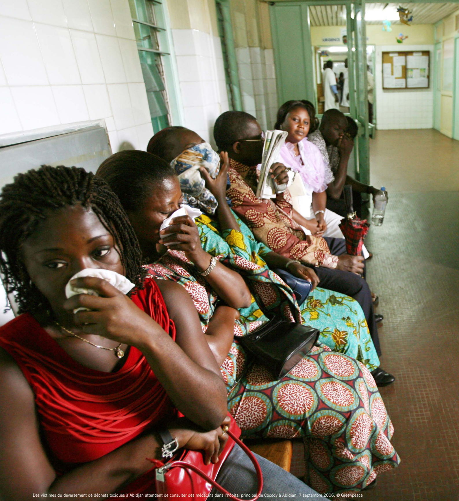
Des victimes du déversement de déchets toxiques à Abidjan attendent de consulter des médecins dans l'hôpital principal de Cocody à Abidjan, 7 septembre 2006.

Amnesty International est un mouvement mondial regroupant plus de 7 millions de personnes qui prennent l'injustice comme une affaire personnelle.