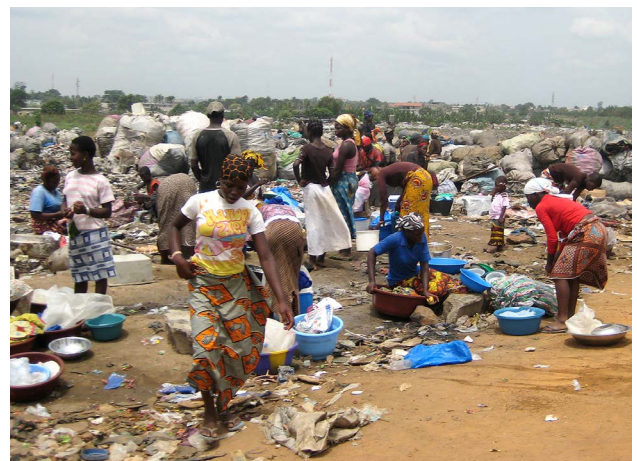
Décharge d'Akouédo, février 2009. Des personnes vivent et travaillent à proximité de l'endroit.

Le présent rapport passe en revue les lacunes du système et formule un certain nombre de recommandations à l'adresse du gouvernement britannique sur la manière d'y remédier. Amnesty International rend publiques sa correspondance avec les autorités britanniques sur cette affaire, ainsi que les informations dont elle dispose concernant l'implication de Trafigura dans la catastrophe.