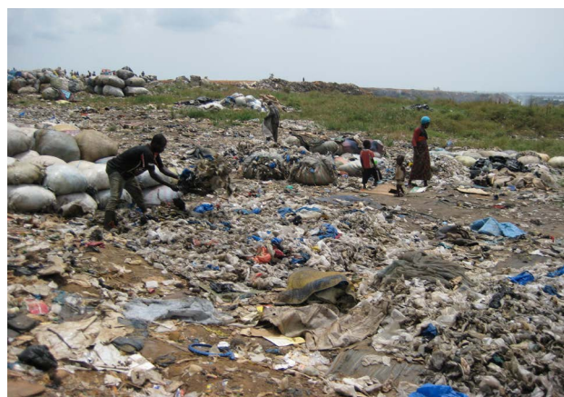
Décharge d'Akouédo. C'est à cet endroit que Trafigura a demandé à une petite entreprise ivoirienne de déverser de grandes quantités de déchets toxiques non traités.

Pour plus de précisions concernant les échanges d'Amnesty International avec les autorités dans cette affaire, voir plus loin notre « Chronologie de notre appel en faveur d'une enquête ».