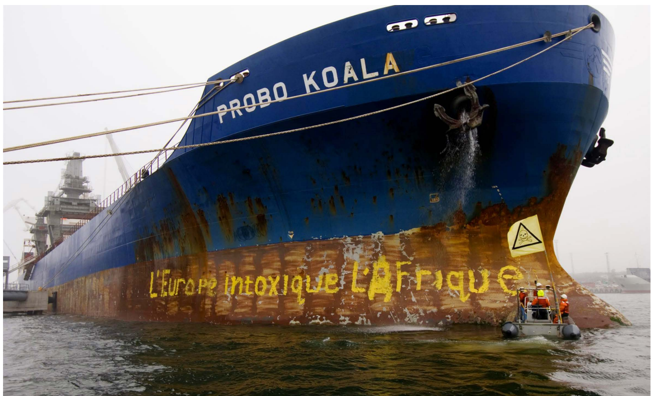
Des militants de Greenpeace bloquent le navire du Probo Koala pour l'empêcher de quitter le port estonien de Paldiski. Le navire a été surnommé scène de crime toxique de l'UE par les militants, et ces derniers ont appelé les autorités estoniennes à ouvrir une enquête sur le navire, septembre 2006.

Suite à un appel téléphonique passé près d'un mois plus tard par Amnesty International au représentant du parquet pour savoir où en était le dossier, le Crown Prosecution Service (CPS, parquet) nous a fait savoir par écrit que les questions que nous soulevions n'étaient pas de son ressort