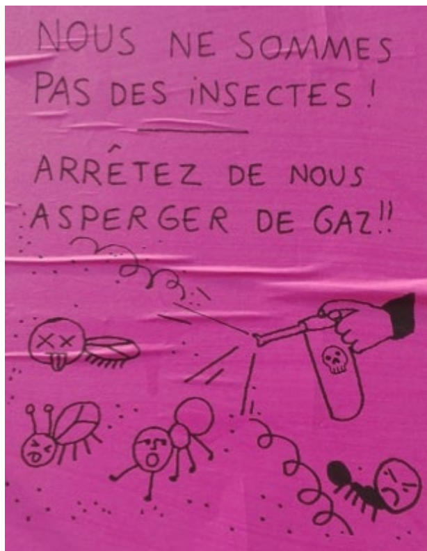
« Nous ne sommes pas des insectes ! Arrêtez de nous asperger de gaz ! » Affiche photographiée à Calais, juillet 2018